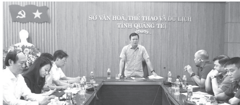
Quang cảnh cuộc họp - Ảnh: H.T

đơn vị liên quan chủ động triển khai nhiệm vụ theo kế hoạch, tăng cường phối hợp chặt chẽ, kịp thời xử lý những vấn đề phát sinh, bảo đảm 2 giải đấu được tổ chức an toàn, chuyên nghiệp, tạo ấn tượng tốt đẹp đối với các vận động viên và du khách; góp phần quảng bá hình ảnh Quảng Trị là điểm đến hấp dẫn của các sự kiện thể thao, văn hóa và du lịch.