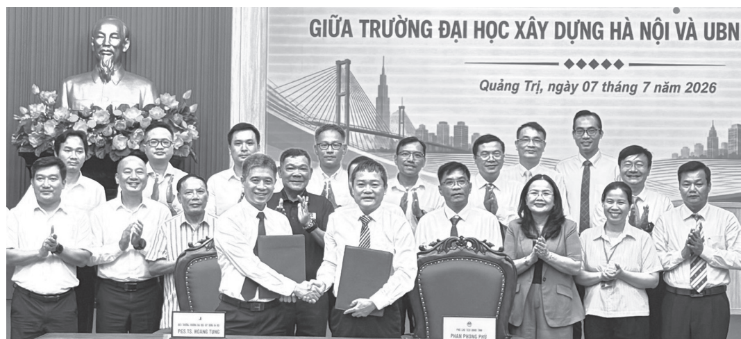
UBND tỉnh và Trường đại học Xây dựng Hà Nội ký kết biên bản ghi nhớ hợp tác - Ảnh: N.L

Chiều 7/7/2026, UBND tỉnh có buổi làm việc với Trường đại học Xây dựng Hà Nội nhằm trao đổi, thống nhất các nội dung hợp tác trong đào tạo, bồi dưỡng nguồn nhân lực, nghiên cứu khoa học, tư vấn, phản biện và chuyển giao công nghệ trong các lĩnh vực xây dựng, quy hoạch, hạ tầng và phát triển đô thị.