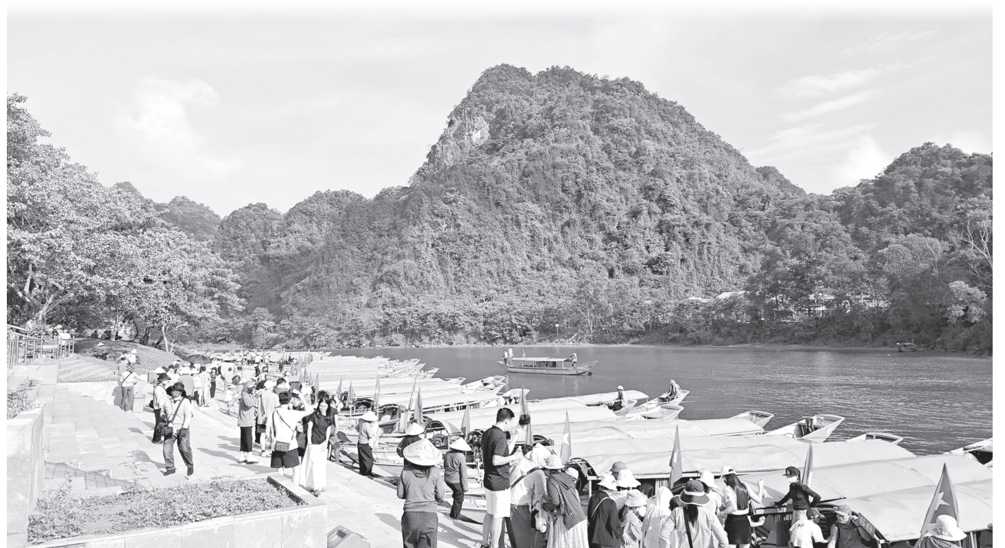
Mùa du lịch sôi động là thời điểm nở rộ các hình thức lừa đảo đặt phòng trực tuyến. Trong ảnh: Du khách tại bến thuyền Trung tâm du lịch Phong Nha-Kẻ Bàng

Mùa hè là thời điểm du lịch sôi động nhất trong năm. Cùng với sự phát triển của các nền tảng số, việc đặt phòng trực tuyến đã trở thành lựa chọn quen thuộc bởi sự nhanh chóng và thuận tiện. Nhưng cũng chính sự tiện lợi ấy đang bị các đối tượng xấu lợi dụng để giăng bẫy. Khi ranh giới giữa thật và giả trên không gian mạng ngày càng mong manh, chỉ một cuộc gọi xác minh, một lần đối chiếu thông tin hay vài phút kiểm tra từ những nguồn chính thống cũng có thể giúp du khách tránh được những tổn thất không đáng có, để mỗi chuyến đi thực sự bắt đầu bằng niềm vui thay vì sự tiếc nuối.