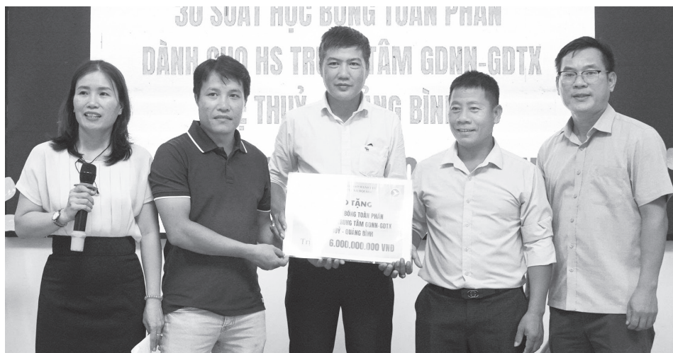
Đại diện HLC Holdings trao học bổng cho các em học sinh Trung tâm giáo dục nghề nghiệp-giáo dục thường xuyên Lệ Thủy

Nhằm hỗ trợ học sinh, thanh niên tiếp cận cơ hội học tập, đào tạo nghề và giải quyết việc làm, Công ty TNHH Xã hội Cộng đồng Lãnh đạo Hạnh phúc (HLC Holdings) đã triển khai chương trình học bổng "Ươm mầm tri thức". Thông qua chương trình, nhiều học sinh trên địa bàn tỉnh được hỗ trợ đào tạo nghề, giải quyết việc làm, góp phần nâng cao chất lượng nguồn nhân lực trẻ tại địa phương.