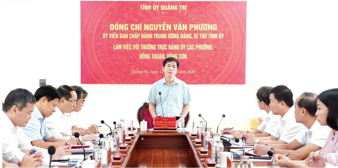
Đồng chí Nguyễn Văn Phương, Ủy viên Trung ương Đảng, Bí thư Tỉnh ủy làm việc với Thường trực Đảng ủy các phường Đồng Thuận, Đồng Sơn

Qua 1 năm triển khai vận hành mô hình chính quyền địa phương 2 cấp, dưới sự lãnh đạo, chỉ đạo quyết liệt của Tỉnh ủy, Ban Thường vụ Tỉnh ủy, tỉnh Quảng Trị đã cơ bản hoàn thành các mục tiêu, chỉ tiêu, nhiệm vụ về sắp xếp, tinh gọn tổ chức bộ máy và vận hành mô hình chính quyền mới, mang lại những hiệu quả tích cực đối với sự phát triển kinh tế-xã hội, bảo đảm quốc phòng-an ninh, nâng cao đời sống vật chất, tinh thần cho Nhân dân.