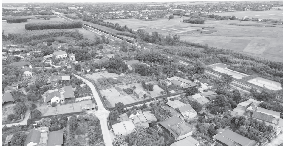
Xã Trường Phú đổi mới hôm nay

Lĩnh vực chăn nuôi tiếp tục phát triển ổn định, tổng đàn vật nuôi được duy trì và phát triển với hơn 1.600 con trâu, bò; hơn 5.000 con lợn và khoảng 135.000 con gia cầm. Công tác phòng, chống dịch bệnh