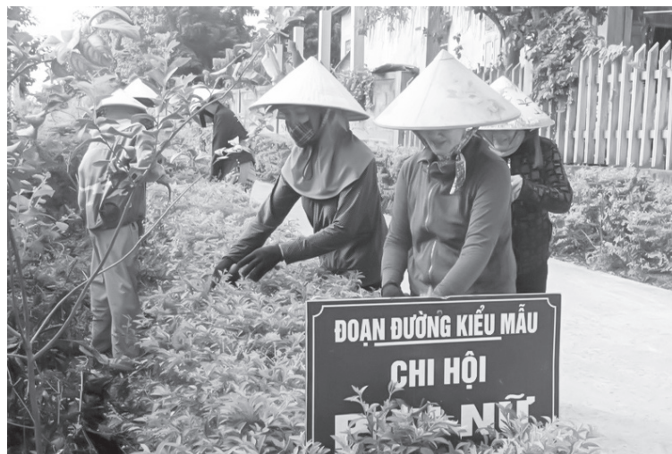
Phụ nữ xã Trường Phú chăm sóc đoạn đường kiểu mẫu

Từ những buổi họp định kỳ, chị em cùng trao đổi kinh nghiệm chăm lo đời sống gia đình, nuôi dạy con tốt, giữ gìn vệ sinh nhà