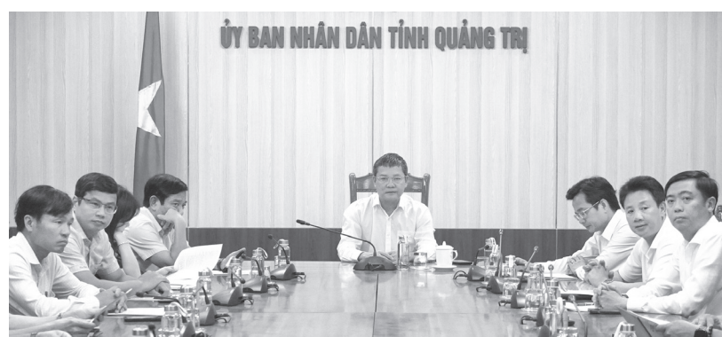
Đồng chí Phan Phong Phú, Phó Chủ tịch UBND tỉnh dự và chủ trì hội nghị tại điểm cầu tỉnh Quảng Trị