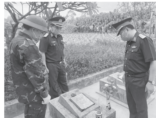
Đoàn công tác kiểm tra các lực lượng đang thực hiện nhiệm vụ tại Nghĩa trang liệt sĩ Ba Dốc