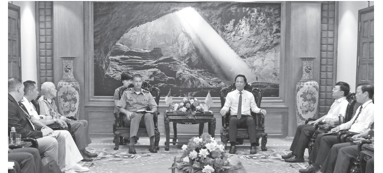
Toàn cảnh buổi làm việc