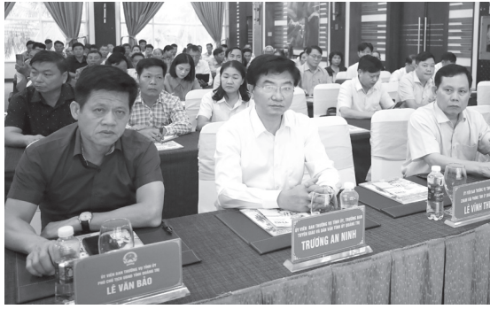
Các đại biểu tham dự hội nghị