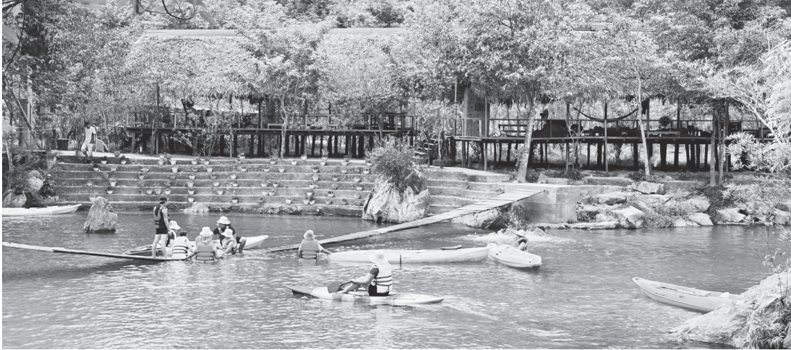
Du khách thích thú trải nghiệm chèo thuyền trên suối Kiều tại Khu du lịch sinh thái Sơn Kiều

Giữa đại ngàn Trường Sơn, nơi những cánh rừng nguyên sinh vẫn lưu giữ vẻ đẹp hoang sơ của đất trời, một "báu vật" thiên nhiên đang từng ngày được đánh thức. Không chỉ là hệ thống hang động kỳ vĩ với những giá trị địa chất độc đáo, Khu du lịch sinh thái Sơn Kiều còn là câu chuyện về sự đổi thay trong cách ứng xử với rừng.