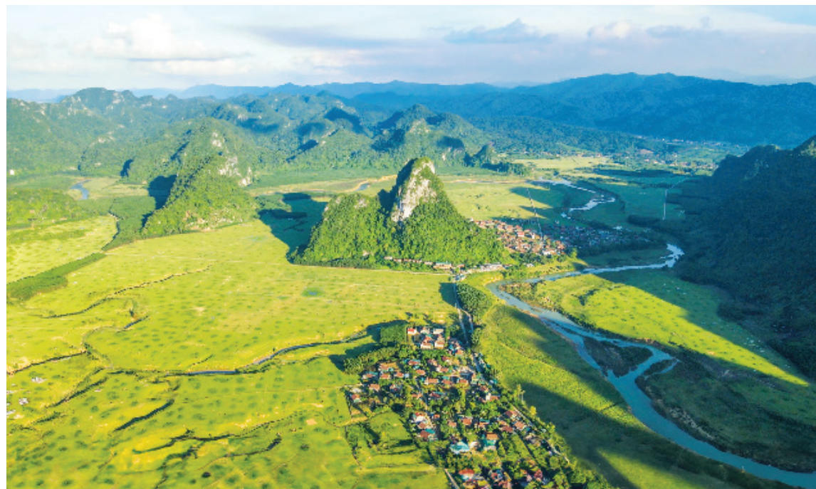
Nét đẹp Tân Hóa

Mọi định hướng phát triển đều hướng tới mục tiêu nâng cao chất lượng sống của người dân, hài hòa giữa tăng trưởng kinh tế với phát triển xã hội, bảo vệ môi trường và thích ứng với biến đổi khí hậu.