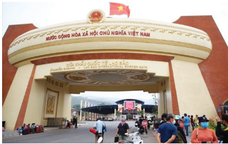
Cửa khẩu quốc tế Lao Bảo

Trong bối cảnh chuỗi cung ứng toàn cầu đang tái cấu trúc, việc đồng bộ hạ tầng biển, cửa khẩu, cao tốc, đường sắt và hàng không sẽ tạo lợi thế cạnh tranh mới, đưa Quảng Trị