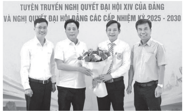
Báo cáo viên của Đảng bộ PC Quảng Trị tham gia hội thi báo cáo viên, tuyên truyền viên giỏi năm 2026

Nhiệm kỳ 2025-2030, Đảng bộ PC Quảng Trị xác định khoa học công nghệ, đổi mới, sáng tạo và chuyển đổi số (KHCN, ĐMST và CDS) chính là khâu đột phá quan trọng, tạo động lực mạnh mẽ để phát triển các hoạt động SXKD, đầu tư xây dựng, tài chính của công ty theo hướng hiện đại. Trên cơ sở đó, PC Quảng Trị đặt