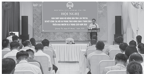
Toàn cảnh hội nghị

Triển khai nhiệm vụ 6 tháng cuối năm, các cấp Hội Nông dân tỉnh tập trung thực hiện tốt công tác tuyên truyền, giáo dục chính trị, tư tưởng, nâng cao nhận thức cho cán bộ, hội viên, nông dân về chủ trương, đường lối của Đảng, chính sách, pháp luật của Nhà nước và nghị quyết của hội; tiếp tục thực hiện có kết quả Nghị quyết số 04, 05, 06-NQ/HNDTW