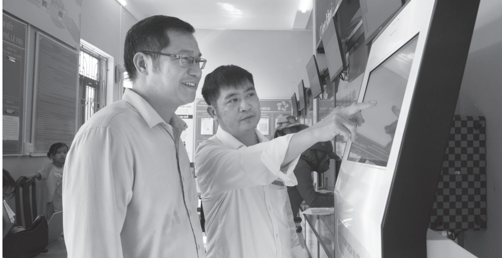
Hoạt động giải quyết thủ tục hành chính tại Trung tâm Phục vụ hành chính công xã Tân Mỹ

Sau 1 năm vận hành mô hình chính quyền địa phương 2 cấp, xã Tân Mỹ từng bước khẳng định hiệu quả trong lãnh đạo, điều hành và tổ chức thực hiện nhiệm vụ phát triển kinh tế-xã hội. Từ sản xuất nông nghiệp, kinh tế tập thể đến cải cách hành chính, chuyển đổi số và an sinh xã hội, địa phương đã tạo được nhiều chuyển biến tích cực, góp phần nâng cao đời sống Nhân dân, xây dựng nền tảng cho chặng đường phát triển mới.