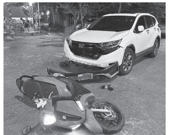
Hiện trường một vụ tai nạn giao thông liên quan đến xe mô tô