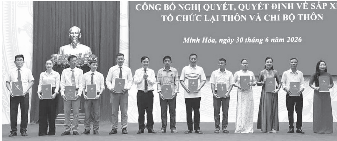
Xã Minh Hóa công bố quyết định chỉ định đội ngũ nhân sự cán bộ thôn trên địa bàn

Cùng với việc thực hiện chủ trương sắp xếp, sáp nhập, quy mô các thôn, tổ dân phố (TDP) ngày càng lớn, đòi hỏi vai trò, trách nhiệm của đội ngũ cán bộ cơ sở ngày càng cao. Vì vậy, việc lựa chọn nhân sự có chất lượng, trình độ và trẻ hóa không chỉ đáp ứng yêu cầu quy định, mà còn là đòi hỏi cấp thiết từ thực tế.