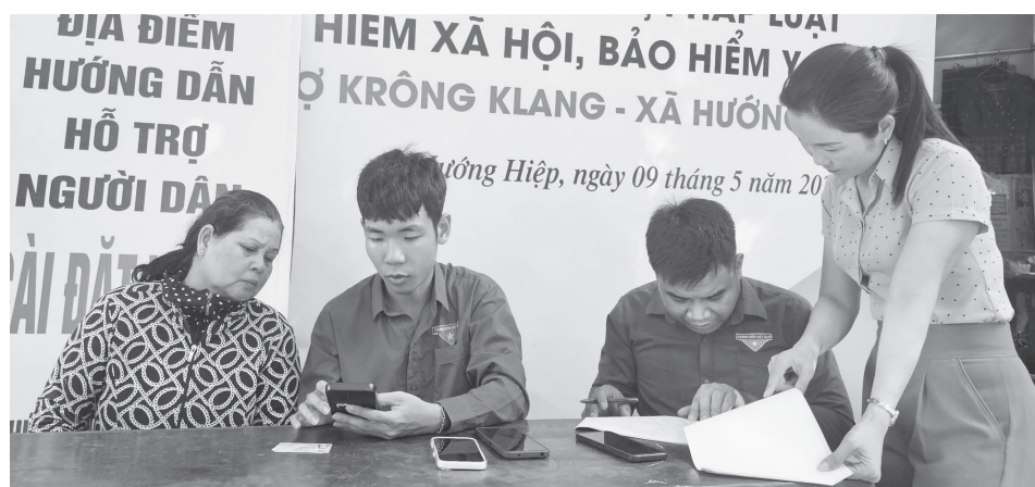
Thành viên Tổ công nghệ số cộng đồng xã Hướng Hiệp hướng dẫn người dân kích hoạt tài khoản định danh mức độ 2

Đạt cao điểm về phát triển ứng dụng dữ liệu dân cư thời gian qua đã tạo nên một làn sóng chuyển đổi số mạnh mẽ tại xã Hướng Hiệp. Bằng các giải pháp linh hoạt, sáng tạo và sự vào cuộc quyết liệt của cả hệ thống chính trị, địa phương vùng cao này đang từng bước bắt nhịp, làm chủ các tiện ích công nghệ hiện đại một cách hiệu quả.