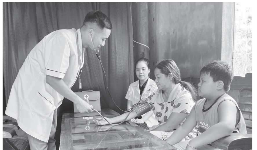
Trạm Y tế xã Kim Điền đưa các dịch vụ y tế đến tận nhà dân

Dù điều kiện cơ sở vật chất còn thiếu thốn, trang thiết bị chưa đáp ứng yêu cầu, nhưng bằng tinh thần trách nhiệm, lòng yêu nghề, đội ngũ cán bộ y, bác sĩ Trạm Y tế xã Kim Điền từng ngày vượt qua khó khăn để trở thành điểm tựa chăm sóc sức khỏe tin cậy của Nhân dân.