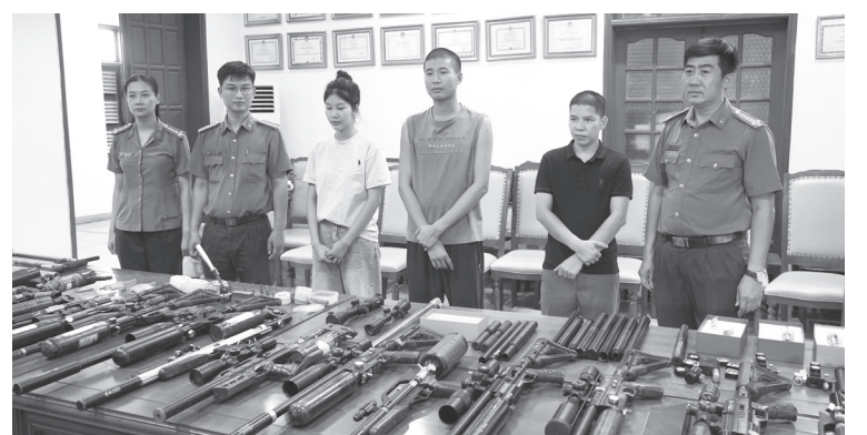
Các đối tượng bị bắt giữ trong chuyên án

giữ 57 súng các loại, hơn 2.000 viên đạn chì và nhiều linh kiện khác, gồm: Bình nén, bệ tỷ, van khí nén; đạn chì, bơm cao áp, khuôn đúc đạn chì, cuộn thiếc, bộ cò súng... Các đối tượng đã lợi dụng mạng xã hội, các sàn thương mại điện tử, ứng dụng nhắn tin và dịch vụ chuyển phát để quảng cáo, giao dịch, mua bán. Đồng thời các đối tượng đã lợi dụng số điện thoại với thông tin đăng ký không chính chủ và thường xuyên thay đổi; đăng ký tài khoản từ nhà cung cấp dịch vụ vận chuyển logistics để tạo, vận chuyển các đơn hàng, thông tin hàng, người gửi hàng được ngụy trang rất tinh vi... Qua đó đã tránh sự phát hiện của