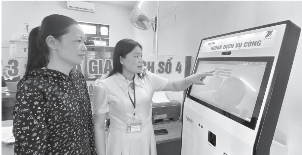
Công chức xã Kim Điền hướng dẫn người dân thực hiện thủ tục hành chính

Sau một năm triển khai mô hình chính quyền địa phương 2 cấp, xã Kim Điền đã từng bước ổn định tổ chức bộ máy, đẩy mạnh cải cách hành chính và chuyển đổi số, tạo nhiều chuyển biến tích cực trong phục vụ người dân và doanh nghiệp. Từ một địa bàn miền núi còn nhiều khó khăn, Kim Điền đang từng bước xây dựng nền hành chính hiện đại, chuyên nghiệp, lấy sự hài lòng của người dân làm thước đo hiệu quả hoạt động của chính quyền.