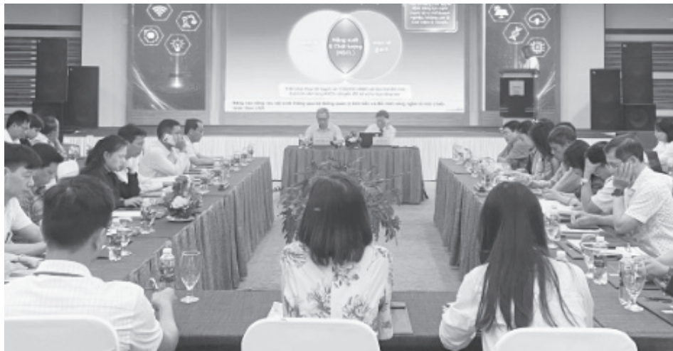
Nhiều tham luận có giá trị thực tiễn cao được trình bày tại hội thảo

Bên cạnh đó, công tác thông tin và tuyên truyền đã được triển khai một cách sâu rộng và đa dạng về hình thức. Đồng thời, 23 lớp tập huấn được tổ chức với hàng trăm học viên tham gia, góp phần nâng cao nhận