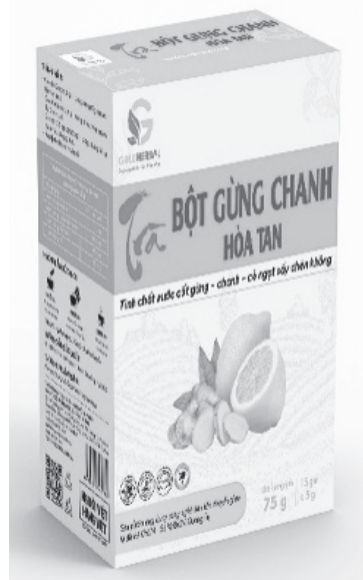
Sản phẩm bột trà gừng chanh hòa tan bảo đảm chất lượng