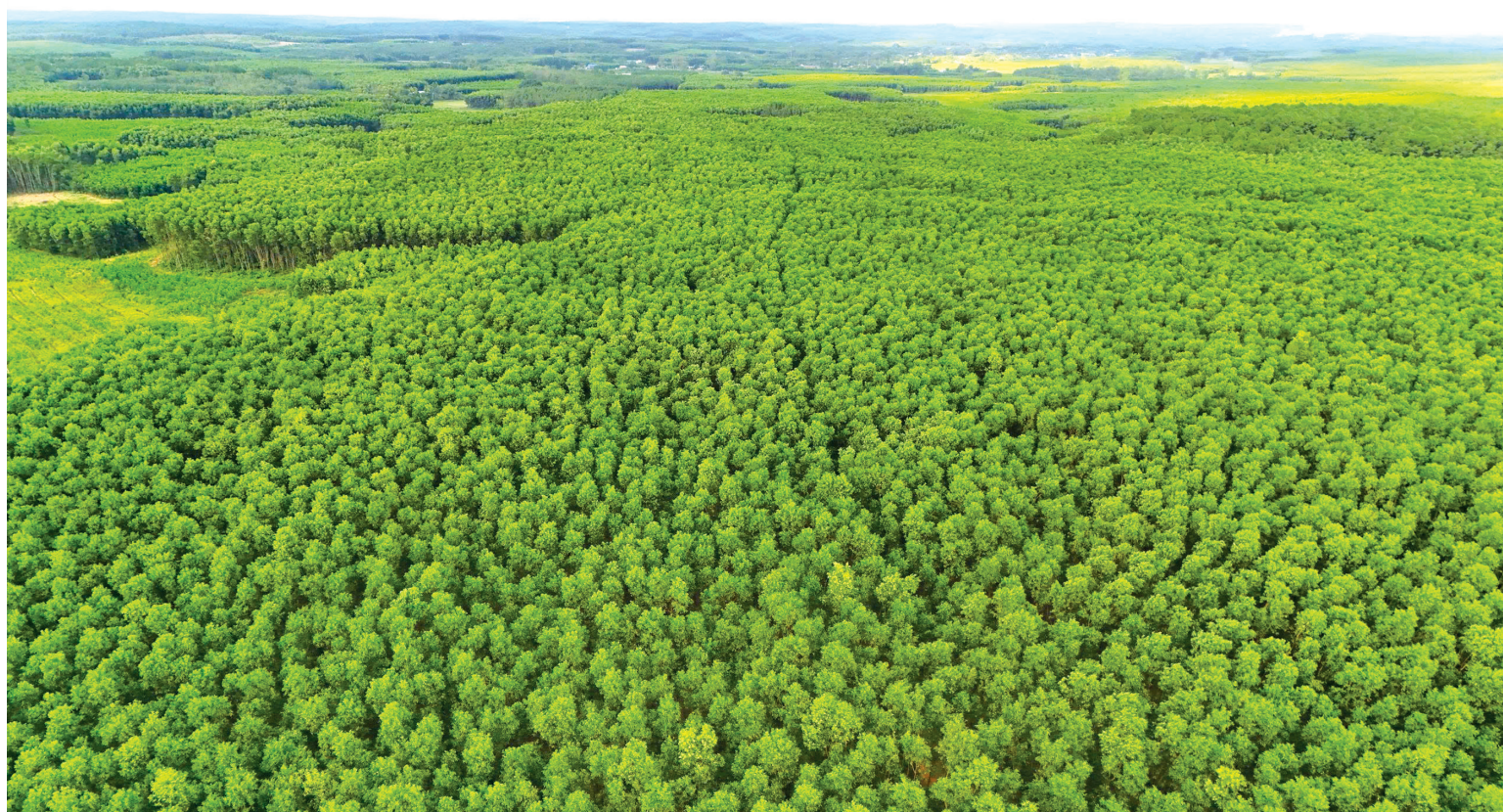
Bạt ngàn rừng xanh đã phủ kín đất đồi, phủ kín những hố bom ở vùng đất Ái Tử, Triệu Phong

Theo ông Thơ, 6 tháng đầu sau khi trồng là khoảng thời gian người làm rừng thấp thỏm nhất. Ngoài nỗi lo thời tiết còn phải thuê người bảo vệ vì trâu bò thả rông thường xuyên phá hoại cây non.