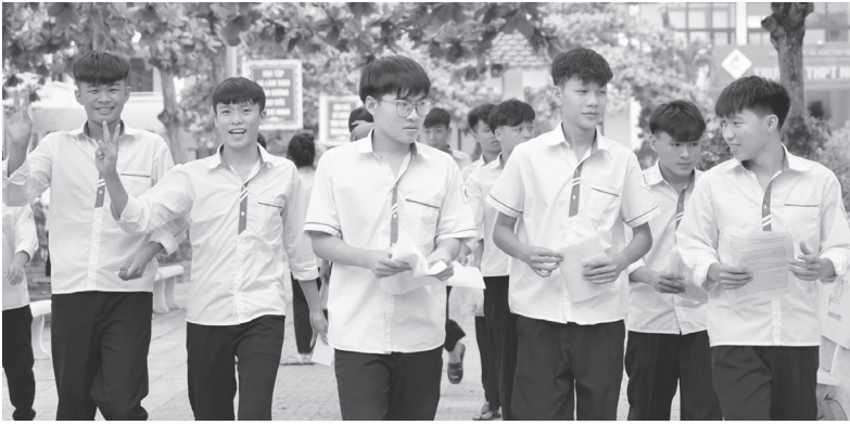
Kết quả kỳ thi tốt nghiệp THPT là cơ sở để thí sinh tham gia xét tuyển vào các trường đại học, cao đẳng

Ngày 1/7/2026, Sở Giáo dục và Đào tạo công bố kết quả kỳ thi tốt nghiệp THPT năm 2026. Kết quả cho thấy chất lượng giáo dục của địa phương tiếp tục được khẳng định với nhiều bài thi đạt điểm cao, trong đó có 108 bài thi đạt điểm tuyệt đối.