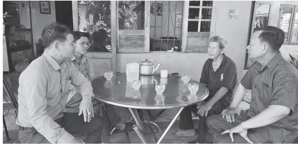
Đại diện cấp ủy và Ban công tác Mặt trận thôn Kim Long gặp gỡ người dân để vận động di dời mồ mả

Đến nay, các địa phương như Vĩnh Định và Mỹ Thủy cơ bản hoàn thành công tác GPMB đối với diện tích đất sản xuất, cũng như khu vực có mồ mả, lăng mộ. Đóng góp vào kết quả đó có vai trò kết nối của các thành viên Ban công tác Mặt trận thôn và trưởng thôn. Dưới sự lãnh