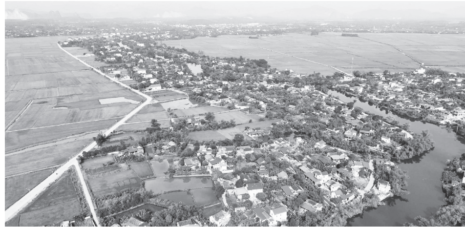
Xã Lệ Ninh tập trung các nguồn lực đầu tư cơ sở hạ tầng, hướng tới mục tiêu phát triển bền vững sau sáp nhập

Một trong những "bài toán" quan trọng trong việc sáp nhập là công tác nhân sự. Xã Lệ Ninh xác định việc bố trí, sử dụng người hoạt động không chuyên trách ở thôn phải bảo đảm tuyệt đối công khai, minh bạch, khách quan và đúng quy định. Về tiêu chí lựa chọn, xã chú trọng giới thiệu những người có uy tín, sức khỏe, tâm huyết, trách nhiệm và có năng lực vận động quần chúng. Đây cũng là cơ hội để từng bước trẻ hóa đội ngũ, nâng cao trình độ ứng dụng công nghệ thông tin và kỹ năng quản trị cộng đồng cho cán bộ cơ sở.