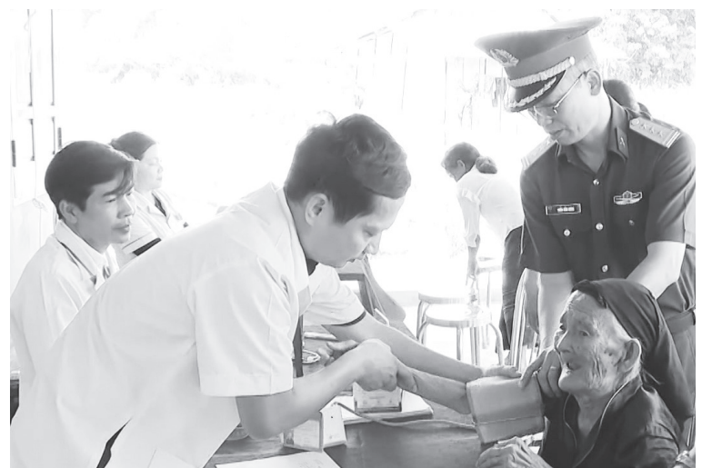
Người dân xã Kim Ngân được khám sàng lọc sức khỏe miễn phí

Qua điều tra xã hội học cho thấy, mức độ hài lòng của người dân đối với sự phục vụ của cơ quan hành chính nhà nước tại các xã, phường, đặc khu trên địa bàn tỉnh tương đối cao, với mức trung bình 86,13%, có 7/78 xã, phường đạt trên 90%.