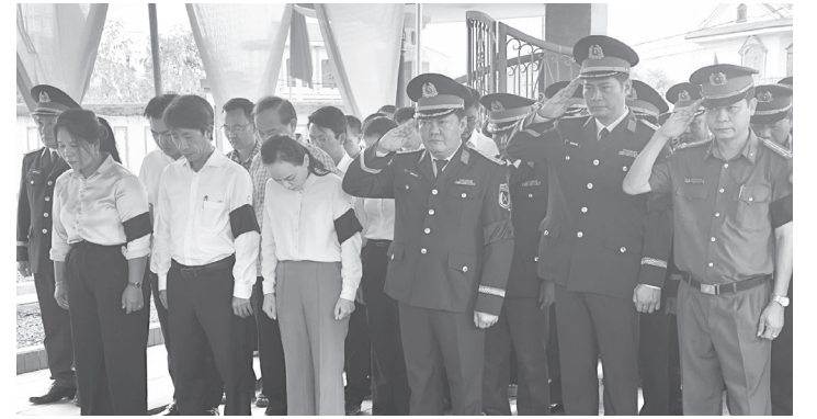
Lễ truy điệu hài cốt các liệt sĩ diễn ra trong không khí trang nghiêm, xúc động

Ngày 1/7/2026, tại Nghĩa trang liệt sĩ Lộc Ninh, Đảng bộ, chính quyền và Nhân dân phường Đồng Thuận đã tổ chức trang trọng lễ truy điệu và an táng 4 hài cốt liệt sĩ được tìm thấy tại các xã: Dân Hóa, Thượng Trạch. Tham dự buổi lễ có đại diện lãnh đạo Bộ Chỉ huy Quân sự tỉnh, Sở Nội vụ, Ban Chỉ huy Phòng thủ khu vực 2-Quảng Ninh; đại diện lãnh đạo phường Đồng Thuận, các xã: Dân Hóa, Thượng Trạch cùng đông đảo cán bộ, chiến sĩ lực lượng vũ trang và Nhân dân trên địa bàn.