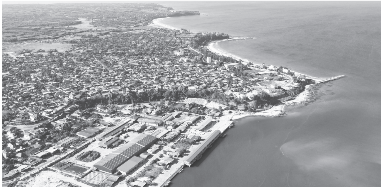
Biển Cửa Tùng sở hữu những giá trị riêng biệt về thiên nhiên, lịch sử

Thực hiện định hướng phát triển kinh tế biển bền vững, tỉnh Quảng Trị đang tập trung phát triển đồng bộ ngành du lịch và dịch vụ biển theo hướng chuyên nghiệp và chất lượng cao. Từng bước kết nối các không gian du lịch ven biển, hình thành cụm liên kết các trung tâm du lịch biển, đảo có thương hiệu từ Đá Nhảy, Nhật Lệ, Hải Ninh đến Cửa Tùng, Cửa Việt và Cồn Cỏ. Không chỉ khai thác hiệu quả tiềm năng, lợi thế biển, đây còn là giải pháp quan trọng để tạo cực tăng trưởng mới, nâng tầm thương hiệu du lịch địa phương.