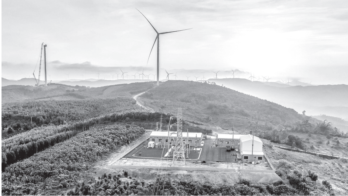
Dự án Điện gió Hải An hướng tới sản xuất nguồn năng lượng xanh, bền vững

Thứ ba, vai trò "người đi sau" trong chuyển đổi số và tăng trưởng xanh cũng góp phần giúp Quảng Trị không bị vướng bận bởi các công nghệ cũ. Tinh thần hoàn toàn có thể "đi tắt đón đầu" bằng việc xây dựng một hệ sinh thái logistics