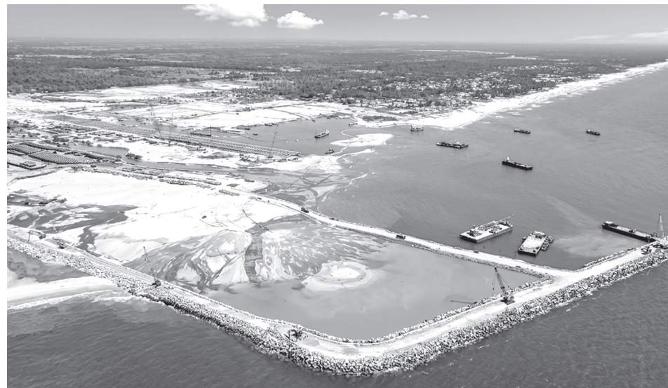
Cảng biển nước sâu Mỹ Thủy định hướng trở thành đầu mối logistics quốc tế của tỉnh và khu vực

Bên cạnh lợi thế về vị trí địa chiến lược quan trọng, hội tụ nhiều tiềm năng, lợi thế khác biệt, trong thu hút đầu tư, Quảng Trị luôn đặt doanh nghiệp ở vị trí trung tâm, coi sự thành công của nhà đầu tư là thành công của tỉnh. Với quyết tâm chính trị cao nhất, Quảng Trị đang đẩy mạnh cải cách hành chính, siết chặt kỷ cương, cắt giảm tối đa các thủ tục phiền hà để kiến tạo môi trường đầu tư thông thoáng, minh bạch, an toàn và tạo niềm tin dài hạn.