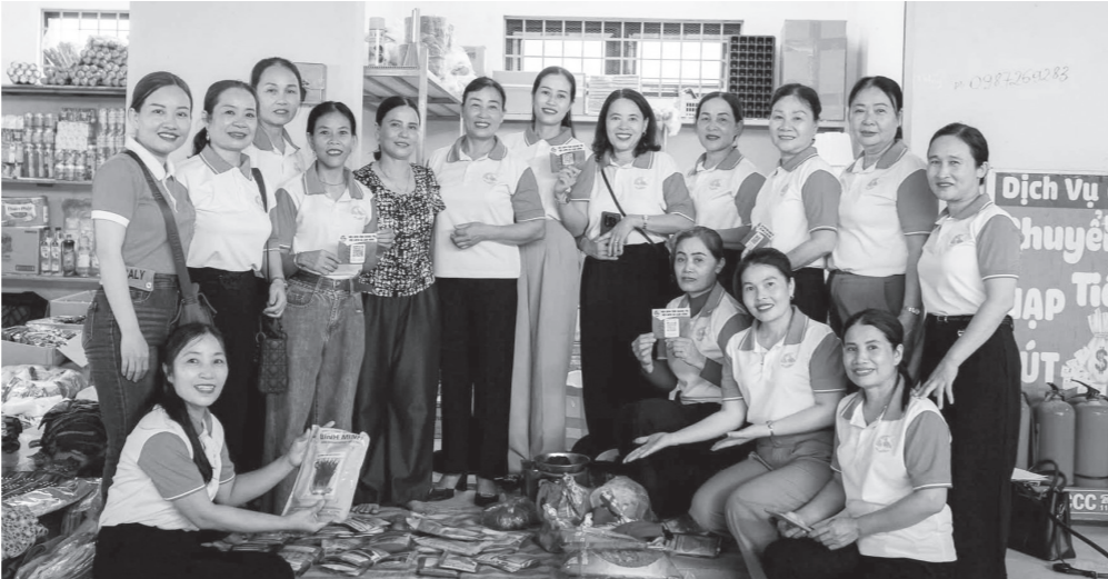
Các mô hình “chợ số” được triển khai hiệu quả trong toàn tỉnh

Sở KHCN cũng vừa có thông báo đề nghị các số, ban, ngành, UBND các xã, phường, đặc khu, các tổ chức chính trị, tổ chức chính trị-xã hội, các viện, trường, doanh nghiệp xây dựng và gửi đề xuất đặt hàng nhiệm vụ/cụm nhiệm vụ/chuỗi nhiệm vụ KHCN và ĐMST năm 2026. Mới đây, đoàn công tác của Sở KHCN phối hợp với Ban Văn hóa-Xã hội, HĐND tỉnh tổ chức khảo sát thực tế tại một số doanh nghiệp trên địa bàn nhằm phục vụ xây dựng chính sách hỗ trợ phát triển KHCN, ĐMST và CDS