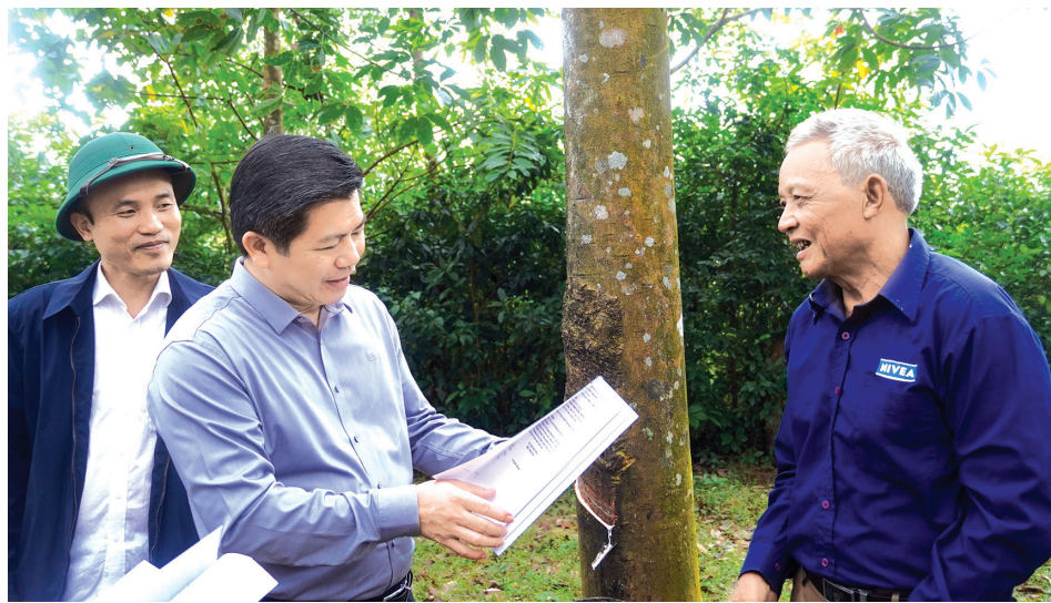
Đồng chí Trần Vũ Khiêm, Phó Bí thư Thường trực Tỉnh ủy, Trưởng đoàn đại biểu Quốc hội tỉnh trò chuyện với bà con xã Hướng Hiệp

Sau một năm vận hành mô hình chính quyền địa phương 2 cấp, tỉnh Quảng Trị đã từng bước ổn định tổ chức, phát huy hiệu năng, hiệu lực, hiệu quả của bộ máy mới. Từ thực tiễn triển khai, Ban Thường vụ Tỉnh ủy đã đúc rút nhiều kinh nghiệm bước đầu, đồng thời đề xuất những giải pháp nhằm tiếp tục hoàn thiện mô hình tổ chức và phương thức hoạt động của hệ thống chính trị. Phóng viên (P.V) Báo và phát thanh, truyền hình Quảng Trị đã có cuộc trao đổi với đồng chí Trần Vũ Khiêm, Phó Bí thư Thường trực Tỉnh ủy, Trưởng đoàn đại biểu Quốc hội tỉnh về những nội dung này.