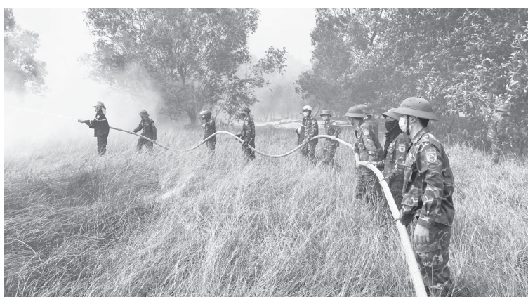
Các lực lượng chức năng khẩn trương khống chế đám cháy xảy ra tại xã Nam Cửa Việt

Ghi nhận tại xã Ninh Châu, đám cháy ngày 19/6 dù đã được