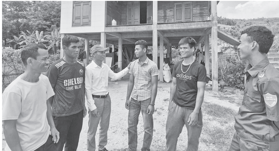
Các thành viên Ban điều hành mô hình “An ninh trật tự, an toàn giao thông” thôn Khe Luồi tuyên truyền, vận động thanh niên tránh xa các tệ nạn xã hội

Thôn Khe Luồi, xã Hướng Hiệp là địa bàn miền núi với hơn 90% dân số là đồng bào dân tộc thiểu số (DTTS). Từ năm 2015 đến nay, nhờ triển khai hiệu quả mô hình “An ninh trật tự, an toàn giao thông” (ANTT, ATGT), tình hình an ninh chính trị và trật tự an toàn xã hội tại địa phương luôn được giữ vững, trở thành điểm sáng trong phong trào “Toàn dân bảo vệ an ninh Tổ quốc” ở vùng đồng bào DTTS.