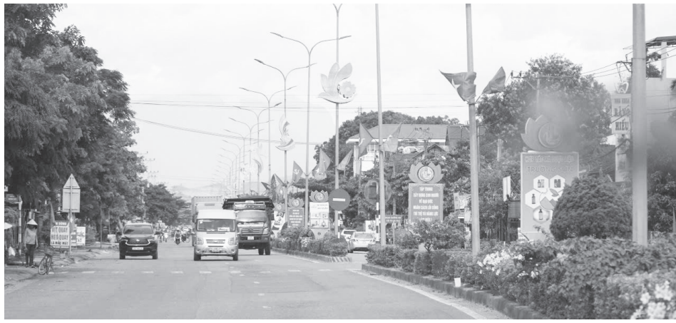
Diện mạo mới của xã Cam Lộ

Là một trong hai địa phương được tỉnh lựa chọn thí điểm thực hiện mô hình xã nông thôn mới (NTM) hiện đại giai đoạn 2026-2030, xã Cam Lộ đã chủ động triển khai giải pháp, tranh thủ các nguồn lực nhằm phát huy tối đa tiềm năng, thế mạnh của địa phương, nâng cao hơn nữa đời sống vật chất, tinh thần và môi trường sống của người dân.