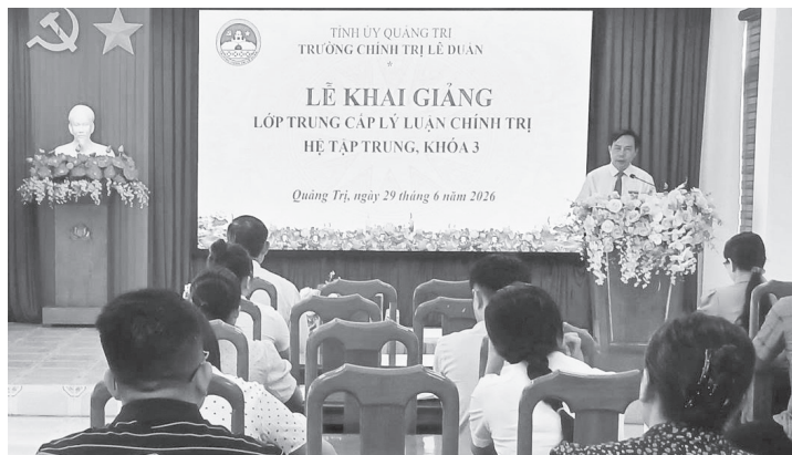
Quang cảnh buổi lễ khai giảng