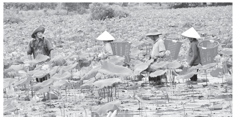
Nhiều mô hình kinh tế mang lại hiệu quả kinh tế cao và giải quyết việc làm cho lao động địa phương