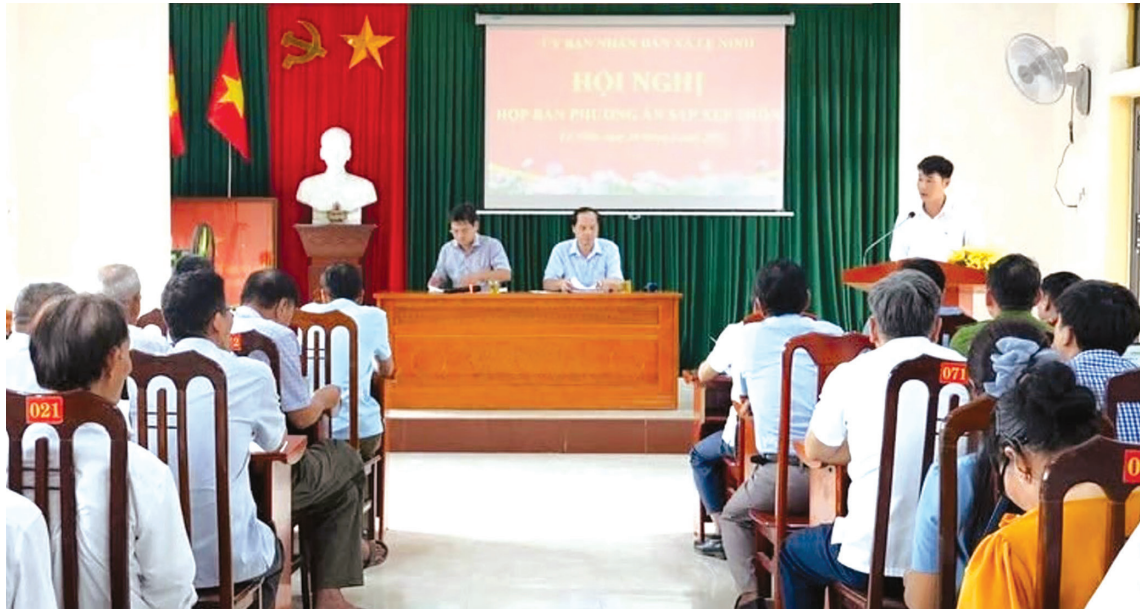
Công tác tiếp dân, đối thoại với Nhân dân được xã Lê Ninh thực hiện thường xuyên, đúng quy định

Công tác tiếp công dân, giải quyết đơn thư khiếu nại, tố cáo, kiến nghị, phản ánh của Nhân dân được thực hiện nghiêm túc, đúng quy định. Việc tiếp dân, đối thoại trực tiếp với Nhân dân được duy trì nền nếp, qua đó kịp thời nắm bắt tâm tư, nguyện vọng và giải quyết các vấn đề phát sinh ngay từ cơ sở. Trong 6 tháng đầu năm 2026, đồng chí Bí thư Đảng ủy đã thực hiện 11 phiên tiếp công dân định kỳ; tiếp nhận và chỉ đạo giải quyết kịp thời 6 kiến nghị, phản ánh của Nhân dân, góp phần giữ vững ổn định chính trị, trật tự an toàn xã hội trên địa bàn.