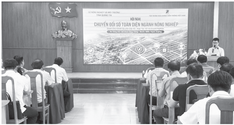
Quang cảnh buổi hội nghị