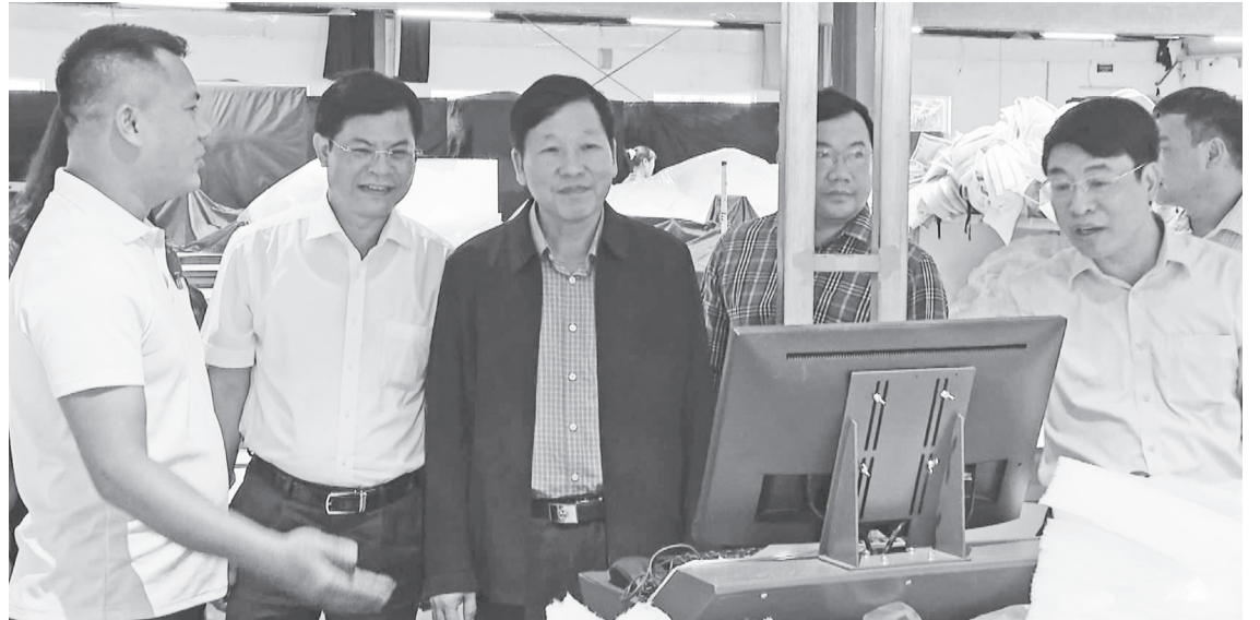
Thường trực Đảng ủy xã Quảng Trạch kiểm tra tình hình sản xuất, kinh doanh của một doanh nghiệp trên địa bàn

Để bảo đảm thực hiện thắng lợi các nhiệm vụ chính trị được giao, Đảng ủy, Ban Thường vụ Đảng ủy và các cấp ủy trực thuộc của Đảng bộ xã Quảng Trạch đã tập trung lãnh đạo, chỉ đạo triển khai toàn diện các nhiệm vụ, giải pháp, nhờ đó trong 6 tháng đầu năm 2026 đạt được nhiều kết quả quan trọng.