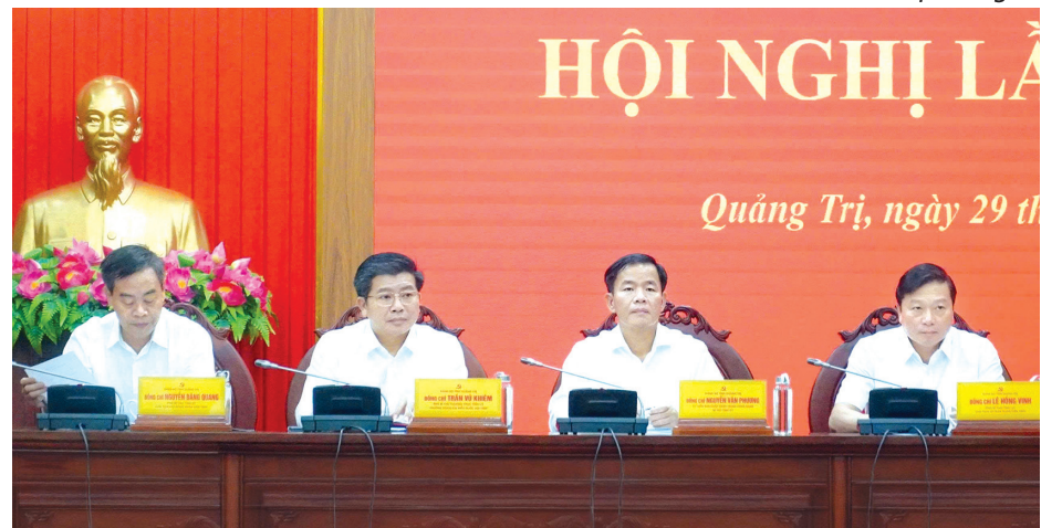
Các đồng chí Thường trực Tỉnh ủy chủ trì và điều hành hội nghị