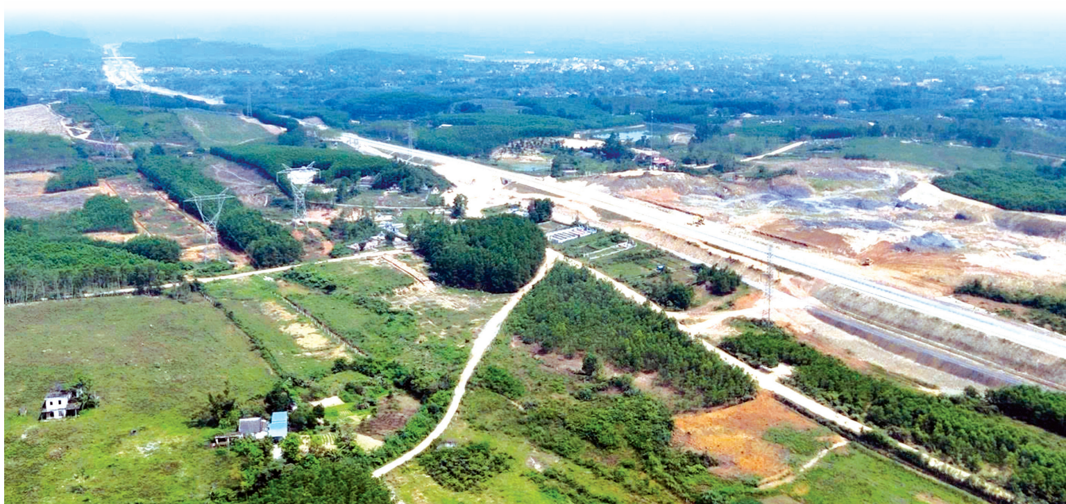
Các ý kiến, kiến nghị của người dân liên quan đến đất đai được Đảng ủy xã Lê Ninh tiếp nhận và chỉ đạo giải quyết kịp thời

hiện đúng chức trách, nhiệm vụ. Sau khi được giải thích, ông Lộc đồng thuận với kết quả xác minh, tự nguyện không nhận khoản hỗ trợ 200.000 đồng do thông tin cư trú chưa phù hợp, đồng thời chủ động liên hệ Công an xã để điều chỉnh thông tin cư trú về đúng địa bàn sinh sống nhằm bảo đảm quyền lợi lâu dài.