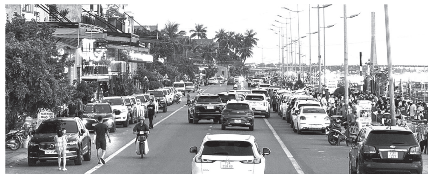
Công an phường Đồng Hới sẽ tăng cường lực lượng xử lý các trường hợp vi phạm về trật tự đô thị, trật tự an toàn giao thông trên địa bàn

Qua đó góp phần bảo đảm giao thông thông suốt, xây dựng môi trường du lịch văn minh, an toàn, tạo ấn tượng tốt đẹp đối với người dân và du khách khi đến với Đồng Hới.