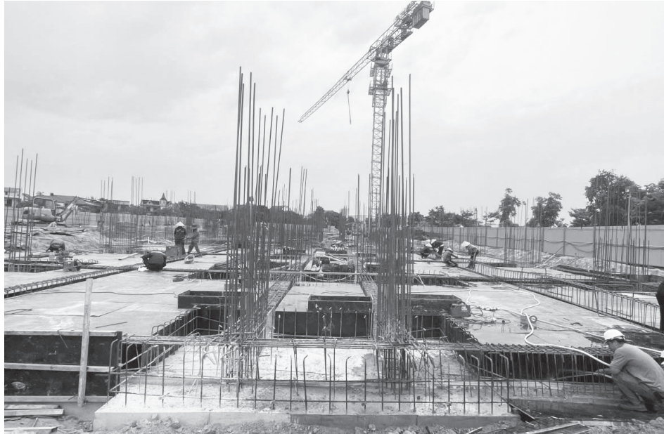
Đơn vị thi công đang tích cực đẩy nhanh tiến độ dự án Khu nhà ở xã hội trung tâm TP. Đông Hới-Tây Bắc đường Lê Lợi