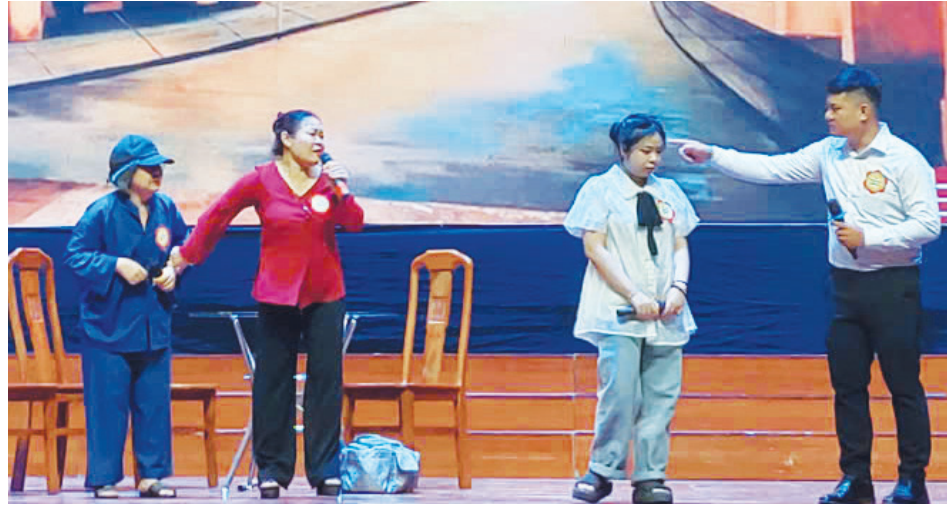
Hội thi Câu lạc bộ Gia đình hạnh phúc năm 2024 với sự tham gia của nhiều câu lạc bộ trên địa bàn tỉnh

Gia đình là tế bào của xã hội. Nhưng trong một xã hội đang chuyển động từng ngày, để giữ gìn những giá trị yêu thương, trách nhiệm và sự gắn kết trong mỗi mái ấm chưa bao giờ là điều dễ dàng. Suốt 25 năm qua, công tác gia đình ở Quảng Trị đã từng bước đi vào đời sống, góp phần nâng cao nhận thức của cộng đồng, giảm thiểu bạo lực gia đình và vun đắp những mái ấm no ấm, tiến bộ, hạnh phúc.