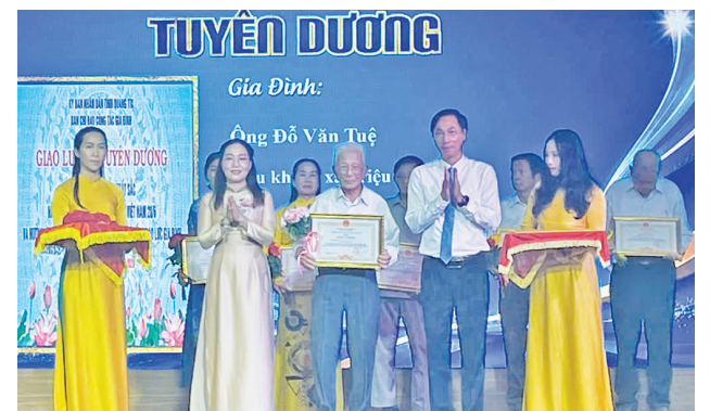
73 gia đình tiêu biểu đã được khen thưởng tại chương trình

Địp này, UBND tỉnh đã khen thưởng 73 gia đình tiêu biểu trên toàn tỉnh vì những đóng góp tích cực trong xây dựng đời sống văn hóa và phòng, chống bạo lực gia đình. Thông qua chương trình, các cấp, các ngành