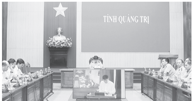
Quang cảnh hội nghị tại điểm cầu tỉnh Quảng Trị

Ngày 26/6/2026, tại thủ đô Hà Nội, Thanh tra Chính phủ tổ chức hội nghị trực tuyến toàn quốc với điểm cầu của các bộ, ngành, địa phương về quán triệt, phổ biến, hướng dẫn các nội dung trọng tâm, cốt lõi, những vấn đề mới trong Nghị định số 164/2026/NĐ-CP của Chính phủ trong kiểm soát tài sản, thu nhập của người có chức vụ, quyền hạn trong cơ quan, tổ chức.