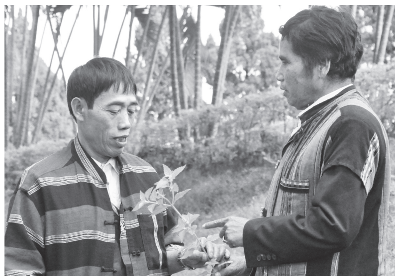
Các thầy thuốc vùng cao chia sẻ với nhau những bài thuốc hay, cây thuốc quý

Không để bài thuốc quý ở vùng cao thất truyền cùng sự ra đi của các lương y, thời gian qua, cán bộ, hội viên Hội Đông Y tỉnh đã vào cuộc, góp sức thay đổi những quan niệm lạc hậu. Nhờ sự nỗ lực ấy, ngày có càng nhiều thầy thuốc vùng cao đã bước chân vào hội, sẽ chia những bài thuốc hay, cây thuốc quý để cứu người.