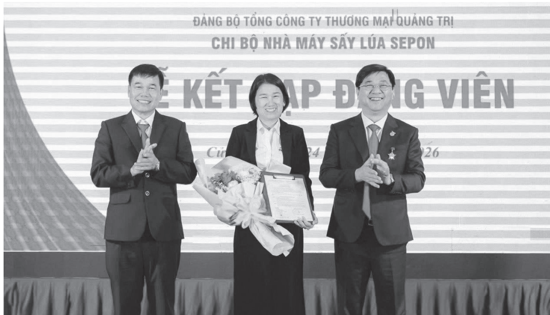
Công đoàn cơ sở Công ty Cổ phần Tổng Công ty Thương mại Quảng Trị giới thiệu nhiều quần chúng ưu tú cho Đảng xem xét, kết nạp

Thời gian qua, tổ chức Công đoàn ở các doanh nghiệp, nhà máy... đã làm tốt vai trò hạt nhân, vừa bồi đắp niềm tin, vừa khơi dậy khát vọng cống hiến, giúp người lao động (NLĐ) phấn đấu đứng dưới cờ Đảng.