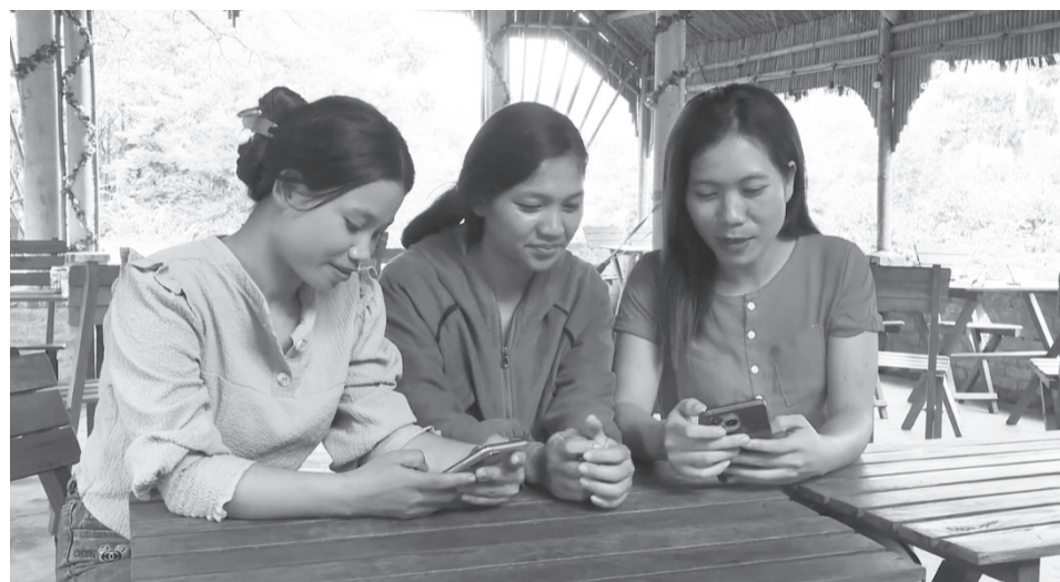
Phụ nữ vùng cao hướng dẫn nhau chuyển đổi số