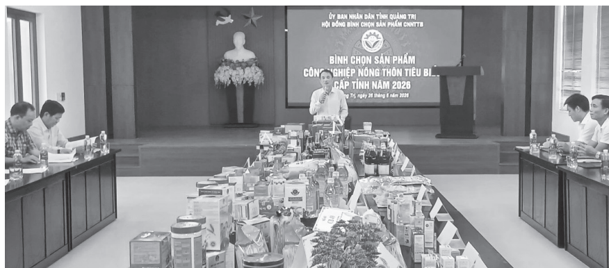
Quang cảnh buổi bình chọn

Ngày 26/6/2026, Sở Công thương-cơ quan thường trực Hội đồng bình chọn sản phẩm công nghiệp nông thôn tiêu biểu (CNNTTB) cấp tỉnh năm 2026 tổ chức bình chọn các sản phẩm CNNTTB cấp tỉnh năm 2026.