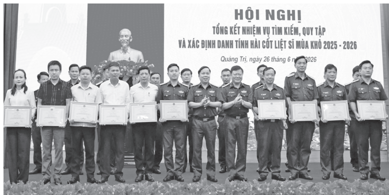
Trao bằng khen của Chủ tịch UBND tỉnh cho các cá nhân có thành tích xuất sắc trong thực hiện nhiệm vụ tìm kiếm, quy tập và xác định danh tính hài cốt liệt sĩ mùa khô 2025-2026