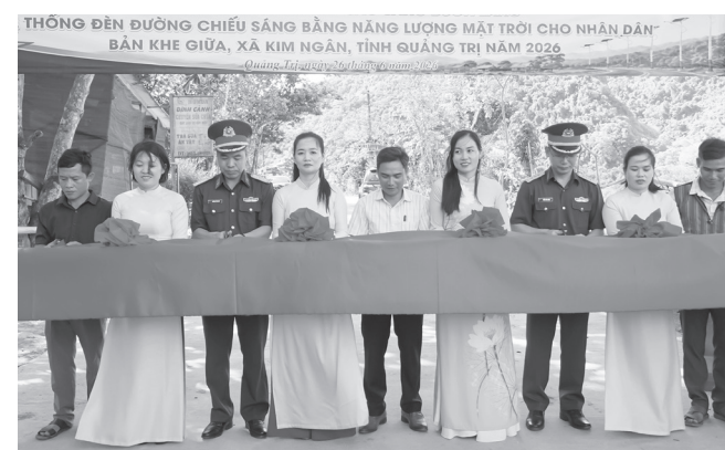
Các đại biểu cắt băng bàn giao công trình "Sao sáng buôn làng" tại bản Khe Giữa