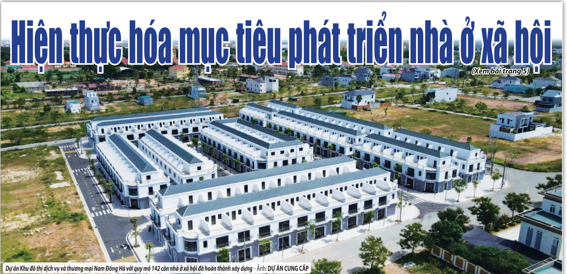
Dự án Khu đô thị dịch vụ và thương mại Nam Đông Hà với quy mô 142 căn nhà ở xã hội đã hoàn thành xây dựng