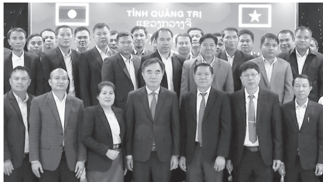
Đoàn đại biểu 2 tỉnh Quảng Trị-Khăm Muôn chụp ảnh lưu niệm tại hội nghị