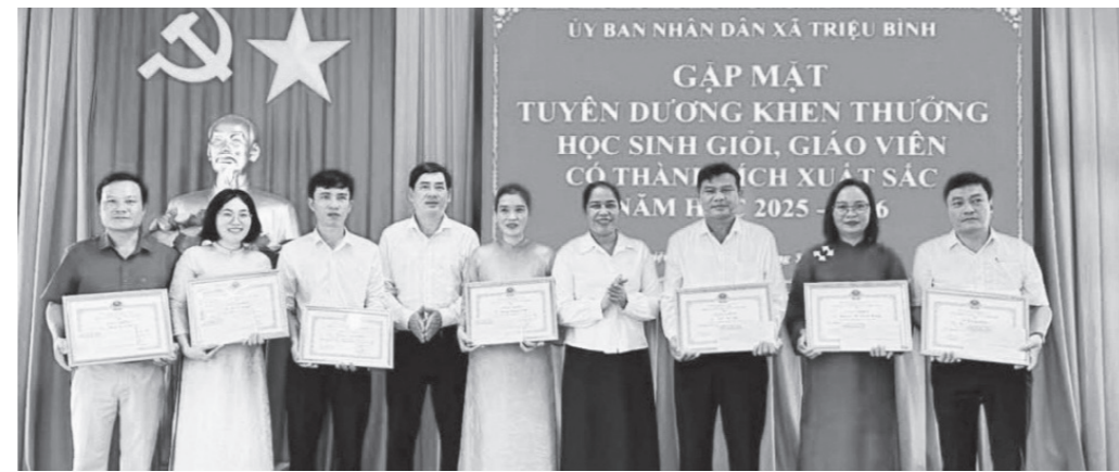
Xã Triệu Bình trao thưởng cho giáo viên có thành tích xuất sắc trong công tác

Hiện, Hội Khuyến học phường Đồng Sơn có 48 chi hội với 8.802 hội viên. Thời gian qua, phong trào KH, KT, xây dựng XHHT trên địa bàn phường Đồng Sơn có nhiều chuyển biến tích cực. Công tác huy động quỹ khuyến học đạt hơn 560 triệu đồng và đã trao 3.968 suất quà, học bổng động viên các em học sinh, giáo viên đạt thành tích cao trong học tập, giảng dạy. Bên cạnh đó, phong trào thi đua xây dựng mô hình học tập diễn ra sôi nổi, đạt kết quả cao.