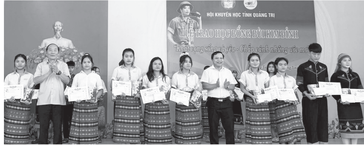
Hội Khuyến học tỉnh cùng các cấp hội cơ sở đã trao hàng nghìn suất học bổng, khen thưởng, vinh danh cho học sinh - Ảnh: T.L

Thời gian qua, công tác khuyến học, khuyến tài (KH, KT), xây dựng xã hội học tập (XHHT) trên địa bàn tỉnh đã tạo ra sự chuyển biến tích cực trong chất lượng giáo dục, đào tạo và nguồn nhân lực, góp phần tạo niềm tin trong Nhân dân, giúp mọi người nâng cao ý thức học tập, học tập thường xuyên, học tập suốt đời. Đặc biệt, để tiếp tục phát huy kết quả đạt được, Hội Khuyến học tỉnh đã nhân rộng những cách làm hay, hiệu quả nhằm hướng đến xây dựng một XHHT vững mạnh theo hướng nâng cao.