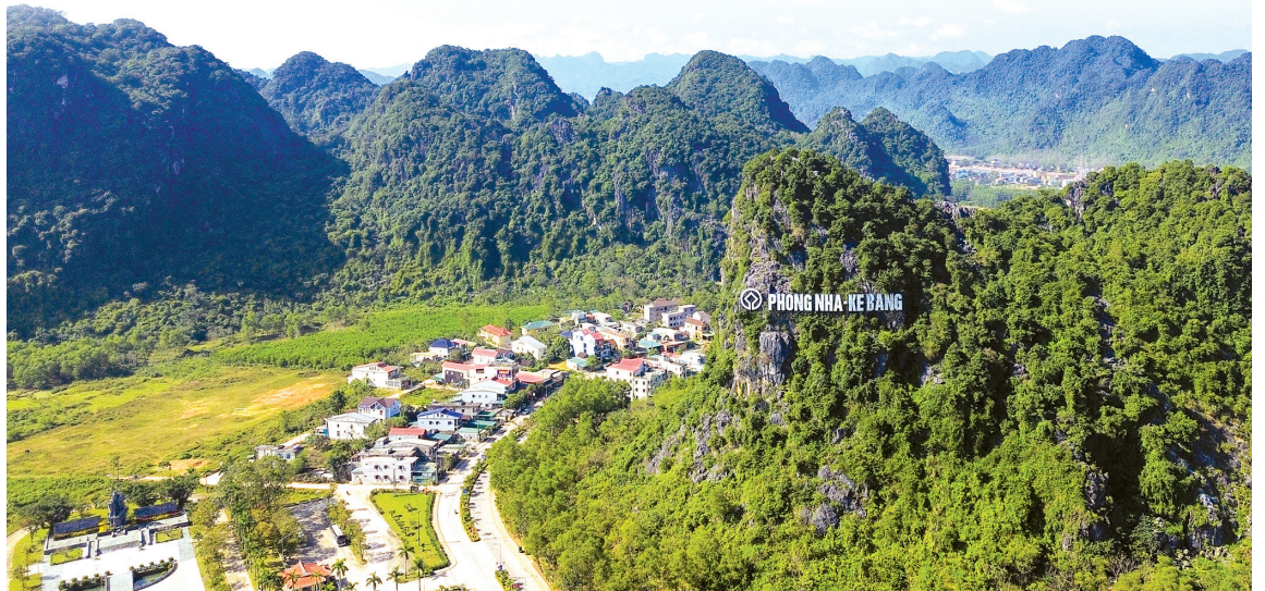
Di sản thiên nhiên thế giới Vườn Quốc gia Phong Nha-Kẻ Bàng

Ngoài ra, VQG Phong Nha-Kẻ Bàng sẽ trở thành khu vực quan trọng cho nghiên cứu liên ngành về địa chất, địa mạo karst, sinh học, khí hậu và văn hóa bản địa; cung cấp dữ liệu khoa học phục vụ dự báo biến đổi khí hậu, bảo tồn loài nguy cấp và quản lý tài nguyên; tạo điều kiện tổ chức các chương trình giáo dục môi trường, nâng cao nhận thức cộng đồng về bảo tồn và phát triển bền vững. Đồng thời, mở rộng cơ hội hợp tác với các Khu DTSQTG, VQG, tổ chức bảo tồn khác trong mạng lưới Chương trình Sinh quyển và Con người (MAB); trao đổi kinh nghiệm quản lý, bảo tồn, giám sát môi trường và phát triển du lịch bền vững; thu hút các chương trình nghiên cứu, đào tạo và đầu tư quốc tế.