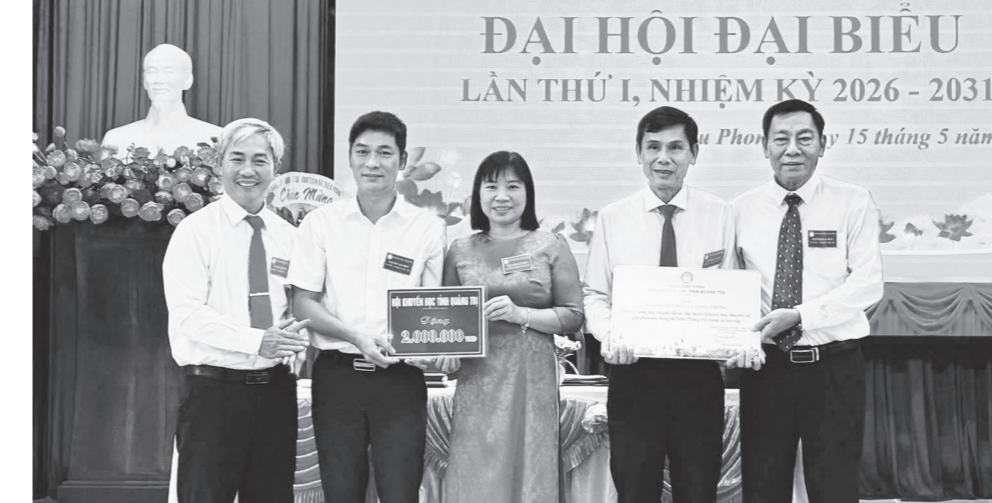
Đại diện lãnh đạo Hội Khuyến học tỉnh tặng quà Đại hội đại biểu Hội Khuyến học xã Triệu Phong

Xác định việc kiện toàn tổ chức Hội Khuyến học cơ sở là nền tảng cốt lõi để thực hiện thành công Đề án "Xây dựng xã hội học tập", ngay sau Đại hội Hội Khuyến học tỉnh nhiệm kỳ 2025-2030, Ban Thường vụ Hội Khuyến học tỉnh đã tích cực lãnh đạo, chỉ đạo việc sắp xếp, kiện toàn các tổ chức hội, chi hội ở cơ sở. Đồng thời, tích cực chỉ đạo Hội Khuyến học các xã, phường tiến hành đại hội kiện toàn lần thứ I, nhiệm kỳ 2026-2031, bởi đây được xem là sự kiện có ý nghĩa đặc biệt đối với công tác khuyến học, khuyến tài (KH, KT) và xây dựng xã hội học tập (XHHT) tại các địa phương trong giai đoạn mới.