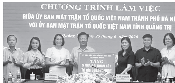
Ban Thường trực Ủy ban MTTQVN TP. Hà Nội đã hỗ trợ kinh phí xây dựng 5 nhà "Đại đoàn kết" cho tỉnh Quảng Trị

tổ chức, đội ngũ cán bộ, vận hành bộ máy theo mô hình mới. Công tác tuyên truyền, vận động Nhân dân cần tiếp tục được đổi mới mạnh mẽ với nhiều hình thức đa dạng, tạo sự đồng thuận xã hội và phát huy sức mạnh khối đại đoàn kết toàn dân tộc.