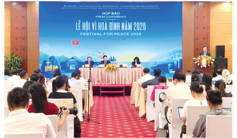
Quang cảnh buổi họp báo