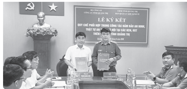
Lãnh đạo Công an tỉnh và Ban Quản lý Khu kinh tế tỉnh bàn giao biên bản ký kết