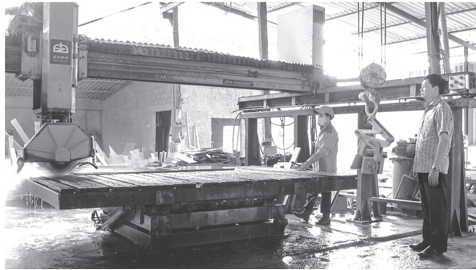
Sự lãnh đạo sát sao của Chi bộ Công ty TNHH MTV Nhất Long tạo động lực thúc đẩy sản xuất, kinh doanh phát triển bền vững

Bên cạnh nhiệm vụ kinh doanh, chi ủy phối hợp chặt chẽ với ban giám đốc triển khai đầy đủ, kịp thời các chế độ, chính