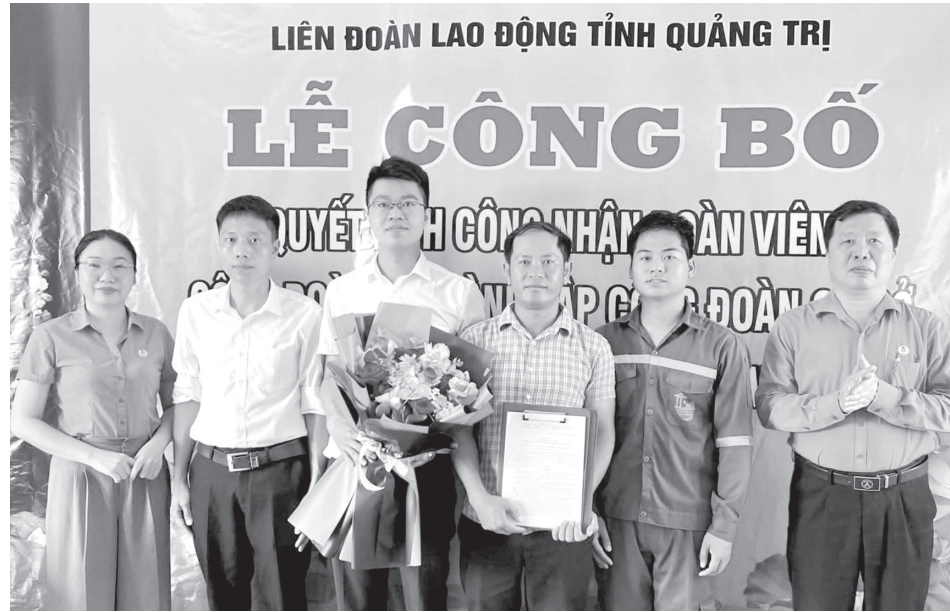
Lễ công bố quyết định thành lập Công đoàn cơ sở Công ty TNHH Đóng tàu Cửa Việt - Ảnh: H.T.H

kết nạp 1.767 ĐV. Một số địa phương làm tốt công tác này, như: CĐ phường Đông Hới thành lập mới 12 CĐCS, kết nạp 825 ĐV; CĐ phường Nam Đông Hà thành lập mới 6 CĐCS, kết nạp 111 ĐV... Cùng với công tác tuyên truyền, vận động, việc tổ chức ra mắt CĐCS được các đơn vị thực hiện chu đáo, trang trọng, tạo dấu ấn và khí thế ban đầu cho hoạt động CĐ, từng bước khẳng định vai trò đồng hành cùng DN, chăm lo, bảo vệ quyền lợi NLĐ ngay từ cơ sở.