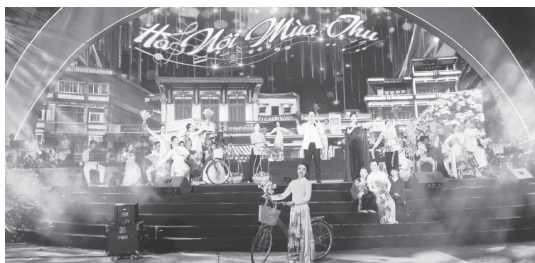
Chương trình có sự tham gia của nhiều ca sĩ, nghệ sĩ trẻ