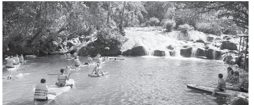
Du khách thỏa sức trải nghiệm, khám phá thiên nhiên tại Khu du lịch sinh thái Chà Cùng

Lợi thế địa hình đa dạng gắn liền với cảnh quan thiên nhiên hấp dẫn, suối Chà Cùng (xã Trường Sơn) đang trở thành điểm đến lý tưởng dành cho những du khách thích khám phá, trải nghiệm những điều mới lạ.