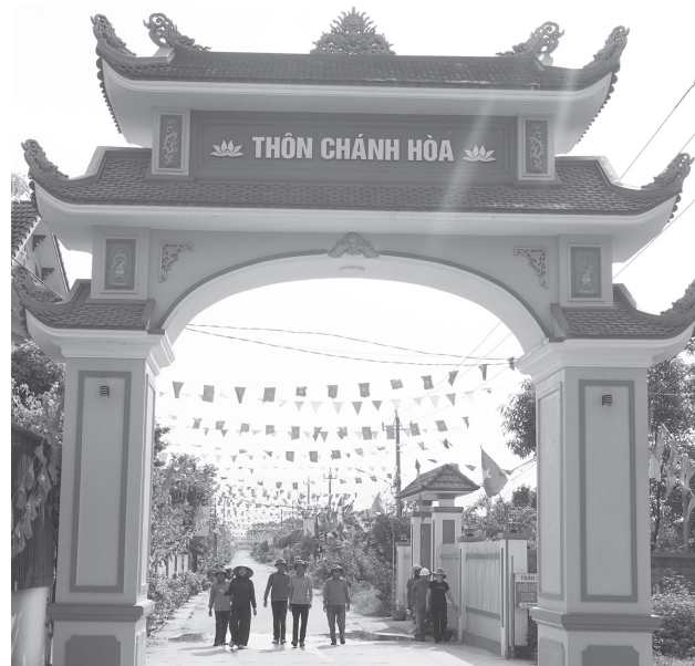
Không gian thôn mở rộng, tạo điều kiện thúc đẩy phát triển kinh tế-xã hội tại địa phương

Ông Giã Xuân Chiến, TDP Quyết Thắng, xã Nam Trạch bày tỏ: "Sắp xếp, tổ chức lại các thôn, TDP là chủ trương lớn của Đảng, Nhà nước. Theo phương án dự thảo của xã, TDP Quyết Thắng chúng tôi sáp nhập với cụm 2,3,4 thuộc TDP 3 và cụm 1,2,3,4,5 TDP Thắng Lợi với tên gọi thôn Việt Trung, tôi hoàn toàn nhất trí với phương án này. Tin tưởng rằng, với quy mô mới, bộ máy lãnh đạo mới, thôn sẽ ngày càng phát triển hơn".