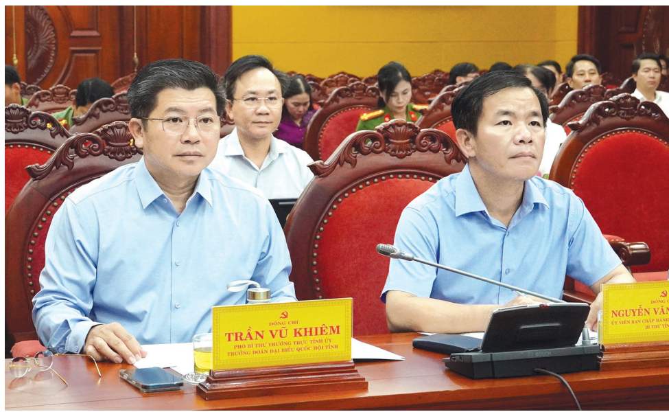
Các đồng chí lãnh đạo tỉnh tham dự phiên họp tại điểm cầu Quảng Trị