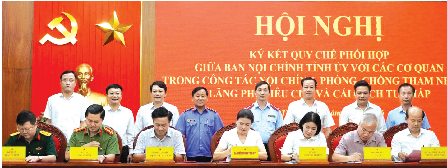
Ký kết quy chế phối hợp giữa Ban Nội chính Tỉnh ủy với các cơ quan, đơn vị về công tác nội chính, phòng, chống tham nhũng, lãng phí, tiêu cực và cải cách tư pháp - Ảnh: T.L