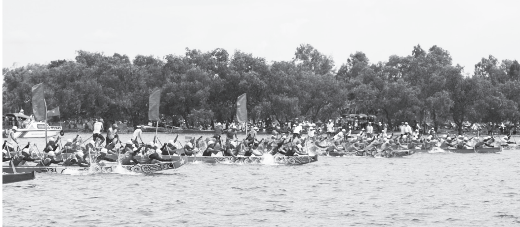
Lễ hội đua thuyền truyền thống hấp dẫn người dân và du khách

Thời gian qua, xã Ninh Châu đã làm tốt công tác bảo tồn, phát huy các giá trị bản sắc văn hóa gắn với phát triển du lịch, góp phần thúc đẩy phát triển kinh tế-xã hội của địa phương.