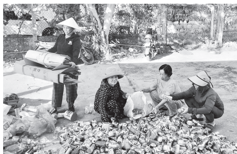
Hội viên Hội Phụ nữ phường Đông Sơn phân loại rác thải từ "Ngôi nhà xanh" để bán gây quỹ tình thương

Mô hình "Ngôi nhà xanh" được xem là điểm sáng trong phong trào bảo vệ môi trường tại phường Đông Sơn. Chủ tịch Hội