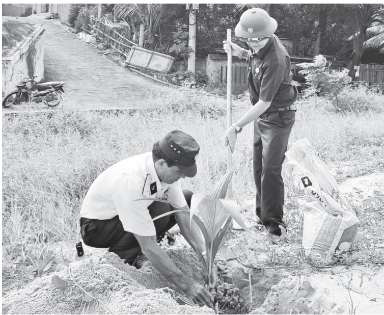
Cựu chiến binh xã Nam Trạch trồng dưa ven bờ biển Nhân Trạch