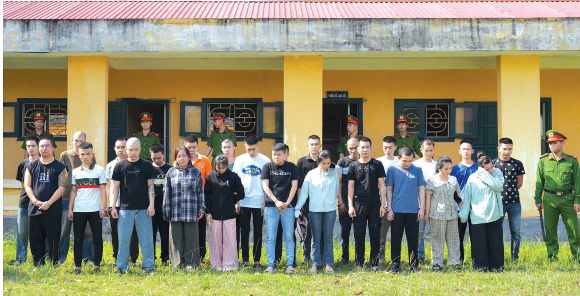
61 đối tượng trong đường dây lừa đảo chiếm đoạt tài sản trên không gian mạng vừa bị Cơ quan Cảnh sát điều tra, Công an tỉnh khởi tố, bắt tạm giam - Ảnh: N.Q.V

Kết quả điều tra cho thấy, đường dây này hoạt động có tổ chức, phân công nhiệm vụ chặt chẽ theo từng công đoạn. Mỗi đối tượng được giao danh sách số điện thoại, tài khoản mạng xã hội