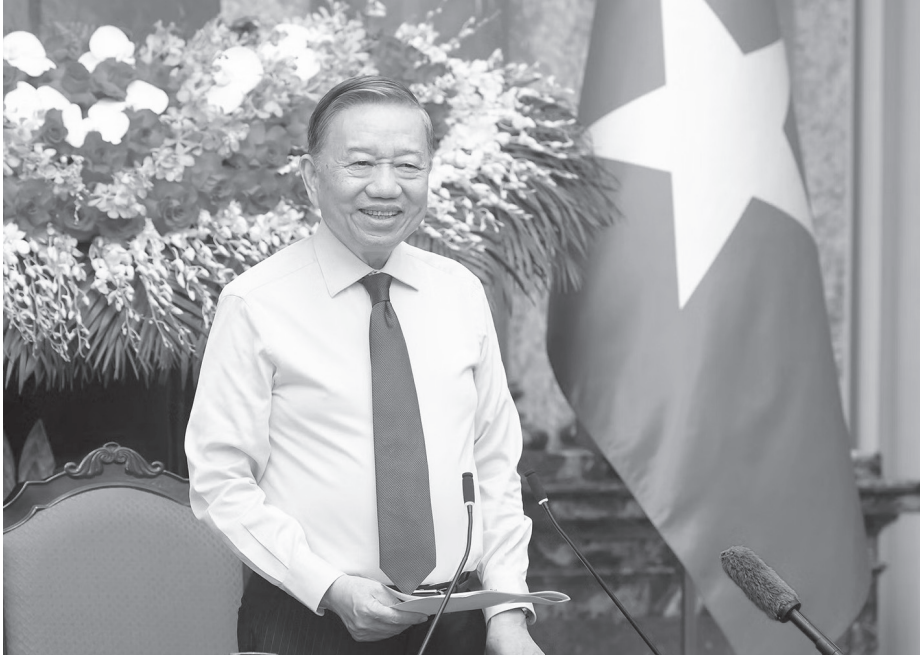
Tổng Bí thư, Chủ tịch nước Tô Lâm phát biểu tại cuộc gặp mặt 101 nhà báo tiêu biểu, đoạt Giải Báo chí Quốc gia qua các năm, nhân dịp Kỷ niệm 101 năm Ngày Báo chí cách mạng Việt Nam (21/6/1925-21/6/2026)

Tuy nhiên, môi trường mạng cũng khiến đời sống thông tin phức tạp hơn, dễ bị chi phối bởi cảm xúc nhất thời, tin sai lệch, thao túng thuật toán và những hoạt động tán phát thông tin có chủ đích. Tin giả, tin nửa đúng nửa sai, mập mờ, hình ảnh và âm thanh giả mạo, nội dung do trí tuệ nhân tạo tạo ra, xâm phạm bản quyền, tấn công mạng và đánh cắp dữ liệu diễn ra ngày càng tinh vi. Thông tin sai có thể lan xa trước khi sự thật kịp được kiểm chứng. Tình trạng phát ngôn bị cắt ghép có thể làm tổn hại uy tín cá nhân, tổ chức, thậm chí ảnh hưởng đến niềm tin của Nhân dân vào chính sách của Đảng và Nhà nước.