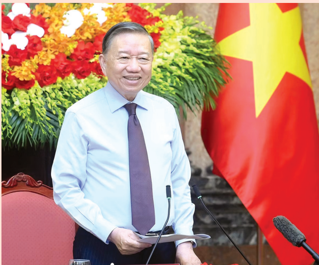
Tổng Bí thư, Chủ tịch nước Tô Lâm phát biểu tại cuộc gặp mặt 101 nhà báo tiêu biểu, đạt Giải Báo chí Quốc gia qua các năm, nhân dịp Kỷ niệm 101 năm Ngày Báo chí cách mạng Việt Nam (21/6/1925-21/6/2026)

● TÔ LÂM, Tổng Bí thư Ban Chấp hành Trung ương Đảng Cộng sản Việt Nam, Chủ tịch nước Cộng hòa XHCN Việt Nam