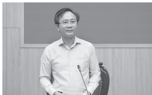
Đồng chí Hoàng Xuân Tân, Phó Chủ tịch UBND tỉnh phát biểu tại cuộc họp

Trong 6 tháng đầu năm 2026, công tác quản lý nhà nước về ATTP trên địa bàn tỉnh tiếp tục được tăng cường. Các sở, ngành, đơn vị, địa phương đã triển khai đồng bộ các giải pháp truyền thông, thanh tra, kiểm tra, hậu kiểm và giám sát chất lượng thực phẩm. Toàn tỉnh thành lập 190 đoàn kiểm tra liên ngành, tiến hành kiểm tra 3.167 lượt cơ sở sản xuất, kinh doanh thực phẩm; phát hiện 422 cơ sở vi phạm, xử phạt hành chính 56 cơ sở với tổng số tiền hơn 855 triệu đồng, đồng thời tiêu hủy hàng hóa vi phạm trị giá trên 629 triệu đồng.