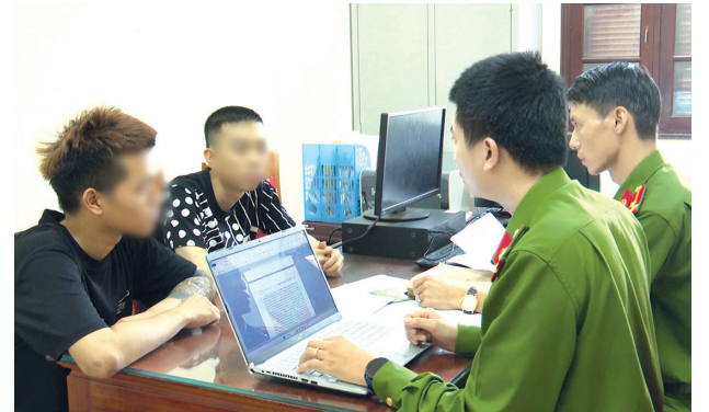
Lực lượng Công an tỉnh xử lý nhiều thanh thiếu niên vi phạm pháp luật trong thời gian qua