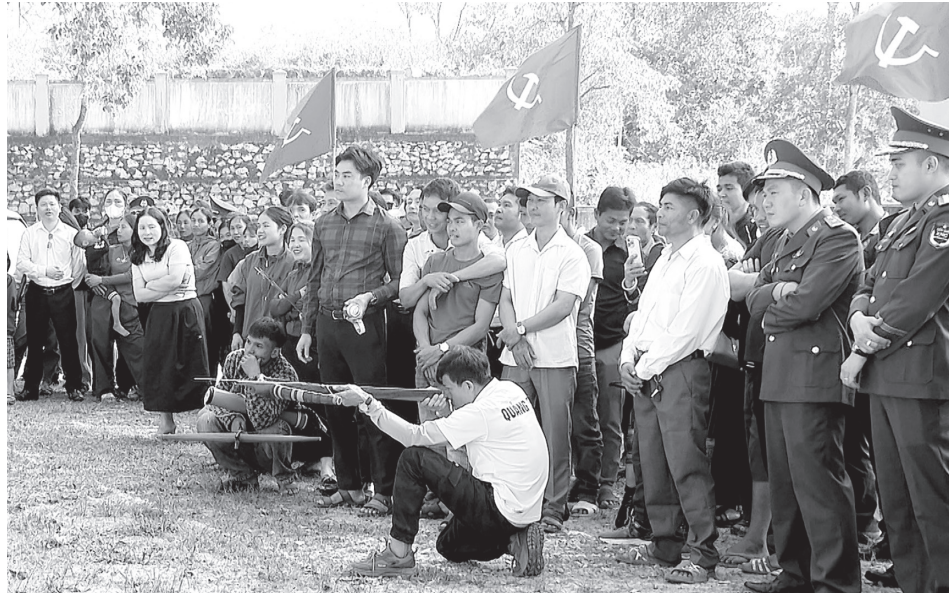
Môn bắn nỏ thu hút đông đảo người dân đến cổ vũ - Ảnh: Q.N

nổi, quyết liệt nhưng vẫn đậm tinh thần đoàn kết, giao lưu giữa các bản làng, đơn vị trên địa bàn. Là địa bàn sinh sống chủ yếu của người dân tộc thiểu số Bru-Vân Kiều và người Chứt ở 28 bản làng, xã Dân Hóa hiện vẫn duy trì nhiều môn thể thao truyền thống gắn bó với đời sống cộng đồng qua nhiều thế hệ.