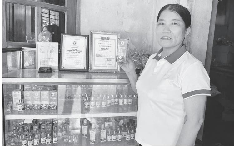
Phát triển sản phẩm OCOP là một trong những hướng đi giúp xã Tân Mỹ thúc đẩy kinh tế nông thôn, nâng cao thu nhập cho người dân - Ảnh: T.A

Bên cạnh những kết quả đạt được, Tân Mỹ hiện đối mặt với không ít khó khăn, thách thức trên lộ trình xây dựng NTM. Qua rà soát, xã hiện còn 29/47 chỉ tiêu chưa đạt, trong đó, nhiều chỉ tiêu thuộc nhóm hạ tầng kinh tế-xã hội, môi trường và phát triển kinh