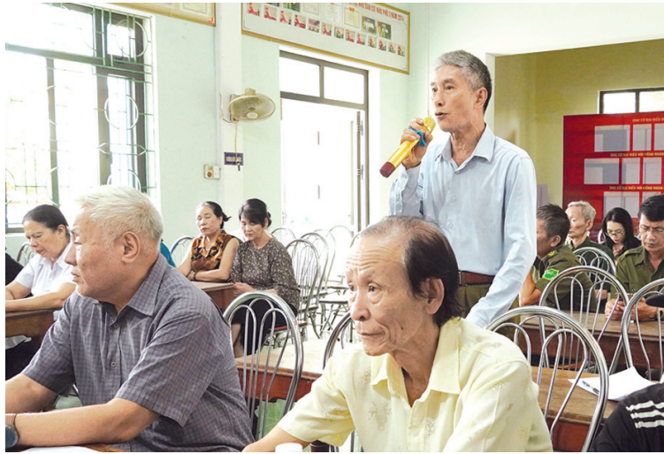
Người dân trực tiếp góp ý, bày tỏ những mong muốn của mình đối với tổ dân phố mới