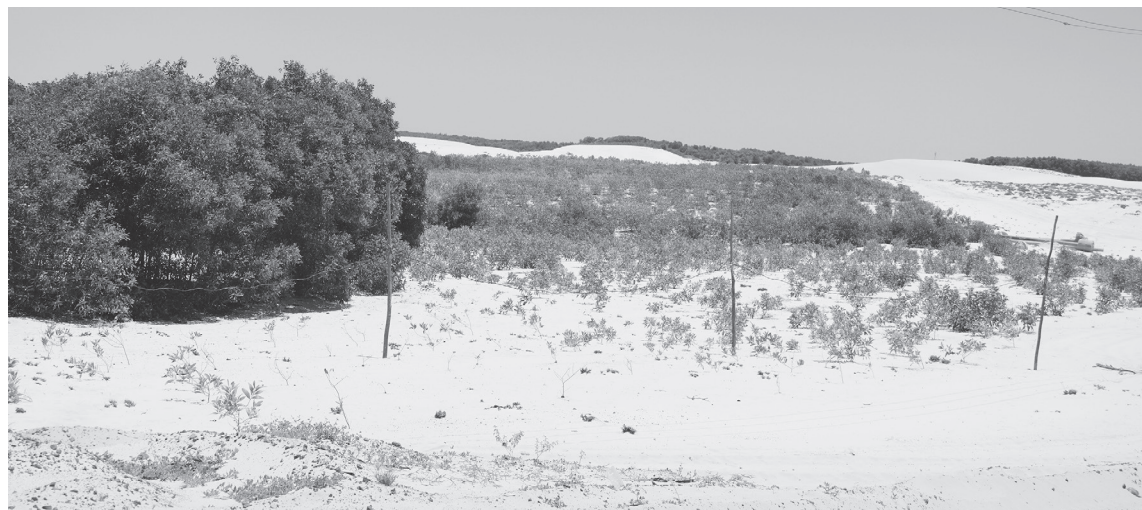
Công tác hoàn thổ, trồng rừng để cải thiện môi trường sau khai thác khoáng sản tại xã Vinh Hoàng