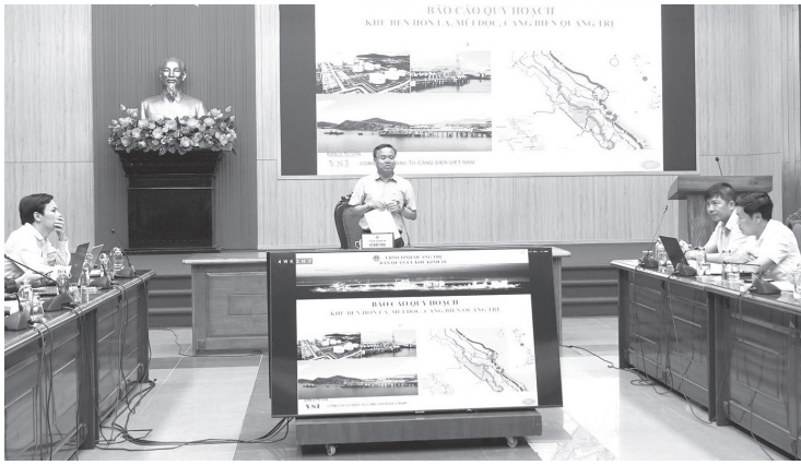
Quang cảnh buổi làm việc