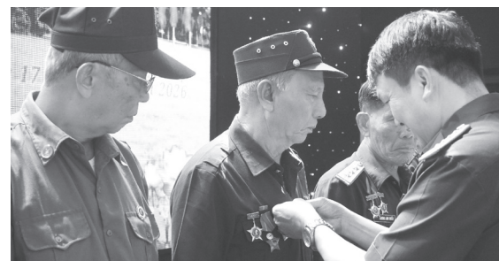
Đại diện Bộ Tư lệnh Pháo binh-Tên lửa trao tặng kỉ niệm chương Pháo binh cho 26 hội viên tiêu biểu

thiết thực như thăm hỏi, hỗ trợ hội viên có hoàn cảnh khó khăn, gia đình chính sách, thương binh, bệnh binh; phối hợp thực hiện công tác đền ơn đáp nghĩa, tri ân các anh hùng liệt sĩ và những người có công với cách mạng. Bên cạnh đó, BLL luôn chú trọng công tác giáo dục truyền thống cách mạng cho thế hệ trẻ thông qua các buổi gặp mặt, giao lưu, nói chuyện truyền thống, tham quan các địa chỉ đỏ và các hoạt động về nguồn. Các hội viên luôn gương mẫu đi đầu trong các phong trào thi đua yêu nước, tích cực tham gia xây dựng nông thôn mới, đô thị văn minh, bảo vệ an ninh trật tự ở cơ sở, các hoạt động nhân đạo, từ thiện và an sinh xã hội. Qua đó, tiếp tục khẳng định vai trò, uy tín và trách nhiệm của người CCB đối với cộng đồng, góp phần xây dựng quê hương ngày càng giàu đẹp, văn minh.