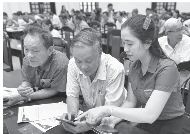
Tổ thanh niên số phường Nam Đông Hà hỗ trợ đảng viên cài đặt Sổ tay đảng viên điện tử

Nhằm lan tỏa hình ảnh tích cực của tổ chức Đoàn, nâng cao hiệu quả tuyên truyền, từng bước xây dựng mô hình đoàn cơ sở thích ứng với chuyển đổi số, Đoàn phường Nam Đông Hà đã triển khai các chiến dịch truyền thông trực tuyến "Sáng tạo cùng CapCut", các cuộc thi "Nam Đông Hà qua góc nhìn tuổi trẻ", hoạt động sáng tạo nội dung số trong đoàn viên, thanh thiếu nhi... Phong trào "Tuổi trẻ xung kích, đẩy mạnh chuyển đổi số và đổi mới sáng tạo" được triển khai đồng bộ, hiệu quả. Các tổ công nghệ số cộng đồng, đội hình "Bình dân học vụ số" được triển khai rộng khắp. Đoàn phường Nam Đông Hà đã thành lập 3 đội hình thanh niên tình nguyện hỗ trợ 2.000 lượt người dân trong 90 ngày cao điểm tại Trung tâm Phục vụ hành chính công phường, bộ phận 1 của Công an phường, qua đó, hướng dẫn người dân viết hơn 500 tờ khai, giúp tiết kiệm thời gian và chi phí cho người dân; hỗ trợ người cao tuổi cài đặt ứng dụng VNeID; đăng ký tài khoản sử dụng dịch vụ công trực tuyến, cài đặt các ứng dụng thanh toán điện tử và