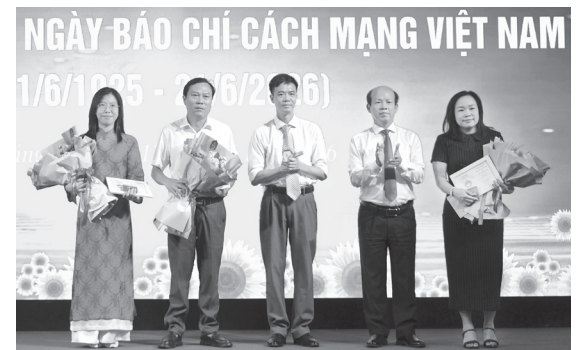
Lãnh đạo Hội Nhà báo Việt Nam tỉnh trao kỷ niệm chương "Vi sự nghiệp báo chí Việt Nam" cho các cá nhân

tác báo chí, truyền thông; giữ vững tôn chỉ, mục đích, bản lĩnh chính trị, đạo đức nghề nghiệp và trách nhiệm xã hội của người làm báo. Nâng cao hơn nữa chất lượng các tác phẩm báo chí; đẩy mạnh tuyên truyền những nhiệm vụ chính trị trọng tâm của tỉnh. Chủ động ứng dụng công nghệ số, đổi mới phương thức sản xuất và phân phối nội dung báo chí; phát triển các sản phẩm truyền thông đa nền tảng, đáp ứng nhu cầu tiếp nhận thông tin ngày càng cao của công chúng. Tăng cường đấu tranh phản bác các quan điểm sai trái, thông tin xấu độc; bảo vệ nền tảng tư tưởng của Đảng; góp phần giữ vững ổn định chính trị, trật tự an toàn xã hội trên địa bàn tỉnh. Xây dựng đội ngũ người làm báo tỉnh Quảng Trị có bản lĩnh chính trị vững vàng, trình độ chuyên môn cao, đạo đức nghề nghiệp trong sáng, thực sự là những chiến sĩ tiên phong trên mặt trận tư tưởng, văn hóa của Đảng.