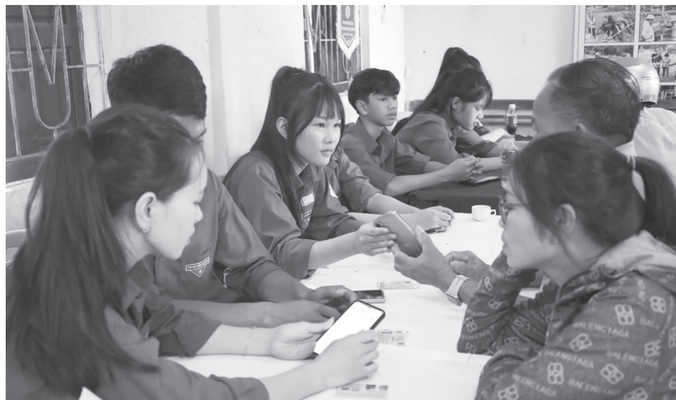
Đoàn viên thanh niên và thành viên tổ công nghệ số cộng đồng trực tiếp hướng dẫn tích hợp và sử dụng ứng dụng cho người dân

tác, giải đáp từng vướng mắc để quá trình tích hợp được thực hiện nhanh chóng, thuận lợi.