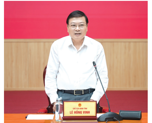
Đồng chí Lê Hồng Vinh, Phó Bí thư Tỉnh ủy, Chủ tịch UBND tỉnh phát biểu tại buổi làm việc