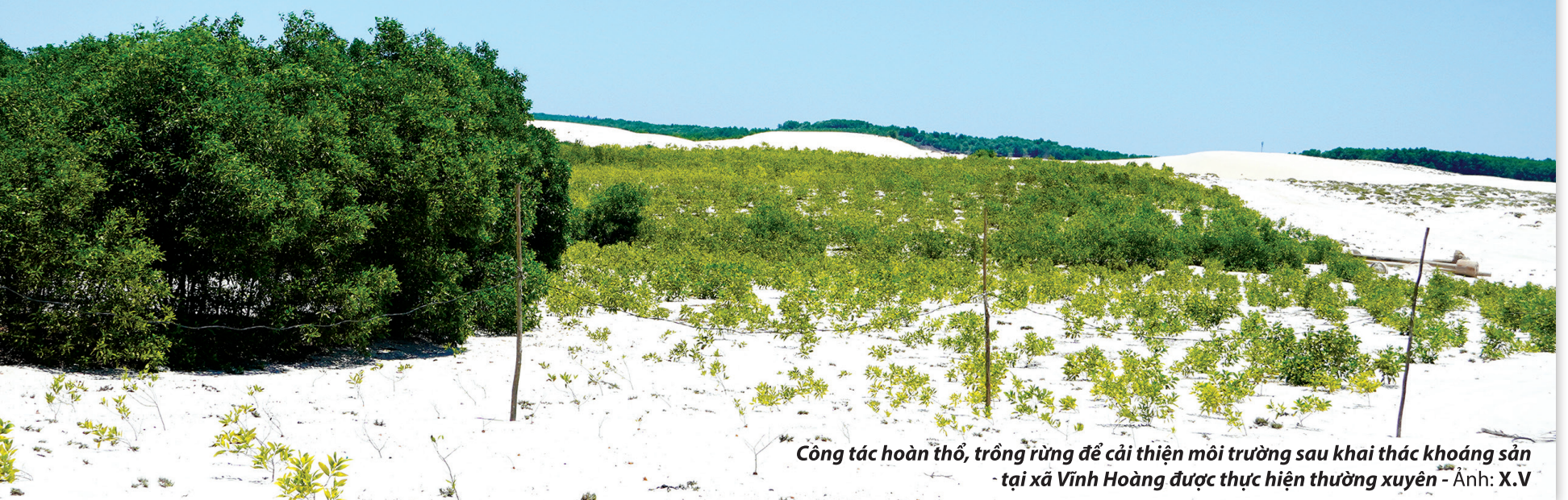
Công tác hoàn thổ, trồng rừng để cải thiện môi trường sau khai thác khoáng sản tại xã Vĩnh Hoàng được thực hiện thường xuyên