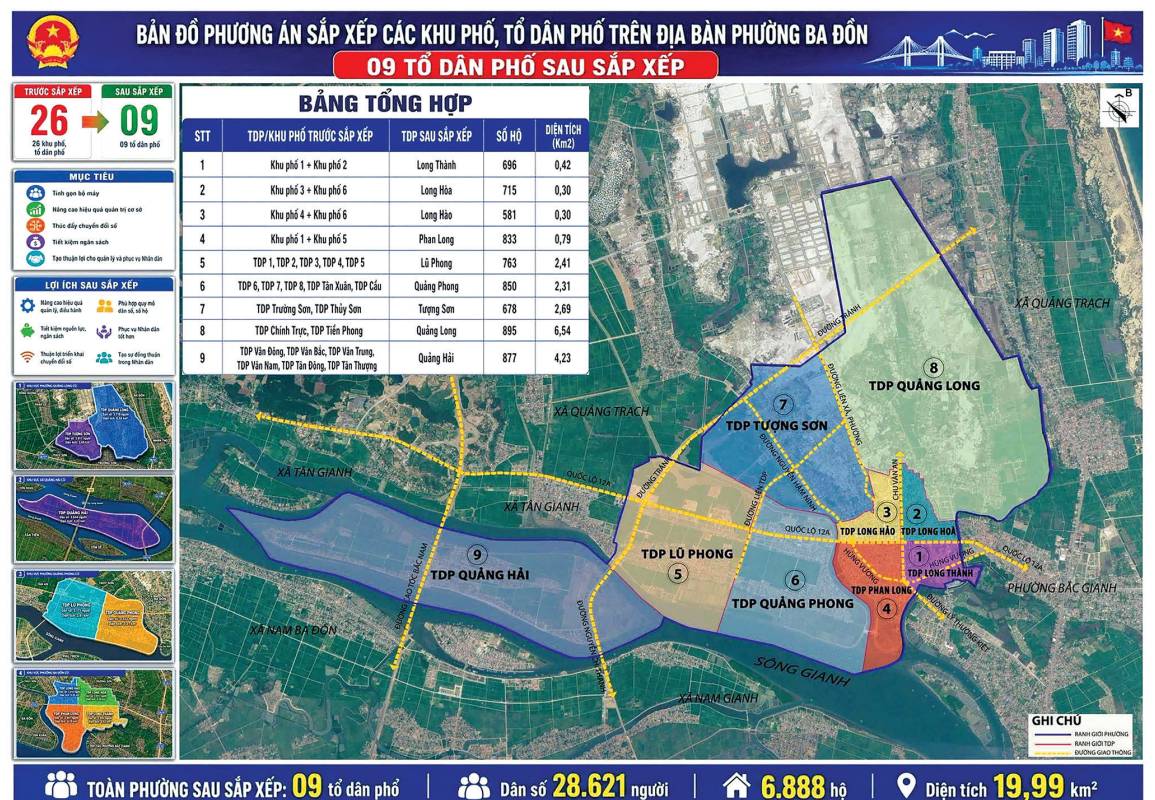
Theo phương án dự kiến, phường Ba Đồn sáp nhập 26 khu phố, tổ dân phố hiện có thành 9 tổ dân phố mới - Ảnh: H.L

Cùng chung suy nghĩ đó, ông Cao Minh Tá, Tổ trưởng TDP Vân Trung với hơn 25