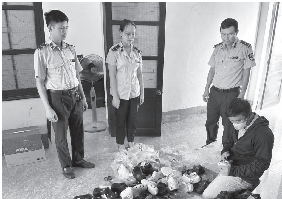
Tiêu hủy tang vật vi phạm quyền sở hữu trí tuệ dưới sự giám sát của lực lượng Quản lý thị trường

Đợt cao điểm kiểm tra, kiểm soát thị trường vừa qua đã ghi nhận những kết quả nổi bật trong việc xử lý các hành vi xâm phạm quyền sở hữu trí tuệ (SHTT) trên địa bàn tỉnh. Sự phối hợp chặt chẽ, hành động quyết liệt của lực lượng Quản lý thị trường (QLTT) và các ngành chức năng đã góp phần chấn chỉnh, từng bước siết chặt kỷ cương, lập lại trật tự thị trường.