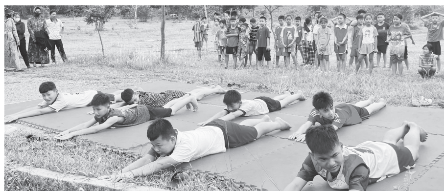
Các em học sinh được truyền đạt các kiến thức cần thiết, góp phần giảm thiểu rủi ro và nâng cao ý thức phòng tránh tai nạn đuối nước - Ảnh: X.P

Trung tâm Dịch vụ tổng hợp xã Kim Phú tổ chức khai giảng lớp học bơi phòng, chống đuối nước hè năm 2026 cho học sinh trên địa bàn.