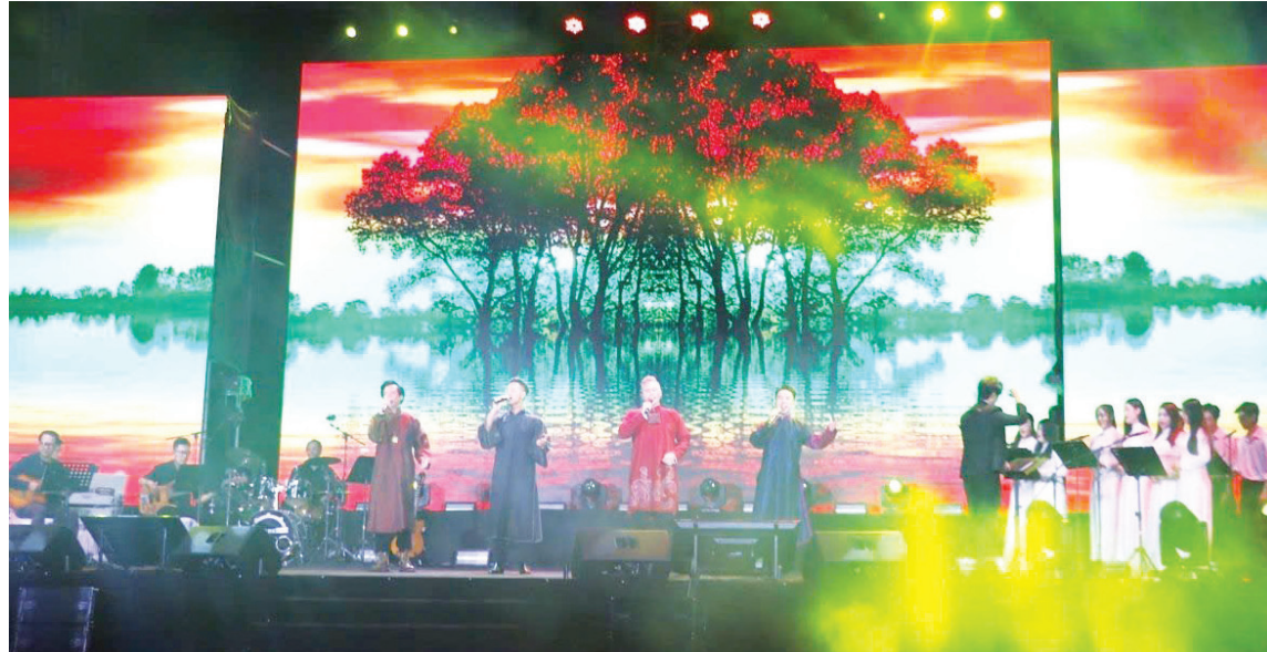
Một tiết mục trong đêm nhạc Trịnh Công Sơn được tổ chức ở Đông Hà năm 2024

Có một cơ duyên, nói theo cách của người xưa là "thiên thời, địa lợi, nhân hòa", khi nhìn lại sự giao hòa giữa mảnh đất Quảng Trị với ca khúc Trịnh Công Sơn. Khi tỉnh Quảng Trị (cũ) khởi xướng tổ chức lễ hội "Vì Hòa bình", sáng kiến nhận được sự hưởng ứng rộng rãi của công chúng, thì những ca khúc yêu chuộng hòa bình của Trịnh Công Sơn dường như càng thêm đồng điệu, cất lên những khát vọng thiện lành và vĩnh cửu, không chỉ của Quảng Trị, của Việt Nam mà còn của cả nhân loại.