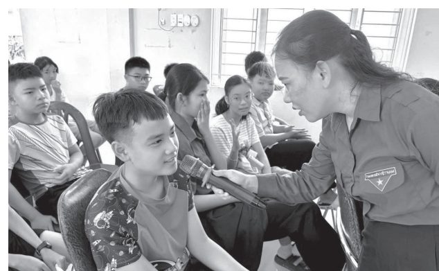
Học sinh được giao lưu, học hỏi, lan tỏa thông điệp “Hè an toàn - Vui khỏe mỗi ngày”

tình tiến hành kiểm tra 3 vụ việc. Kết quả, lực lượng chức năng phát hiện 2.109 sản phẩm, gồm: Áo, quần, giày, dép có dấu hiệu giả mạo nhãn hiệu, với tổng trị giá ước tính khoảng 660 triệu đồng. Toàn bộ tang vật đã được Phòng PC03 lập hồ sơ, tạm giữ để tiếp tục điều tra, xử lý theo quy định.