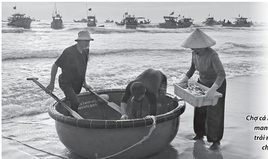
Chợ cá Nhân Trạch mang lại những trải nghiệm đẹp cho du khách

Tuy nhiên, hành trình khởi nghiệp cũng giúp anh hiểu rằng, bên cạnh ý tưởng, nguồn vốn và sự quyết tâm, người làm du lịch cần chủ động tìm hiểu, thực hiện đầy đủ các quy định liên quan đến hoạt động kinh doanh lưu trú. Trong quá trình hoàn thiện homestay, anh đã nhận được sự hướng dẫn, hỗ trợ của chính quyền địa phương và các cơ quan chức năng để từng bước hoàn thiện các thủ tục theo quy định. “Khởi nghiệp ở quê không hề dễ dàng, nhưng mỗi khó khăn đều là một bài