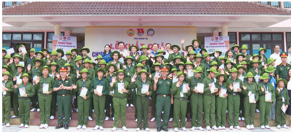
Các học viên chụp ảnh kỷ niệm với Ban tổ chức chương trình