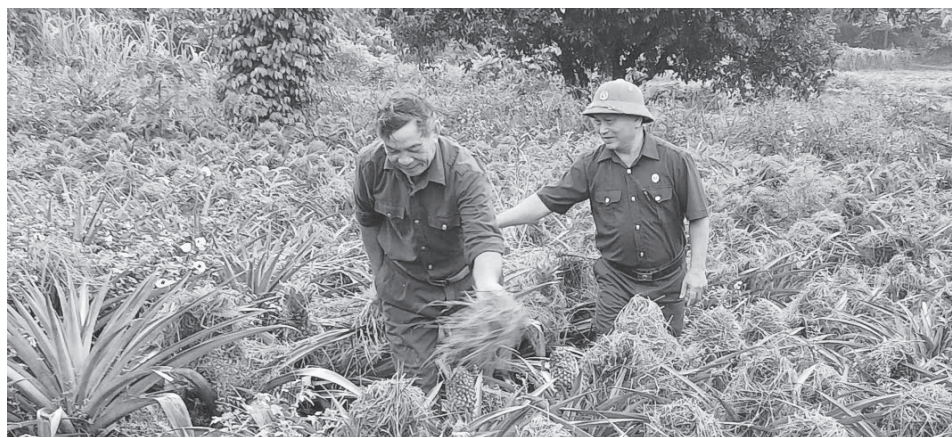
Hội viên cựu chiến binh xã Tân Mỹ tham quan, trao đổi kinh nghiệm phát triển kinh tế vườn đồi

Điều khiến nhiều người quý mến ông Dung không chỉ là sự nhạy bén trong phát triển kinh tế mà còn ở nghĩa tình đồng đội. Với kinh nghiệm tích lũy được