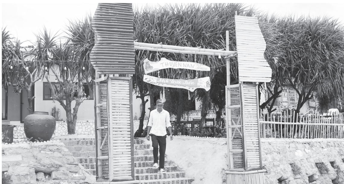
Homestay Thuyền Nan với đặc trưng giản dị của làng biển thu hút du khách

học. Điều quan trọng là mình phải kiên trì, chủ động học hỏi và mạnh dạn bắt tay vào làm”, anh Hán chia sẻ.