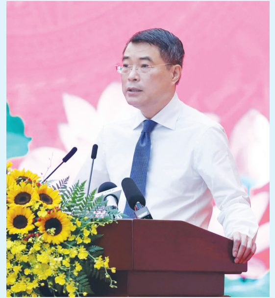
Đồng chí Lê Minh Hưng, Ủy viên Bộ Chính trị, Thủ tướng Chính phủ phát biểu phát động phong trào thi đua