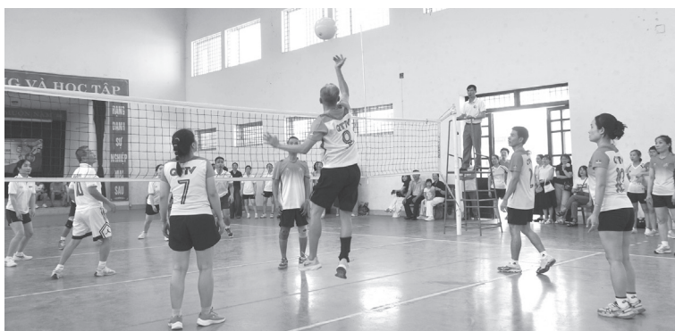
Các trận đấu đã diễn ra sôi nổi, hấp dẫn, thu hút sự theo dõi của đông đảo khán giả

Kết thúc giải đấu, Ban tổ chức đã trao giải nhất cho Tổ công đoàn Văn phòng, giải nhì Tổ công đoàn Phòng Kỹ thuật – Công nghệ, giải ba được trao cho Tổ công đoàn Phòng Chuyên đề và Tổ công