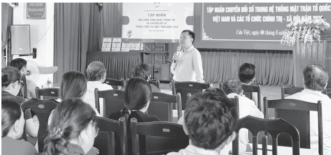
Tập huấn triển khai mô hình Mặt trận số cho khu dân cư

Tổng Bí thư, Chủ tịch nước nhấn mạnh: “Chuyển đổi số phải tạo ra phương thức mới để Mặt trận gần dân hơn, nghe dân rộng hơn, phản hồi dân nhanh hơn, giám sát việc giải quyết kiến nghị của dân minh bạch hơn”. Tất cả các chương trình, phong trào của Mặt trận phải xuất phát từ nhu cầu, nguyện vọng và lợi ích hợp pháp của Nhân dân; lấy Nhân