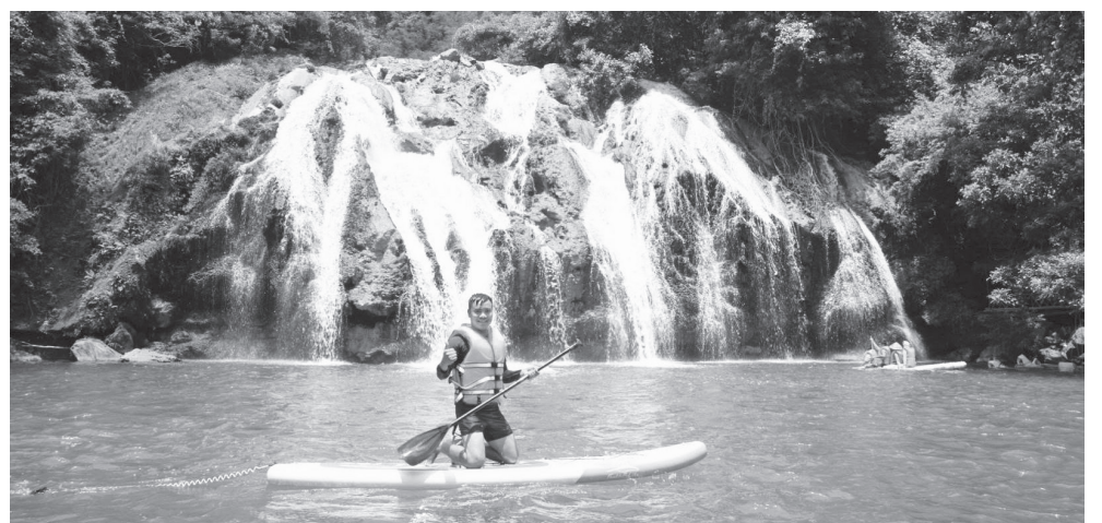
Du khách đến tắm, trải nghiệm cảnh quan thác Tà Puồng

Từ những bước đi ban đầu, du lịch cộng đồng không chỉ góp phần quảng bá hình ảnh quê hương mà còn mở ra cơ hội tạo sinh kế mới cho người dân Hướng Lập. Đây được xem là hướng phát triển phù hợp trong điều kiện địa phương có nhiều lợi thế về cảnh quan thiên nhiên và bản sắc văn hóa.