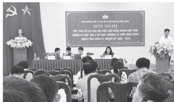
Các đại biểu HĐND tỉnh tiếp xúc cử tri xã Nam Trạch

Tại buổi tiếp xúc cử tri, đại diện tổ đại biểu HĐND tỉnh đã thông báo tới cử tri tình hình phát triển kinh tế-xã hội của tỉnh; hoạt động của HĐND tỉnh trong 5 tháng đầu năm 2026 và dự kiến nội dung kỳ họp thứ 3, HĐND tỉnh khóa IX.