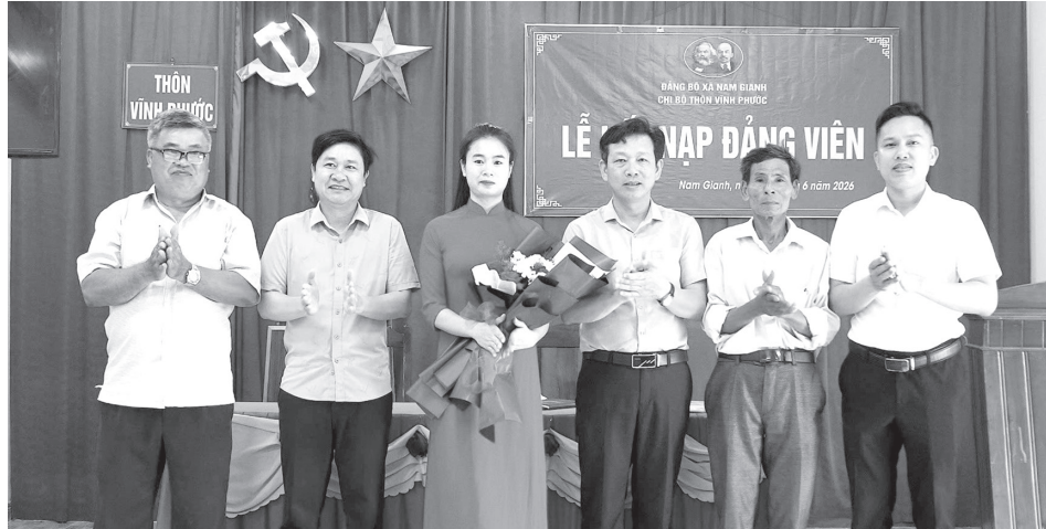
Chi bộ thôn Vĩnh Phước, Đảng bộ xã Nam Gianh kết nạp đảng viên mới

chức đoàn thể và xây dựng được niềm tin trong Nhân dân thì vẫn có thể phát hiện, bồi dưỡng được những nhân tố tích cực để giới thiệu cho Đảng.