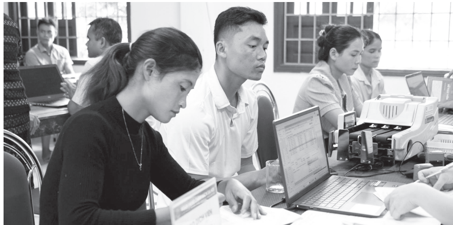
Người dân Hướng Lập thực hiện các thủ tục giao dịch tiếp cận nguồn vốn vay phát triển sản xuất kinh doanh

Cách trung tâm tỉnh lỵ khoảng 100km, Hướng Lập là một trong những địa bàn vùng sâu, vùng xa còn nhiều khó khăn của tỉnh Quảng Trị. Địa hình rộng, dân cư phân tán, 98% dân số là đồng bào Bru-Vân Kiều, hạ tầng viễn thông ở một số khu vực chưa đồng bộ đã tạo ra không ít trở ngại trong quá trình triển khai chuyển đổi số và cải cách hành chính. Thế nhưng, từ những khó khăn ấy, chính quyền địa phương đang nỗ lực từng bước thu hẹp khoảng cách số, đưa công nghệ đến gần hơn với người dân.