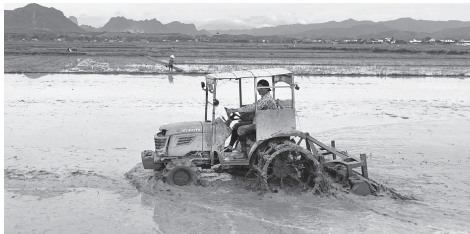
Các địa phương huy động máy làm đất để đẩy nhanh tiến độ gieo trồng vụ hè-thu