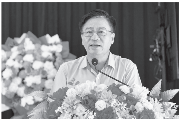
Đại biểu Đào Mạnh Hùng, Phó Chủ tịch Thường trực Ủy ban MTTQ Việt Nam tỉnh phát biểu tại buổi tiếp xúc cử tri

Nhiều ý kiến cử tri cho rằng, sau khi thực hiện sáp nhập xã, trụ sở làm việc của các cơ quan hành chính, Đảng và MTTQVN xã nằm cách xa nhau, gây khó khăn cho người dân khi thực hiện các thủ tục hành chính. Cử tri mong muốn tỉnh quan tâm, có phương án đầu tư xây dựng trụ sở làm việc tập trung, tạo thuận lợi cho hoạt động của bộ máy và phục vụ Nhân dân tốt hơn. Ngoài ra, cử tri cũng kiến nghị xem xét, bổ sung các chế độ, chính sách đối với cán bộ cấp phó các tổ chức đoàn thể, các hội quần chúng.