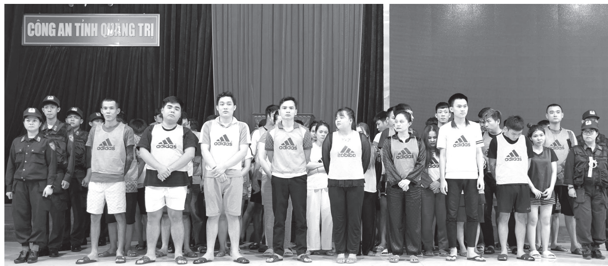
56 đối tượng người Việt Nam được lực lượng chức năng Lào bàn giao cho Công an tỉnh Quảng Trị để phục vụ công tác điều tra