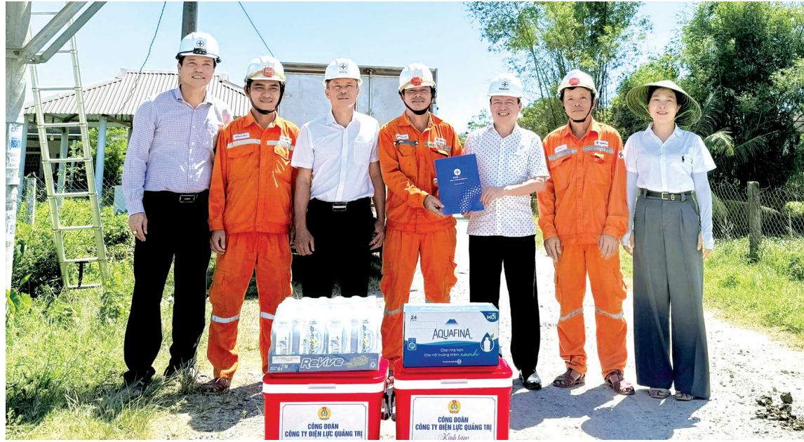
Công đoàn và chuyên môn Công ty Điện lực Quảng Trị tặng quà hỗ trợ chống nóng cho người lao động trực tiếp sản xuất

Tình trạng nắng nóng gay gắt tại Quảng Trị những ngày đầu hè không chỉ gây khó khăn cho sinh hoạt mà còn tiềm ẩn nhiều rủi ro về sức khỏe đối với công nhân làm việc tại công trường, nhà xưởng. Để chủ động ứng phó với nền nhiệt liên tục duy trì ở mức cao, các doanh nghiệp và tổ chức công đoàn cơ sở đẩy mạnh nhiều giải pháp chăm sóc sức khỏe cho người lao động (NLĐ), nhằm bảo đảm an toàn và duy trì nhịp độ sản xuất trong đơn vị.