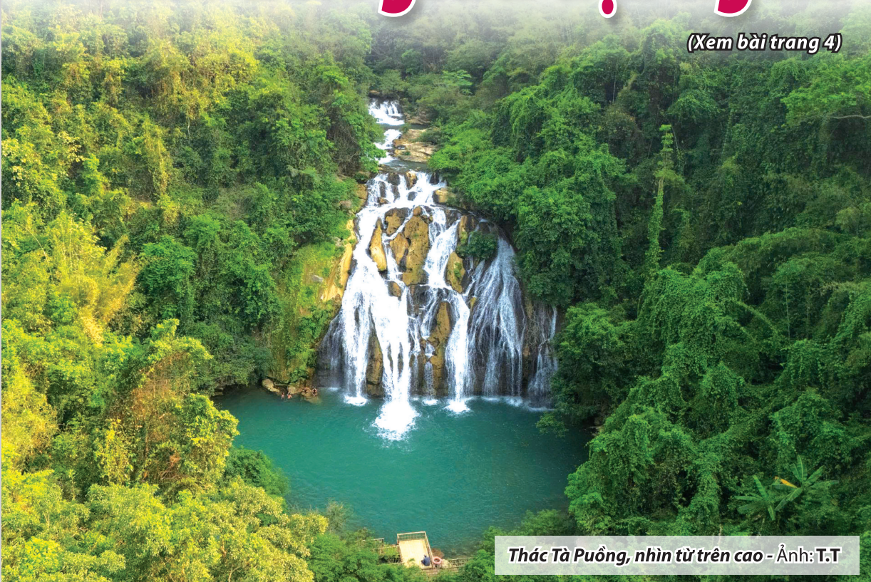
Thác Tà Pông, nhìn từ trên cao - Ảnh: T.T