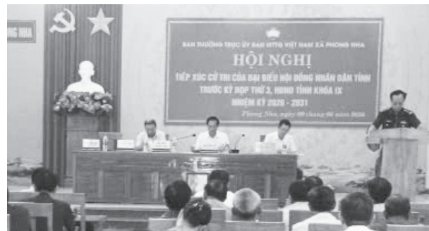
Quang cảnh buổi tiếp xúc cử tri - Ảnh: H.Đ

Cử tri xã Phong Nha bày tỏ sự đồng tình và phần khởi trước những kết quả khả quan trong quá trình phát triển kinh tế-xã hội của tỉnh; đồng thời mong muốn, Quảng Trị tiếp tục tháo gỡ khó khăn, vận hành ngày càng hiệu quả, thông suốt mô hình chính quyền địa phương 2 cấp.