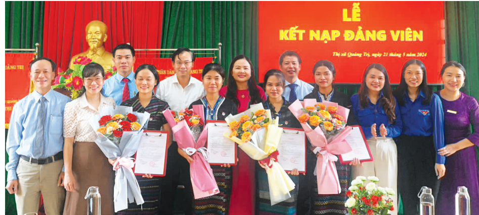
Lễ kết nạp đảng viên tại Trường phổ thông DTNT tỉnh

Ngày 13/6/2019, Ban Thường vụ Tỉnh ủy Quảng Bình (cũ) đã ban hành Chỉ thị số 33-CT/TU về tăng cường sự lãnh đạo của các cấp ủy đảng đối với công tác phát triển đảng viên ở vùng đồng bào DTTS, đồng bào theo tôn giáo, các địa bàn vùng sâu, vùng xa có điều kiện kinh tế-xã hội đặc biệt khó khăn và trong doanh nghiệp tư nhân trên địa bàn tỉnh; ngày 26/12/2025, Ban Thường vụ Tỉnh ủy Quảng Trị đã ban hành Kế hoạch số 13-KH/TU về kết nạp đảng viên giai đoạn