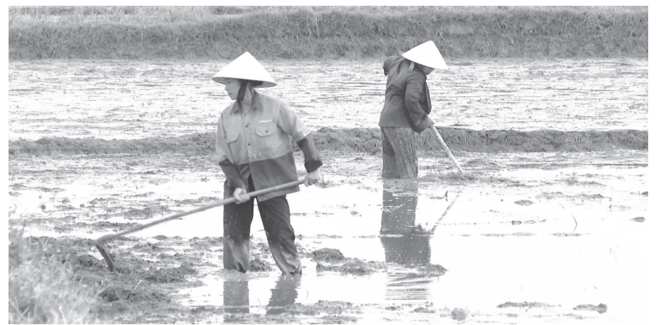
Nông dân Tân Mỹ làm đất, xuống giống vụ hè-thu