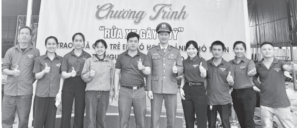
Chương trình "Rửa xe gây quỹ" của tuổi trẻ xã Tân Mỹ đã huy động được hơn 30 triệu đồng để trao quà cho thiếu nhi có hoàn cảnh khó khăn

Với tinh thần cống hiến của tuổi trẻ, thời gian qua, lực lượng đoàn viên, thanh niên (ĐVTN) xã Tân Mỹ đã để lại nhiều dấu ấn nổi bật thông qua các hoạt động xung kích, tình nguyện vì cộng đồng. Qua đó, tuổi trẻ xã Tân Mỹ từng bước khẳng định vai trò, trách nhiệm bằng những việc làm thiết thực, gần dân và giàu tính nhân văn.