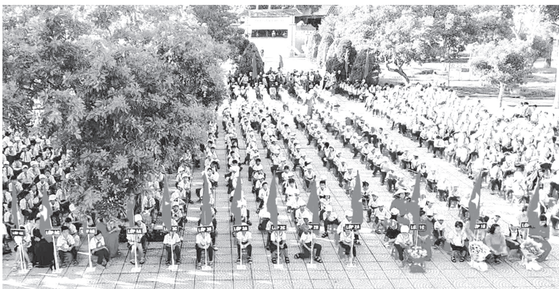
Một buổi sinh hoạt tập thể tại Trường tiểu học và THCS Cam Thủy

Năm học 2025-2026, dù đứng trước không ít khó khăn về tổ chức bộ máy, quản lý và điều hành, song ngành Giáo dục và Đào tạo (GD-ĐT) Quảng Trị đã chủ động thích ứng, duy trì ổn định hoạt động dạy học, đồng thời đạt nhiều kết quả tích cực trong nâng cao chất lượng GD-ĐT nguồn nhân lực.