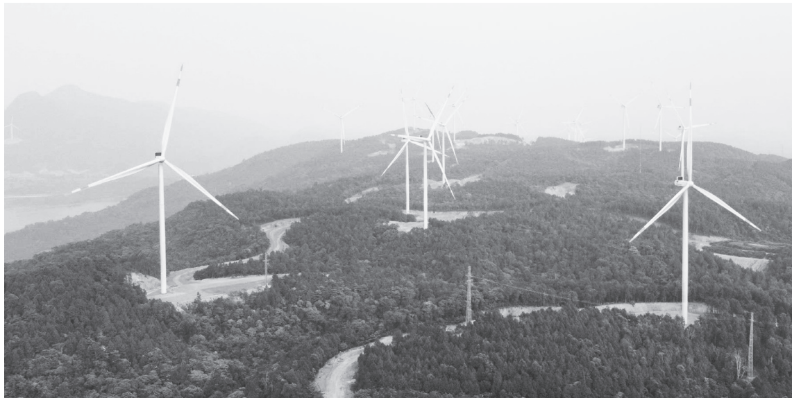
Nhiều dự án điện gió đã và đang triển khai thực hiện trên địa bàn tỉnh, thể hiện rõ hiệu quả thu hút đầu tư trong lĩnh vực năng lượng điện gió

Qua thanh tra việc chấp hành các quy định của pháp luật trong thực hiện trình tự, thủ tục mời quan tâm và chấp thuận nhà đầu tư (NĐT) tại các dự án điện gió trên địa bàn tỉnh, Thanh tra tỉnh đã chỉ ra nhiều tồn tại, hạn chế trong quá trình thực hiện thủ tục lựa chọn NĐT. Hoạt động thanh tra này nhằm góp phần tháo gỡ khó khăn, vướng mắc cho các dự án và phòng ngừa vi phạm, khơi thông nguồn lực phát triển kinh tế-xã hội và phục vụ hoạt động đầu tư ngày càng hiệu quả.