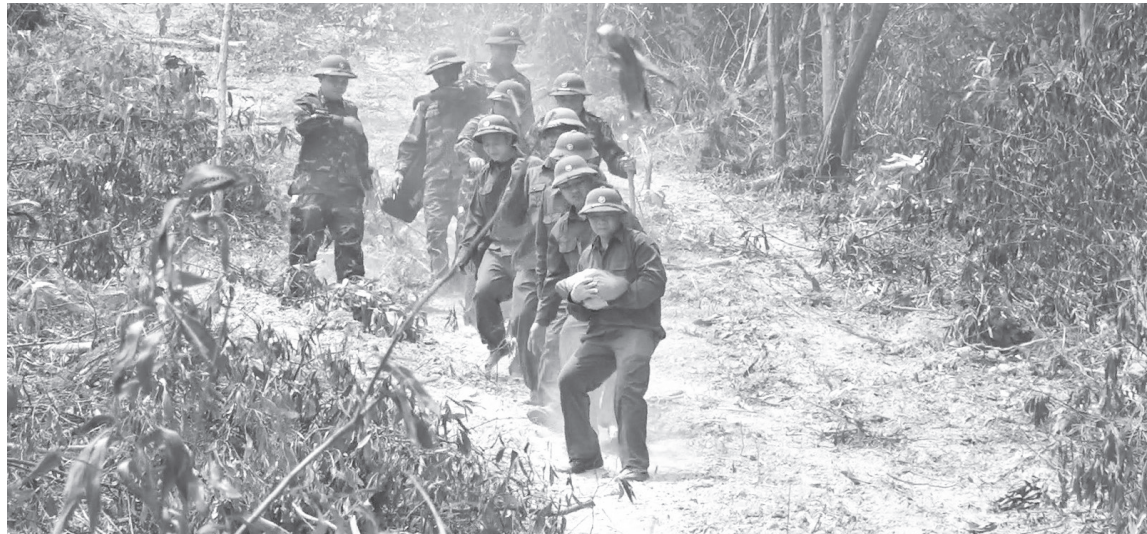
Đội tìm kiếm, quy tập hài cốt liệt sĩ Sư đoàn 968 tìm kiếm, quy tập được 3 hài cốt liệt sĩ tại khu vực cao điểm 278, xã Hiếu Giang

Chiến tranh đã lùi xa hơn nửa thế kỷ, nhưng trên mảnh đất Quảng Trị vẫn còn nhiều liệt sĩ chưa được trở về với quê hương, gia đình và đồng đội. Vượt qua khó khăn khi nguồn thông tin ngày càng ít, địa hình chiến trường thay đổi theo thời gian, cán bộ, nhân viên Đội tìm kiếm, quy tập hài cốt liệt sĩ Sư đoàn 968 (Quân khu 4) vẫn ngày đêm bền bỉ trên hành trình đưa các anh trở về với đất mẹ yêu thương.