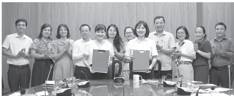
Lễ ký kết bàn giao, tiếp nhận nguyên trạng Làng trẻ em SOS Đồng Hới về UBND tỉnh Quảng Trị quản lý