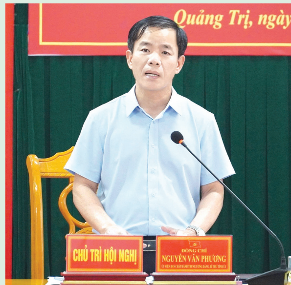
Đồng chí Nguyễn Văn Phương, Ủy viên Trung ương Đảng, Bí thư Tỉnh ủy phát biểu kết luận buổi làm việc