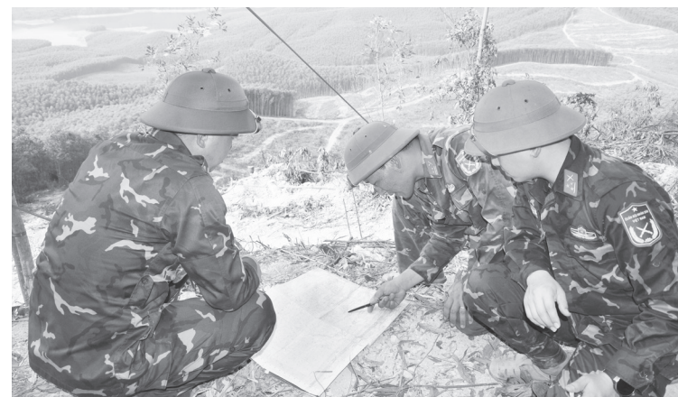
Lãnh đạo, chỉ huy Sư đoàn 968 kiểm tra việc xác định tọa độ tìm kiếm trên bản đồ