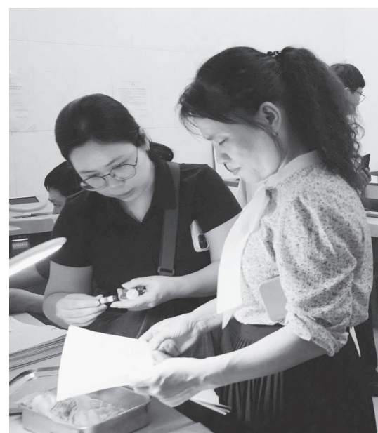
Sở Y tế kiểm tra các cơ sở khám, chữa bệnh trên địa bàn tỉnh - Ảnh: N.H.N