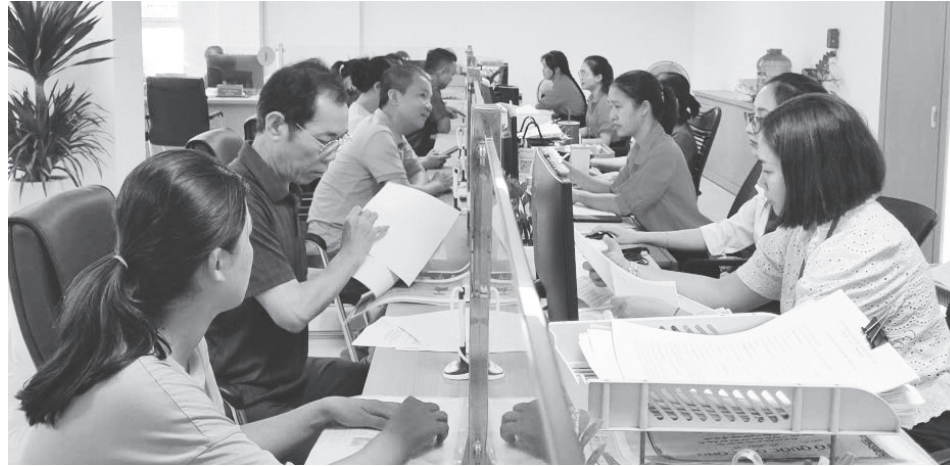
Nâng cao chất lượng đội ngũ cán bộ, công chức cấp xã để phục vụ Nhân dân tốt hơn

"Trong thời gian chờ đào tạo, kiện toàn đội ngũ, chúng tôi mong có chủ trương cho địa phương thực hiện tiếp nhận viên chức, người hoạt động không chuyên trách (những người có kinh nghiệm) vào làm việc ở một số lĩnh vực chuyên môn sâu mà cấp xã đang thiếu như: Quản lý đất đai, xây dựng, tài chính, công nghệ thông tin... nhằm đáp ứng yêu cầu vận hành bộ máy trong giai đoạn hiện nay", ông Thông chia sẻ.