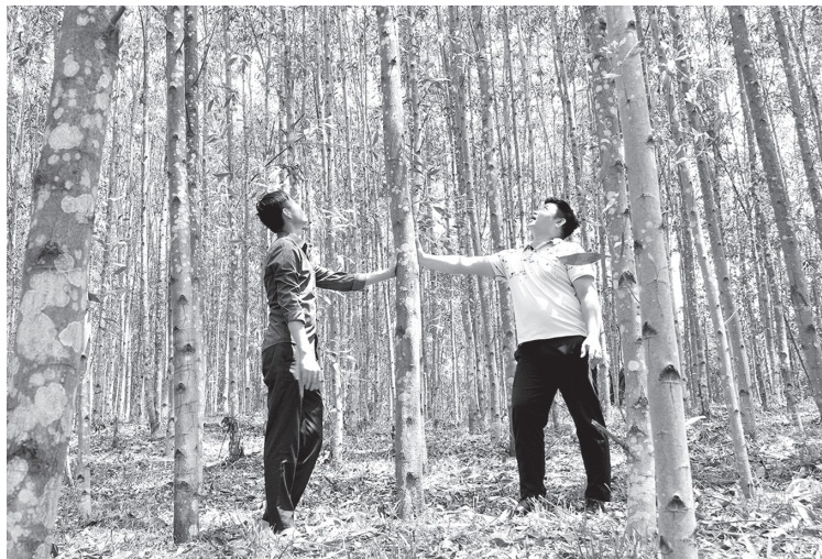
Những cánh rừng trồng đang mang lại thu nhập cao cho người dân xã Tân Thành

Không chỉ riêng thôn Sy, phong trào trồng rừng ở thôn Thanh Long cũng phát triển