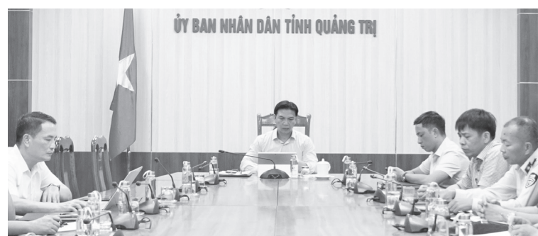
Các đại biểu dự hội nghị tại điểm cầu Quảng Trị