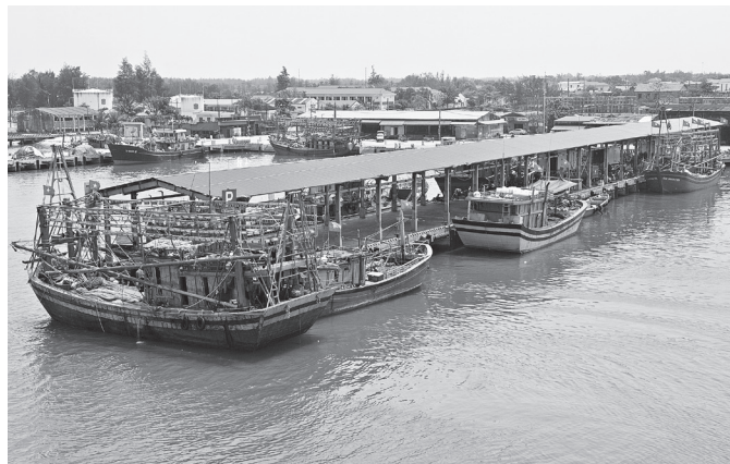
Tàu cá của ngư dân Quảng Trị cập cảng bốc dỡ hải sản sau chuyến biển dài ngày tại ngư trường Hoàng Sa

Mặc dù phía Trung Quốc đơn phương áp đặt “lệnh cấm đánh bắt cá có thời hạn” phi lý nhưng ngư dân trên địa bàn tỉnh vẫn kiên cường vươn khơi, bám biển. Đối với mỗi ngư dân, những chuyến biển không chỉ là sinh kế, mà mỗi con tàu, mỗi lá cờ Tổ quốc tung bay giữa trùng khơi còn khẳng định sự hiện diện thường xuyên của ngư dân Việt Nam trên ngư trường truyền thống.