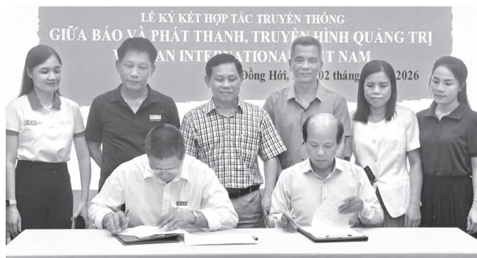
Lãnh đạo Báo và phát thanh, truyền hình Quảng Trị và đại diện Văn phòng Plan tại Quảng Trị ký kết hợp tác truyền thông