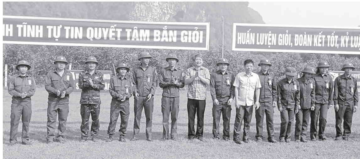
Lãnh đạo xã Tân Thành thăm, tặng quà, động viên lực lượng tham gia huấn luyện

Thời gian qua, trên thao trường xã Tân Thành luôn rộn ràng khí thế học tập, rèn luyện của lực lượng dân quân. Dưới nắng hè oi bức, các đội hình huấn luyện vẫn được triển khai nghiêm túc, góp phần xây dựng lực lượng dân quân vững mạnh, đáp ứng yêu cầu nhiệm vụ sẵn sàng chiến đấu.