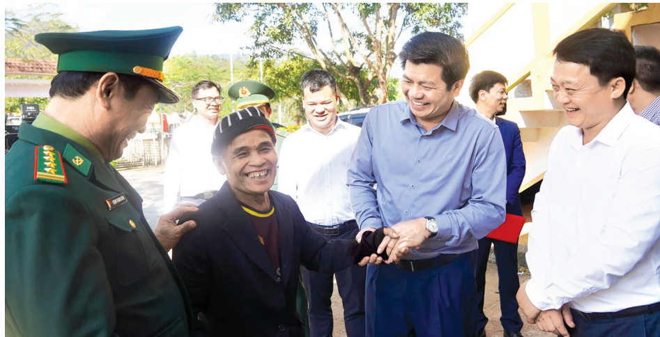
Đồng chí Trần Vũ Khiêm, Phó Bí thư Thường trực Tỉnh ủy và các đồng chí lãnh đạo tỉnh trò chuyện cùng bà con xã Thượng Trạch

Những chủ trương trên cho thấy Đảng, Nhà nước ta luôn dành sự quan tâm đến