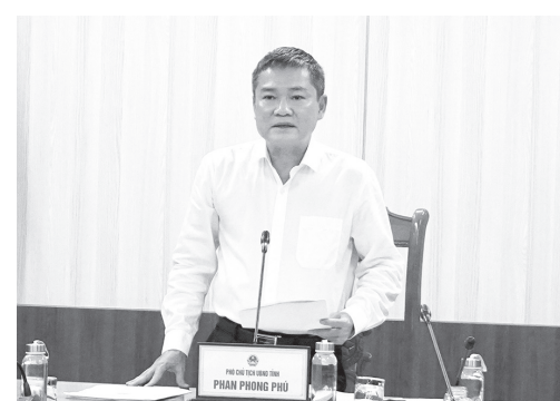
Đồng chí Phan Phong Phú, Phó Chủ tịch UBND tỉnh phát biểu tại buổi làm việc

Đối với dự án công trình cơ sở hạ tầng khu dịch vụ du lịch Cửa Tùng-Cửa Việt (gói thầu QT04), đồng chí Phó Chủ tịch UBND tỉnh Phan Phong Phú yêu cầu xã Gio Linh chủ trì chỉ đạo Ban Quản lý dự án, phát