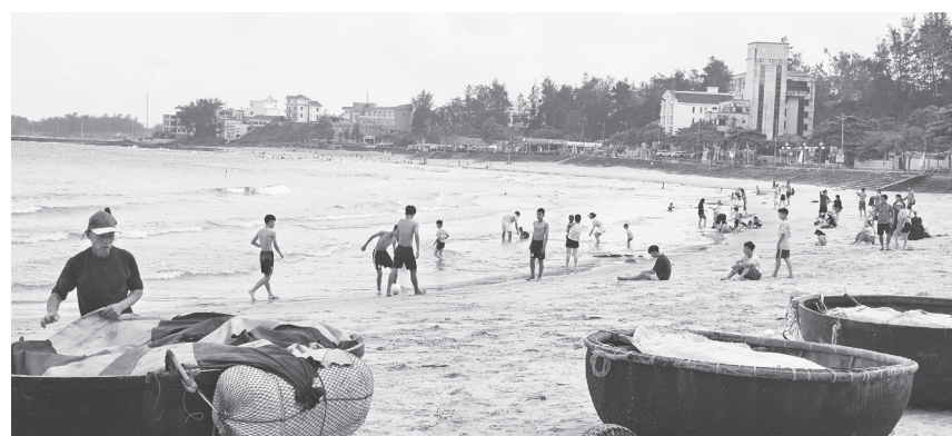
Biển Cửa Tùng thu hút đông khách du lịch

Điều thú vị là trong câu chuyện phát triển hôm nay, Cửa Tùng không chỉ thay đổi ở hạ tầng hay không gian kinh tế, mà chính là thay đổi trong cách nghĩ của người dân. Nhiều người trẻ đi làm xa quê bắt đầu quay về mở quán cà phê, làm homestay, bán hàng online, chế biến đặc sản địa phương, đưa sản phẩm lên sàn thương mại điện tử... Toàn xã hiện có tới 79 trạm thu phát sóng di động, trong đó có 3 trạm 5G; tỉ lệ hồ sơ trực tuyến, thanh toán số thuộc nhóm cao của tỉnh là chỉ dấu cho sự thay đổi tích cực trong thời đại số. Một vùng quê ven biển đang chuyển động theo cách âm thầm nhưng rõ rệt thành một cực tăng trưởng ven biển thực sự, nơi người dân có thể sống được bằng nghề biển, giàu lên từ biển nhưng vẫn giữ được hồn cốt của một miền quê ven sóng.