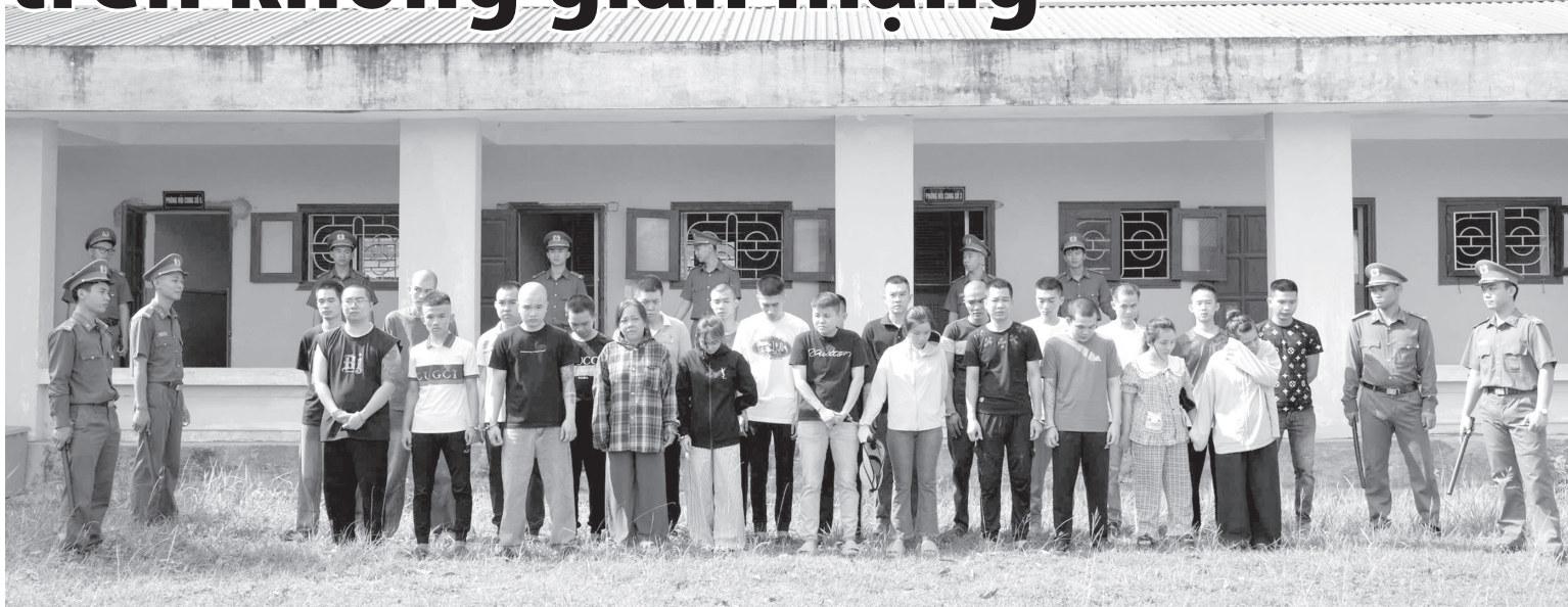
Các đối tượng trong đường dây lừa đảo vừa bị cơ quan Công an bắt giữ

Thời gian gần đây, tình trạng lừa đảo trên không gian mạng tiếp tục diễn biến phức tạp với nhiều thủ đoạn tinh vi, đánh vào tâm lý, tình cảm và lòng tin của người dân. Mới đây, Phòng Cảnh sát hình sự, Công an tỉnh Quảng Trị đã đấu tranh, triệt phá một đường dây lừa đảo đầu tư tài chính xuyên quốc gia, chiếm đoạt hàng nghìn tỉ đồng của hàng nghìn bị hại trên toàn quốc.