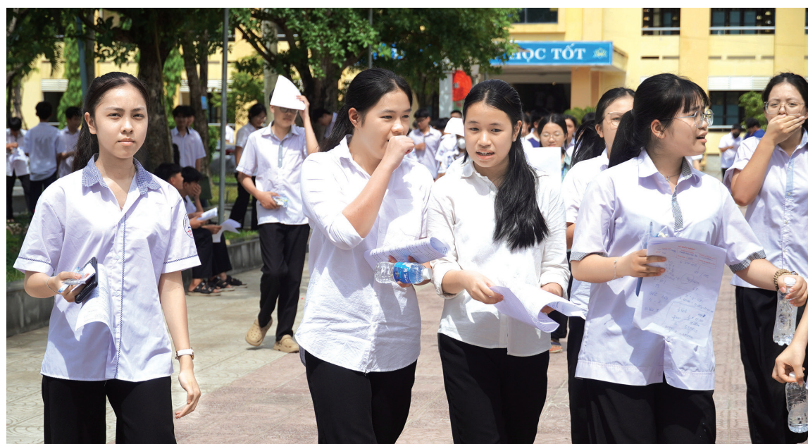
Tuyển sinh THPT là cơ sở đánh giá kết quả học tập của học sinh theo mục tiêu chương trình giáo dục phổ thông cấp THCS