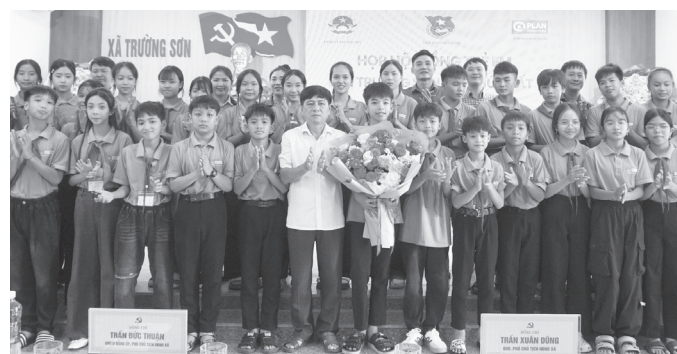
Hội đồng trẻ em xã Trường Sơn chụp ảnh lưu niệm cùng đại biểu