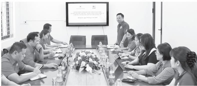
Quang cảnh buổi làm việc

Thời gian qua, Hội CTĐ tỉnh đã chủ động phối hợp với các sở, ngành, đơn vị, địa phương triển khai hiệu quả nhiều hoạt động an sinh xã hội, nhân đạo từ thiện, hướng đến người nghèo và các đối tượng yếu thế. Trong đó, phong trào "Tết Nhân ái" Xuân Bính Ngọ 2026 được triển khai đồng bộ, kịp thời và đạt hiệu quả cao. Toàn tỉnh đã trao hơn 38.600 suất quà cho các gia đình có hoàn cảnh khó khăn với tổng trị giá khoảng 28 tỉ đồng. Bên cạnh đó, cuộc vận động "Mỗi tổ chức, mỗi cá nhân gắn với một địa chỉ nhân đạo" tiếp tục được duy trì hiệu quả, hỗ trợ gần 100