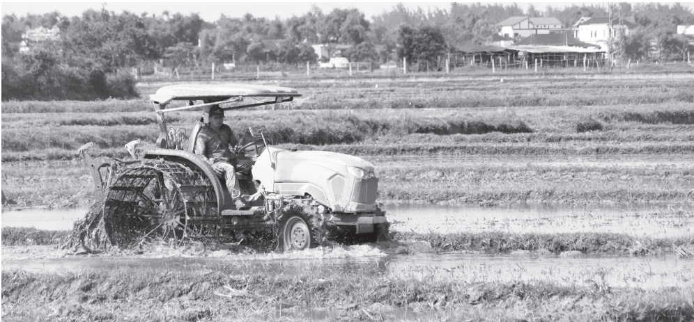
Nông dân Bắc Gianh khẩn trương triển khai vụ hè-thu

Vụ đông-xuân 2025-2026, vụ mùa đầu tiên sau sáp nhập đơn vị hành chính, phường Bắc Gianh thắng lợi toàn diện với năng suất lúa đạt gần 60 tạ/ha, cao hơn vụ trước gần 3 tạ/ha. Tuy nhiên, bước vào vụ hè-thu, địa phương tiếp tục đối mặt với nhiều khó khăn về thời tiết, nguồn nước và chi phí sản xuất. Trước thực tế đó, Bắc Gianh đang chủ động triển khai nhiều giải pháp nhằm bảo đảm sản xuất hiệu quả, bền vững.