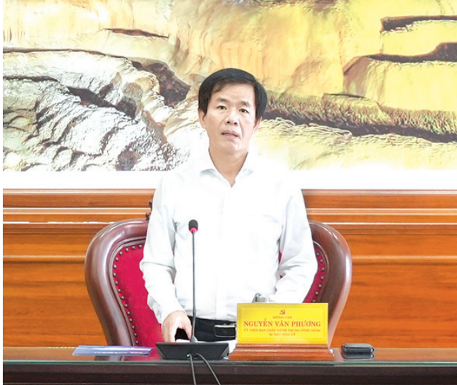
Đồng chí Nguyễn Văn Phương, Ủy viên Trung ương Đảng, Bí thư Tỉnh ủy kết luận buổi làm việc