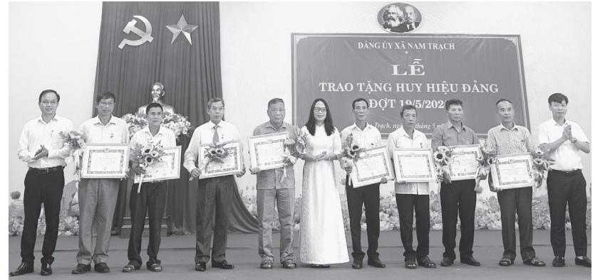
Đảng bộ xã Nam Trạch tổ chức trao Huy hiệu Đảng cho các đảng viên