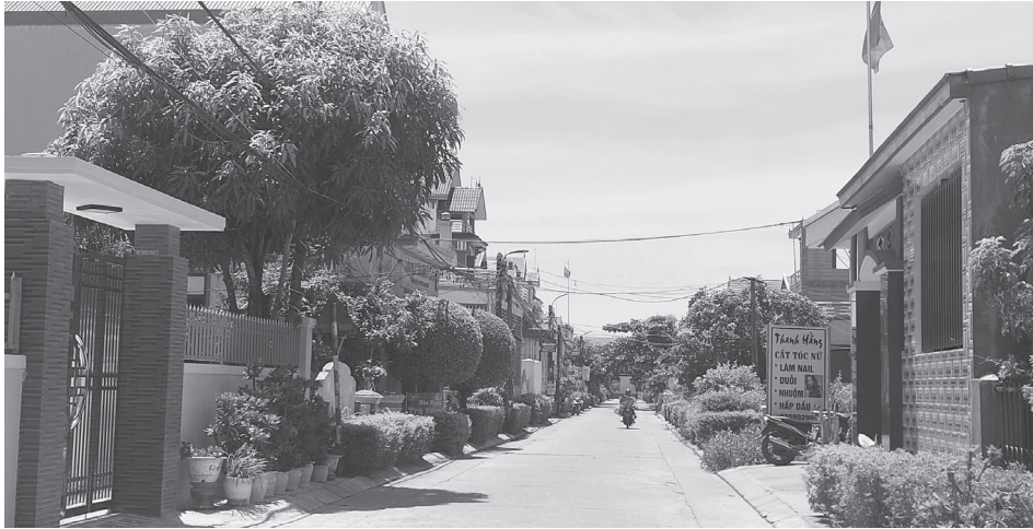
Thiếu văn bản hướng dẫn chi tiết khiến xã Bắc Trạch khó đánh giá và thực hiện các tiêu chí