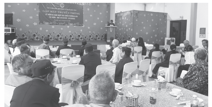
Quang cảnh buổi gặp mặt

Sáng 19/5/2026, Tiểu đoàn 70 tỉnh Quảng Bình tổ chức buổi gặp mặt truyền thống nhân kỷ niệm 55 năm ngày vào chiến trường B chiến đấu và phục vụ chiến đấu.