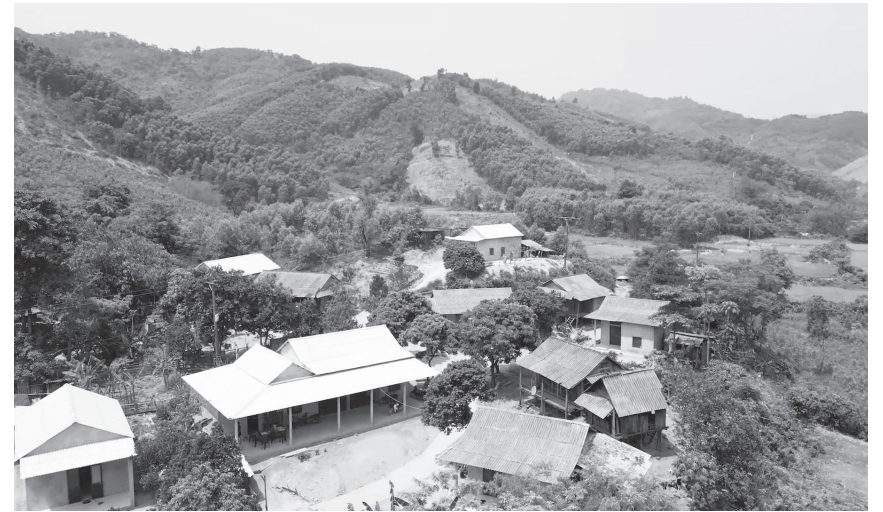
Bản làng miền núi Quảng Trị hôm nay

Ngày nay, tuy cuộc sống còn nhiều khó khăn, vất vả nhưng người Vân Kiều, Pa Kô ở tỉnh Quảng Trị luôn nỗ lực vươn lên thoát nghèo, làm giàu chính đáng. Tự hào được mang họ Bác Hồ, bà con đã không ngừng học tập phát triển kinh tế, xây dựng gia đình ấm no, hạnh phúc, góp phần đổi mới quê hương.