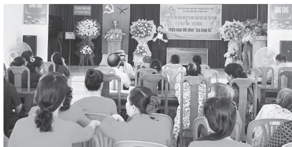
Phổ biến nội dung chuyển đổi số cho hội viên phụ nữ

Địp này, nhiều phần quà ý nghĩa đã được tặng cho hội viên phụ nữ có hoàn cảnh khó khăn trên địa bàn, nhằm lan tỏa tinh thần sẻ chia và gắn kết trong tổ chức hội.