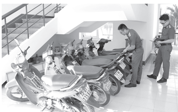
Công an phường Đồng Sơn kịp thời thu giữ 7 xe mô tô là tang vật và phương tiện liên quan vụ án