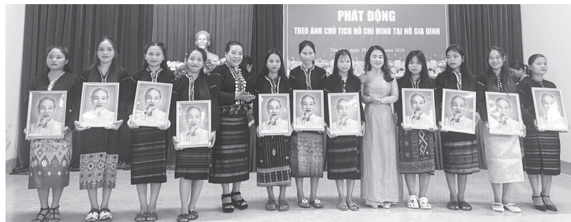
Ban tổ chức trao tặng ảnh chân dung Chủ tịch Hồ Chí Minh cho các hộ gia đình tiêu biểu tại lễ phát động