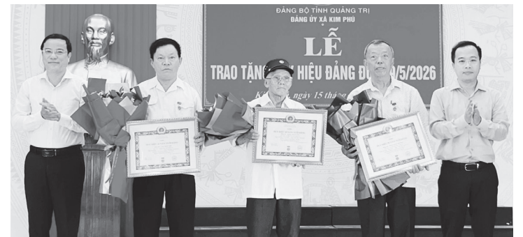
Thường trực Đảng ủy xã Kim Phú trao huy hiệu Đảng cho các đảng viên

Việc trao tặng huy hiệu Đảng là sự ghi nhận đối với quá trình phấn đấu, rèn luyện và những đóng góp của các đảng viên cho sự nghiệp cách mạng, công cuộc xây dựng Đảng. Thông qua hoạt động