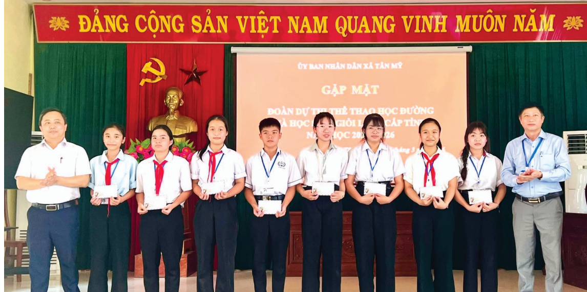
Lãnh đạo xã Tân Mỹ gặp mặt, động viên học sinh tham gia hội thi thể thao học đường và kỳ thi học sinh giỏi lớp 9 cấp tỉnh

Những năm gần đây, giáo dục xã Tân Mỹ có bước chuyển rõ nét theo hướng ổn định nền nếp, nâng cao chất lượng và chú trọng giáo dục mũi nhọn. Nổi bật là những kết quả đạt được tại các kỳ thi quan trọng từ cấp tỉnh đến cấp quốc gia, góp phần khẳng định vị thế và chất lượng giáo dục của địa phương.