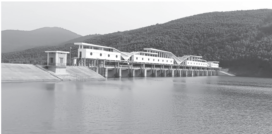
Các công trình hồ đập thuộc Công ty TNHH MTV Khai thác công trình thủy lợi Quảng Bình quản lý hiện bảo đảm lượng nước phục vụ sản xuất

Chi nhánh Thủy nông Kiến Giang được công ty giao quản lý khai thác 4 hồ chứa, 1