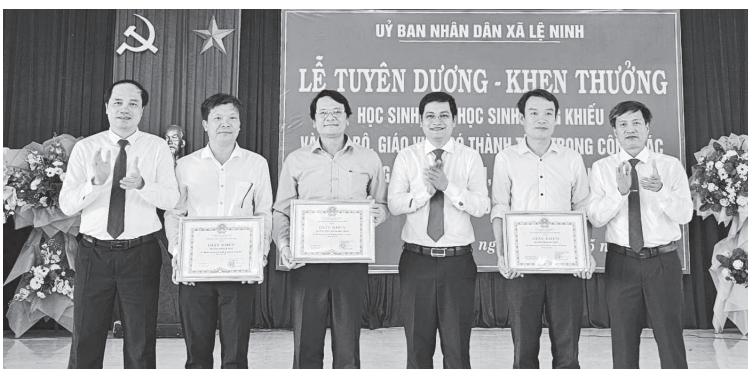
Lãnh đạo xã Lệ Ninh tuyên dương các tập thể đạt thành tích xuất sắc trong năm học 2025-2026

● Ngày 18/5/2026, xã Lệ Ninh tổ chức tuyên dương, khen thưởng giáo viên, học sinh đạt thành tích cao trong các kỳ thi học sinh giỏi, học sinh năng khiếu cũng như công tác bồi dưỡng, huấn luyện năm học 2025-2026.