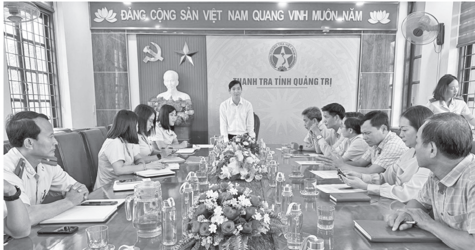
Thanh tra tỉnh triển khai các chương trình công tác trọng tâm

Ngày 5/5/2026, Ban Chấp hành Đảng bộ tỉnh ban hành Chương trình hành động số 23-CTr/TU thực hiện Nghị quyết số 04-NQ/TW ngày 1/4/2026 của Ban Chấp hành Trung ương Đảng về tiếp tục tăng cường sự lãnh đạo của Đảng đối với công tác phòng, chống tham nhũng (PCTN), lãng phí (LP), tiêu cực (TC) trong giai đoạn mới, trong đó tập trung vào 7 nhóm nhiệm vụ, giải pháp trọng tâm về PCTN, LP, TC.