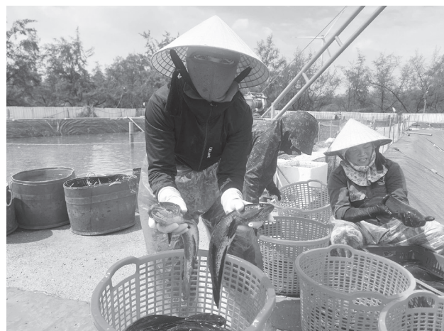
Nuôi cá lóc công nghệ cao trên địa bàn xã Cam Hồng cho hiệu quả kinh tế cao