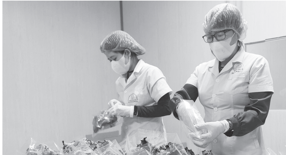
Nhiều sản phẩm OCOP đứng trước áp lực giữa nâng cao chất lượng mẫu mã và giá thành