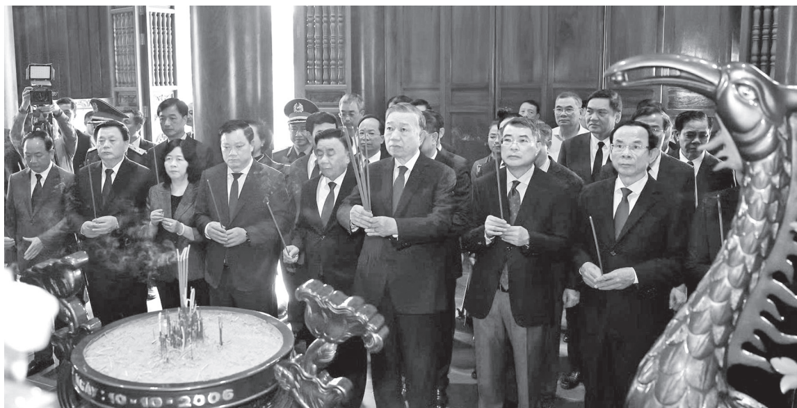
Tổng Bí thư Tô Lâm cùng Đoàn công tác Trung ương đến dâng hoa, dâng hương tưởng niệm Chủ tịch Hồ Chí Minh tại Khu Di tích quốc gia đặc biệt Kim Liên, tỉnh Nghệ An vào tháng 1/2026

Tinh thần ấy đặt ra yêu cầu rất rõ đối với công cuộc đổi mới hiện nay: Mọi cải cách phải lấy Nhân dân làm trung tâm, lấy phục vụ Nhân dân tốt hơn làm mục tiêu và lấy sự hài lòng, niềm tin, hạnh phúc của Nhân dân làm thước đo đánh giá. Tinh gọn bộ máy không phải chỉ để giảm đầu mối, giảm tầng nấc, giảm chi phí, mà sâu xa hơn là để bộ máy gần dân hơn, sát cơ sở hơn, xử lý công việc nhanh hơn, phục vụ người dân và doanh nghiệp tốt hơn. Phân cấp, phân quyền để rõ người, rõ việc, rõ trách nhiệm, phát huy tính chủ động, sáng tạo, tự chịu trách nhiệm