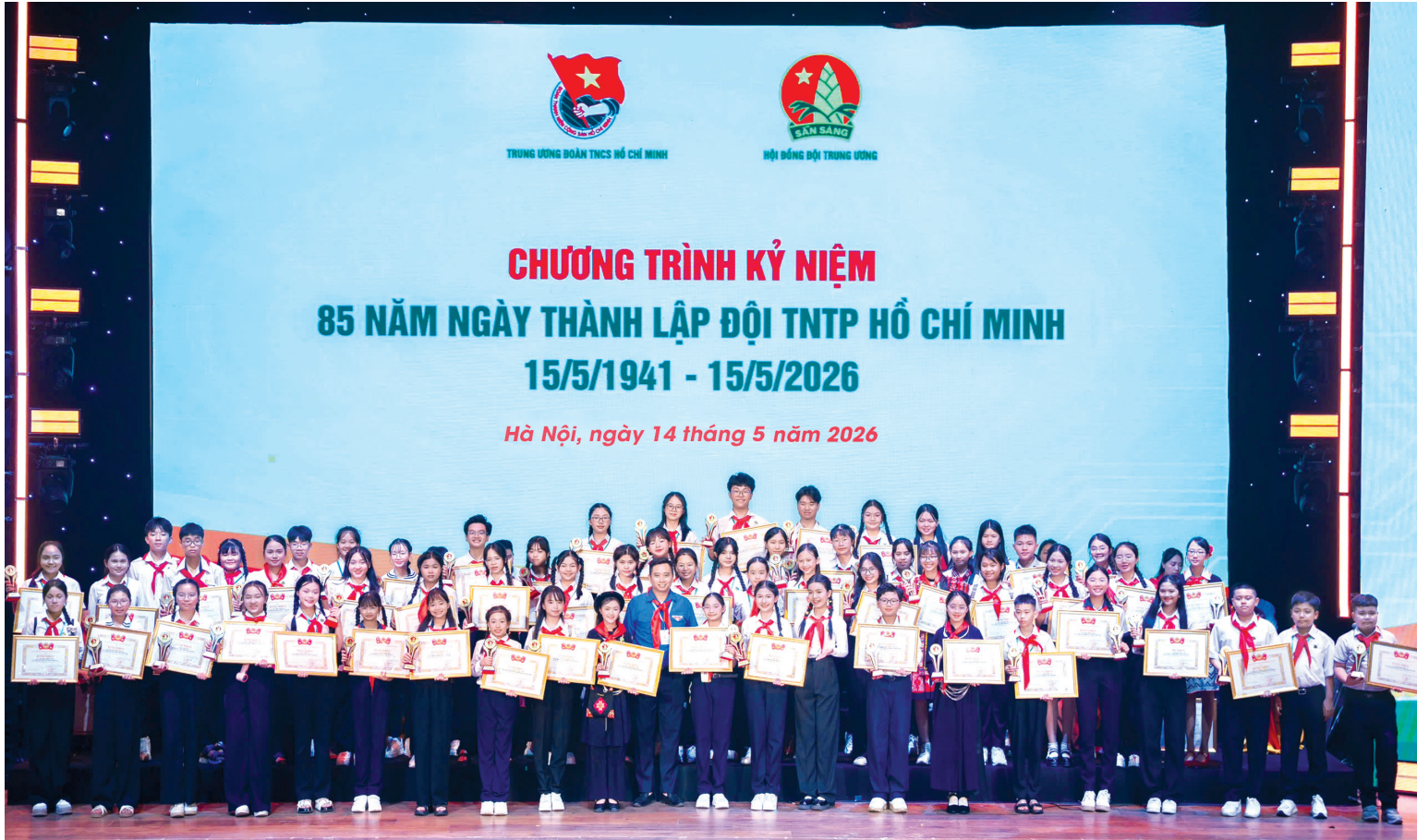
Các đội viên tiêu biểu trên cả nước được tuyên dương tại chương trình kỷ niệm 85 năm Ngày thành lập Đội Thiếu niên tiền phong Hồ Chí Minh và trao Giải thưởng Kim Đồng năm học 2025-2026

Giữa nhiều đội viên tiêu biểu trên cả nước, tỉnh Quảng Trị có 3 gương mặt xuất sắc được tuyên dương Giải thưởng Kim Đồng năm học 2025-2026. Đây không chỉ là niềm tự hào của thiếu nhi tỉnh nhà mà còn cho thấy hiệu quả từ công tác Đội trong trường học, nơi đang từng ngày bồi dưỡng những đội viên giàu tri thức, kỹ năng, tinh thần trách nhiệm và khát vọng cống hiến.