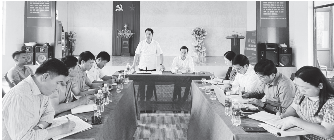
Các buổi làm việc giữa Thường trực Đảng ủy xã Kim Phú và tổ chức đảng ở cơ sở luôn diễn ra trong không khí dân chủ, cởi mở

Thường trực Đảng ủy xã trực tiếp xuống từng thôn, bản để cùng sinh hoạt và lắng nghe tiếng nói từ tổ chức đảng ở cơ sở, từ đó nắm bắt kịp thời những vấn đề còn tồn tại và chỉ đạo tháo gỡ dứt điểm. Đó là cách làm hiệu quả được Đảng bộ xã Kim Phú triển khai thực hiện, hướng tới mục tiêu xây dựng Đảng, xây dựng chính quyền gần dân hơn, sát việc hơn và thực chất hơn.