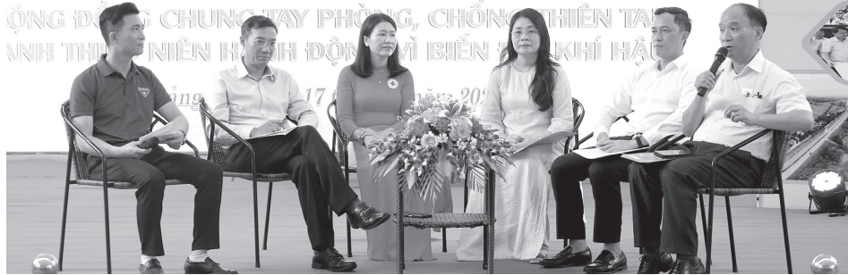
Các đại biểu tham dự tọa đàm với chủ đề "Vai trò của thanh thiếu niên trong thích ứng biến đổi khí hậu và giảm nhẹ rủi ro thiên tai"

HƯỚNG ỨNG TUẦN LỄ QUỐC GIA PHÒNG, CHỐNG THIÊN TAI NĂM 2026 KỶ NIỆM 80 NĂM NGÀY TRUYỀN THỐNG PHÒNG, CHỐNG THIÊN TAI VIỆT NAM CỘNG ĐỒNG CHUNG TAY PHÒNG, CHỐNG THIÊN TAI ANH THÌ NIÊN HỮU ĐỘN MỖ BIẾN ỨNG ỨNG KHÍ HẬU