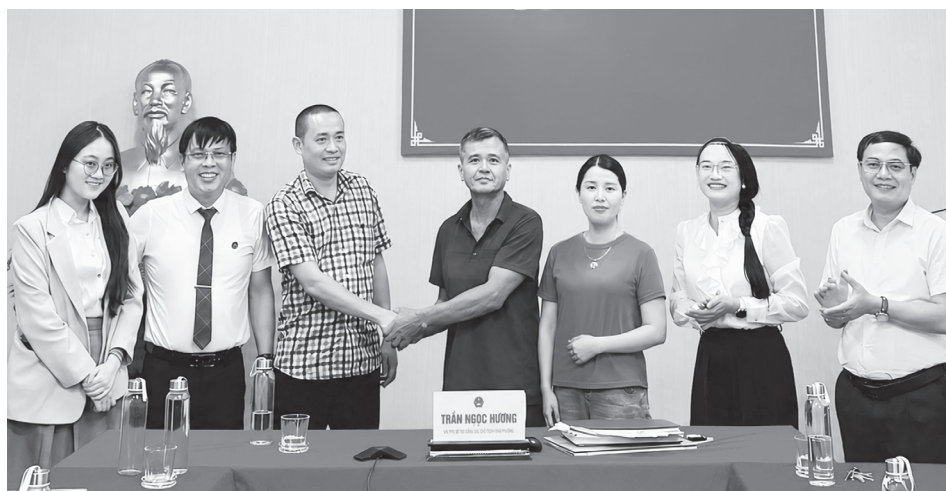
Cái bắt tay ấm áp sau khi “nút thắt” hơn 20 năm được tháo gỡ

Sau hơn 20 năm khiếu kiện kéo dài, điều khiến nhiều người ở tổ dân phố Đình Chùa, phường Bắc Gianh cảm thấy nhẹ nhõm không chỉ là vụ việc tranh chấp đất đai cuối cùng đã được giải quyết, mà còn bởi tình cảm họ hàng được giữ gìn. Để có được kết quả ấy, chính quyền phường Bắc Gianh đã kiên trì tìm hướng tháo gỡ hài hòa cho cả hai bên trên tinh thần thấu tình đạt lý. Đặc biệt, vai trò chủ động của cấp xã, phường trong mô hình chính quyền địa phương 2 cấp đã trở thành yếu tố quan trọng đưa vụ việc kéo dài nhiều năm đi đến đồng thuận.