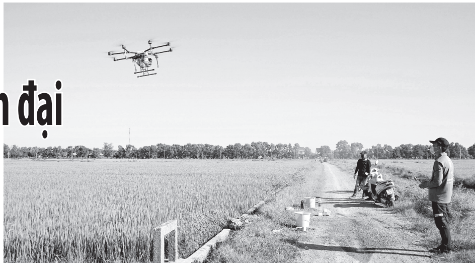
Ứng dụng drone vào phun thuốc bảo vệ thực vật cho lúa - Ảnh: L.A

Theo Phó Giám đốc Sở Nông nghiệp và Môi trường Trần Đình Hiệp, một trong những kết quả nổi bật trong chuyển đổi số của ngành là chỉ số cải cách hành chính và dịch vụ công trực tuyến với tỉ lệ hồ sơ trực tuyến toàn ngành trong quý I/2026 đạt con số ấn tượng 97,8%, tăng cao so với mức 40,1% của năm 2025. Việc số hóa hồ sơ đầu vào đạt gần tuyệt đối 99,97%, tỉ lệ tái sử dụng dữ liệu số hóa đạt 99,2% và đặc biệt là mức độ hài lòng của người dân và doanh nghiệp duy trì ở mức 100% đã phản ánh sự thay đổi về chất trong phương thức phục vụ người dân. Những con số này cho thấy chuyển đổi số không còn dừng ở chủ trương mà đã đi vào thực chất, góp phần