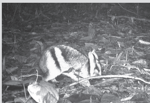
Thỏ vằn Trường Sơn

Ban Quản lý Rừng phòng hộ Tuyên Hóa đã phối hợp với Trung tâm Môi trường và phát triển nguồn lực cộng đồng triển khai chương trình "Khảo sát đa dạng sinh học nhóm thú mặt đất tại khu vực rừng phòng hộ Tuyên Hóa, tỉnh Quảng Trị bằng phương pháp bẫy ảnh". Đoàn nghiên cứu đã tiến hành lắp đặt hệ thống máy tại 53 điểm khảo sát.