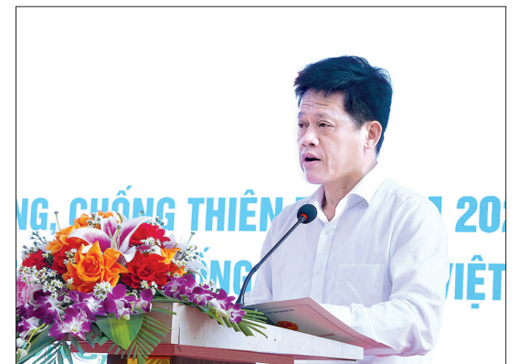
Đồng chí Lê Văn Bảo, Ủy viên Ban Thường vụ Tỉnh ủy, Phó Chủ tịch UBND tỉnh phát biểu tại buổi lễ