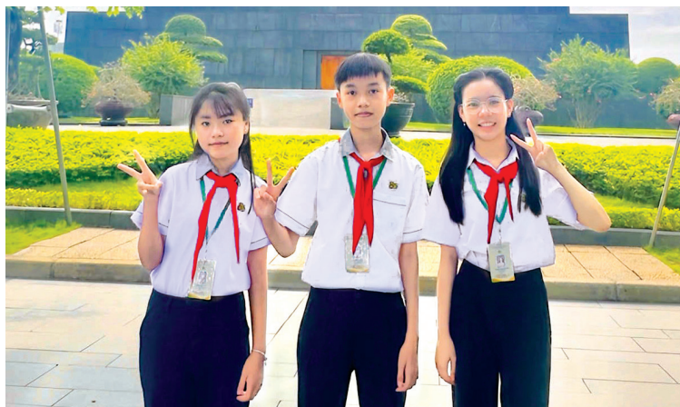
Ba đội viên tỉnh Quảng Trị được tuyên dương Giải thưởng Kim Đồng năm học 2025-2026