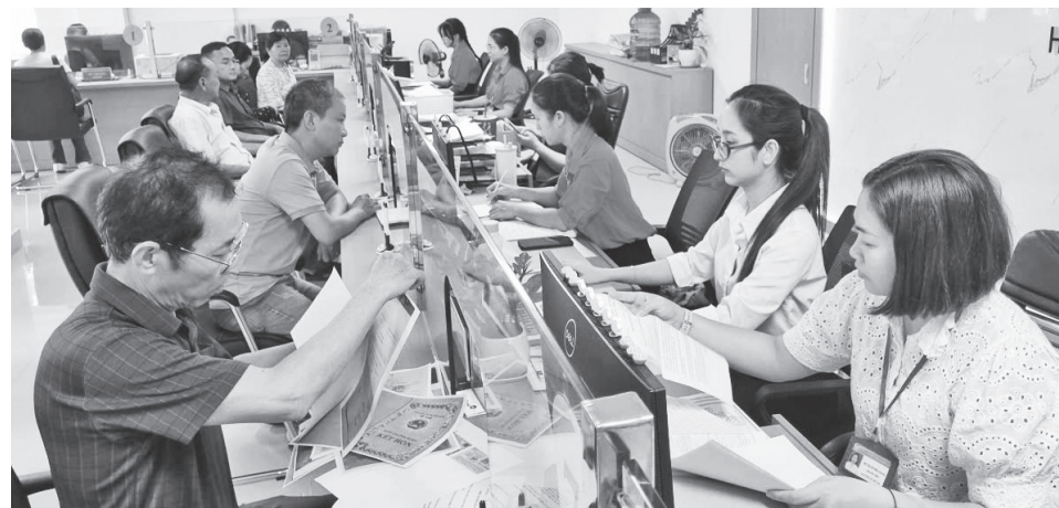
Hoạt động của Trung tâm Phục vụ hành chính công cấp xã mang đến sự thuận tiện cho người dân khi giải quyết thủ tục hành chính

Với địa bàn quản lý rộng (gần 300km 2 ), dân cư khá đông (hơn 33.400 người), xã Bồ Trạch xác định chuyển đổi số là "xương sống" để vận hành hoạt động và quản lý bộ máy chính