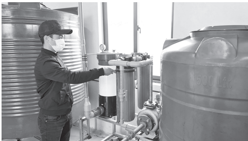
Nhiều doanh nghiệp, hợp tác xã ứng dụng công nghệ vào sản xuất, nâng cao chất lượng sản phẩm

Thông tin từ Sở Nông nghiệp và Môi trường cho biết, toàn tỉnh hiện có 100 hợp tác xã (HTX) ứng dụng công nghệ cao trong sản xuất; 195 HTX tham gia chuỗi liên kết sản xuất và tiêu thụ sản phẩm. Nhiều HTX đã ứng dụng công nghệ truy xuất nguồn gốc, từng bước xây dựng thương hiệu số và niềm tin cho người tiêu dùng.