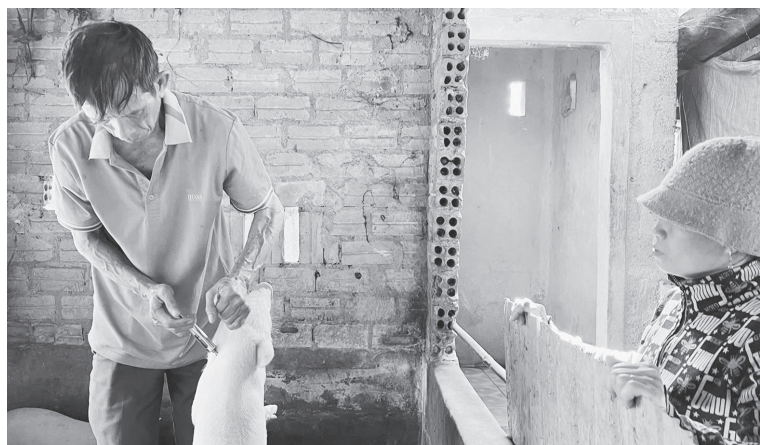
Cán bộ thú y xã Triệu Cơ tiêm phòng cho đàn lợn

Thực hiện kế hoạch của UBND xã Triệu Cơ về tiêm phòng vắc-xin cho đàn gia súc, gia cầm năm 2026, thời gian qua, Trung tâm Dịch vụ tổng hợp xã đã triển khai đồng bộ công tác tiêm phòng đợt 1 năm 2026. Việc đẩy mạnh tiêm phòng nhằm tạo miễn dịch chủ động, bảo vệ đàn vật nuôi trên địa bàn phát triển ổn định, bền vững.