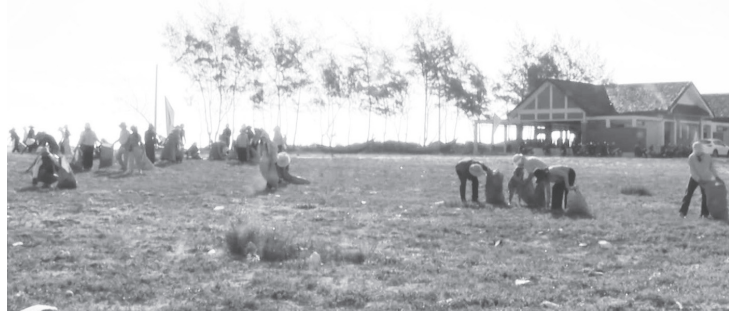
Đông đảo học sinh, giáo viên và người dân cùng thu gom rác ven biển