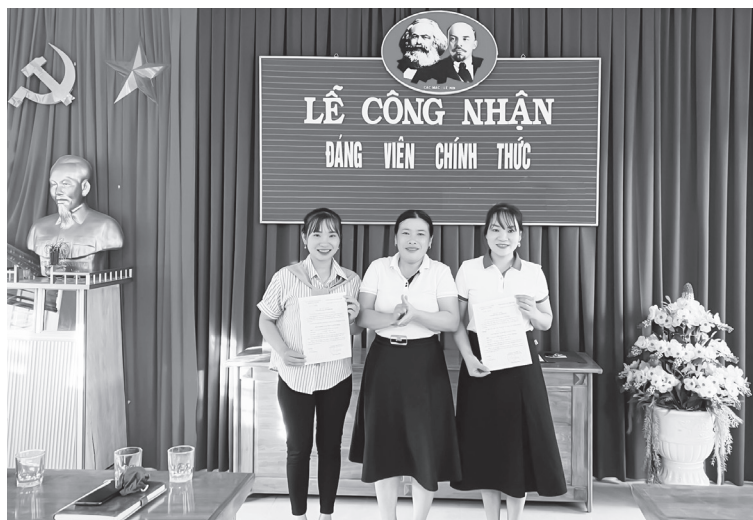
Lễ công nhận đảng viên chính thức tại Chi bộ Trường mầm non Trường Thủy

"Các tổ chức đoàn thể chính trị-xã hội đóng vai trò cầu nối quan trọng, không chỉ tập hợp hội viên mà còn tích cực phát hiện, giới thiệu quần chúng ưu tú cho Đảng. Việc giao chỉ tiêu phát triển đảng viên gắn với đánh giá chất lượng hoạt động của các đoàn thể đã tạo động lực rõ rệt, giúp công tác này đi vào