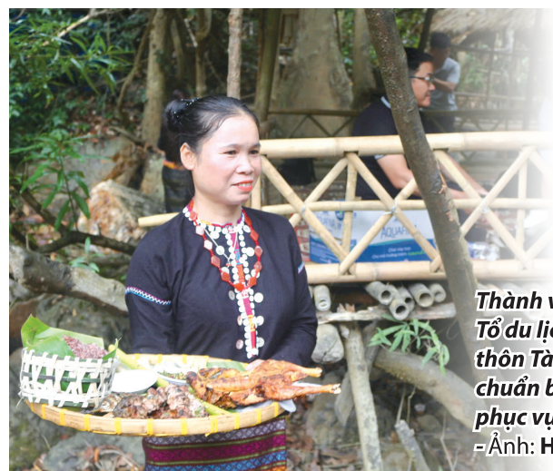
Thành viên Tổ du lịch cộng đồng thôn Tà Puồng chuẩn bị các món ăn phục vụ du khách

Vào dịp cuối tuần hoặc những ngày nghỉ lễ, điểm du lịch thác Tà Puồng đón hàng trăm lượt khách mỗi ngày, phần lớn là những người trẻ yêu thích khám phá, trải nghiệm thiên nhiên. Trong