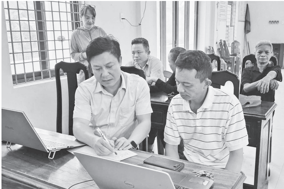
Cán bộ Trung tâm Phục vụ Hành chính công xã Tuyên Hóa hướng dẫn, giải quyết thủ tục hành chính cho người dân ngay tại cơ sở

Do vậy, Trung tâm PVHCC xã đã xây dựng và bước đầu triển khai thực hiện mô hình “Chính quyền lưu động vì Nhân dân phục vụ”, cử cán bộ về tận các thôn để giải quyết TTHC cho người dân, thể hiện sự chủ động phục vụ của chính quyền thay vì thụ động chờ dân đến. Qua đó mở rộng khả năng tiếp cận dịch vụ công cho mọi tầng lớp nhân dân, để không ai bị bỏ lại phía sau, góp phần xây dựng nền hành chính chuyên nghiệp, hiện đại, liêm chính, phát triển chính quyền số, xã