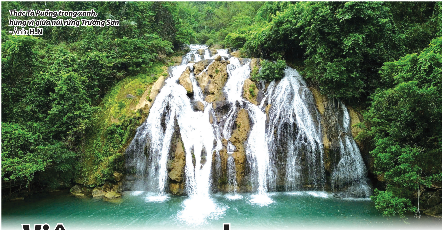
Thác Tà Puồng trong xanh, hùng vĩ giữa núi rừng Trường Sơn -Ảnh: H.N