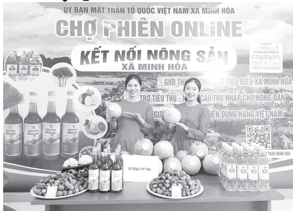
Các mặt hàng nông sản của người dân Minh Hóa được bày bán trên “Chợ phiên online”