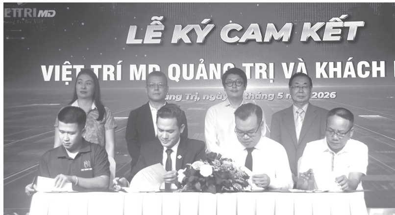
Các đơn vị, đối tác ký cam kết

Ngày 10/5/2026, chi nhánh Công ty CP Hợp tác đào tạo và phát triển nguồn nhân lực Việt Nam - Trung tâm Tư vấn du học Việt Trí MD tại Quảng Trị tổ chức hội thảo tư vấn du học và xuất khẩu lao động với chủ đề "Người Quảng Trị giúp người Quảng