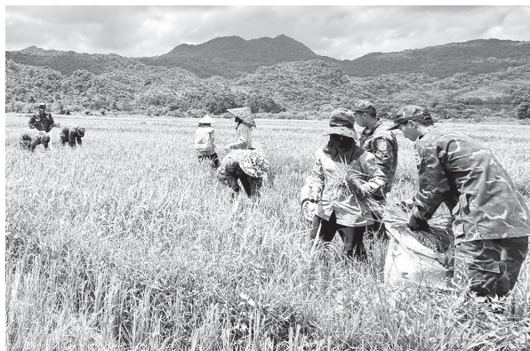
Lực lượng Đồn Biên phòng Hương Lập gặt lúa giúp dân trên cánh đồng biên giới xã Hương Lập

Trên tuyến biên giới biển, màu áo xanh của cán bộ, chiến sĩ Đồn Biên phòng Triệu Vân hòa chung màu vàng chín rộ trên cánh đồng thôn 7, xã Nam Cửa Việt. Trong điều kiện thời tiết nắng nóng, niềm vui của Nhân dân là sự động viên, khích lệ để cán bộ, chiến sĩ hoàn thành nhiệm vụ.