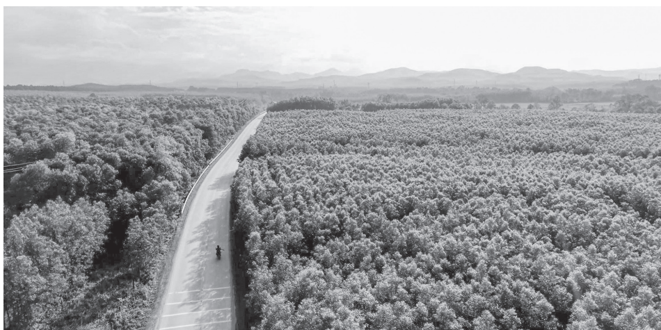
Kinh tế rừng ở xã Trường Phú giúp người dân thoát nghèo

Từ hiệu quả kinh tế mang lại, phong trào trồng rừng ở thôn Đông Xuân ngày càng phát triển mạnh. Nhiều hộ đầu tư mở rộng diện tích, đưa cơ giới vào khai thác, vận chuyển. Không ít gia đình xây được nhà mới, mua sắm phương tiện sản xuất, từng bước nâng cao