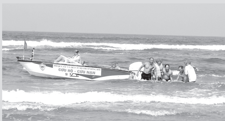
Tổ CHCN thường xuyên được tập huấn cứu nạn trên biển