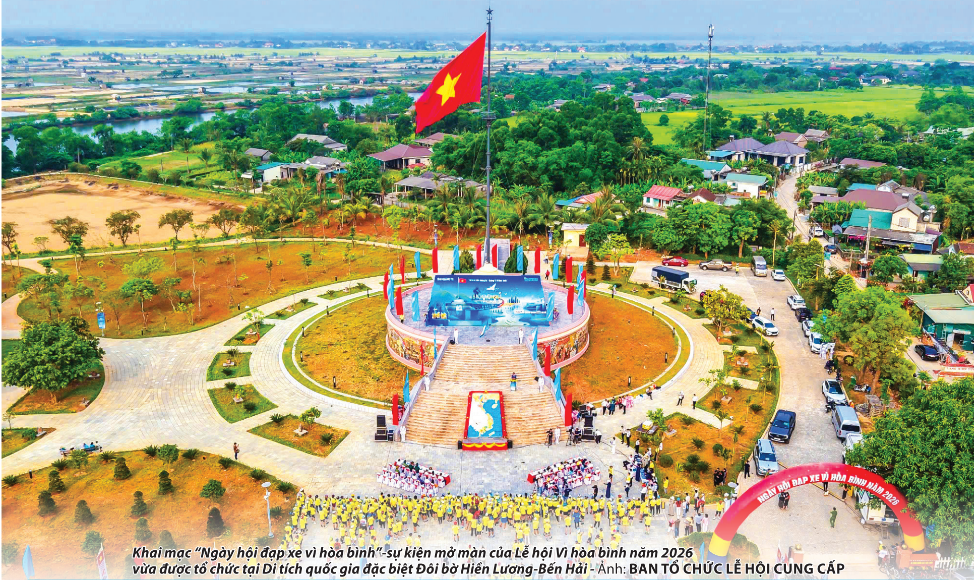
Khai mạc "Ngày hội đạp xe vì hòa bình"-sự kiện mở màn của Lễ hội Vì hòa bình năm 2026 vừa được tổ chức tại Di tích quốc gia đặc biệt Đồi bờ Hiền Lương-Bến Hải

Chuyến thăm đặc biệt của Tổng Bí thư Lê Duẩn