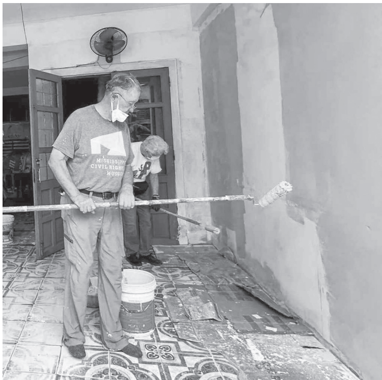
Thành viên nhóm UP giúp thay "màu áo mới" cho những bức tường tại xưởng sản xuất của Hội Người mù phường Đông Hà - Ảnh: Q.H

bó với các hoạt động hỗ trợ nạn nhân chiến tranh, ông Toàn đã gặp nhiều tổ chức, cá nhân hảo tâm đến từ nửa vòng trái đất. Tuy nhiên, không phải tổ chức, cá nhân nào cũng duy trì được một hành trình bền bỉ, đầy ý nghĩa như nhóm UP. "Chuyến đi vừa rồi đánh dấu cột mốc kỷ niệm 12