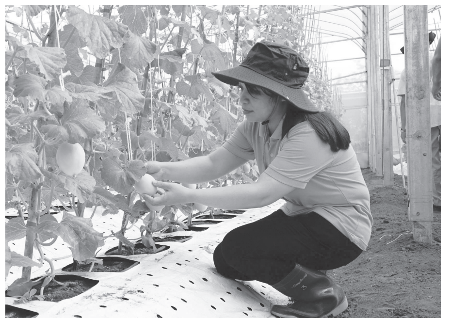
Sản phẩm dưa lưới của nông trại Dfarm được xuất sang thị trường nước ngoài