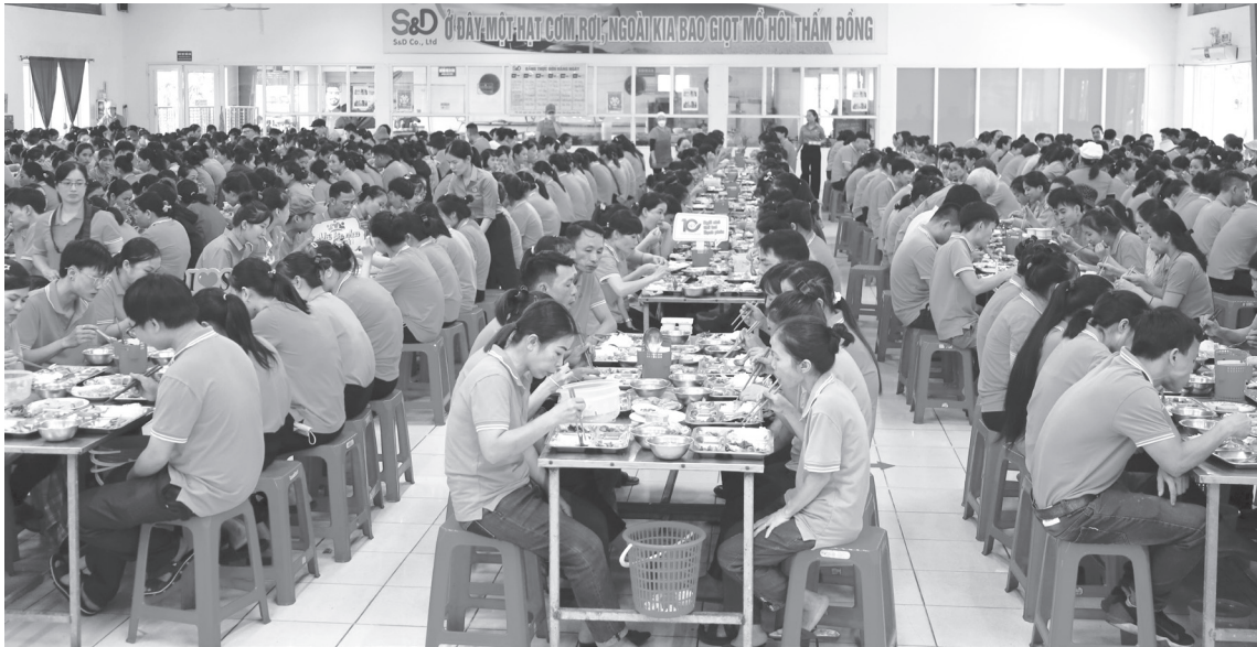
"Bữa cơm Công đoàn" trong không khí đoàn kết, gắn bó tại Công ty TNHH S&D Quảng Bình

và công trường, các hoạt động thiết thực được tổ chức, như: Tuyên truyền về ATVSLĐ, kiểm tra điều kiện làm việc, phát động các phong trào thi đua bảo đảm an toàn lao động, nâng cao hiệu quả sản xuất. Với mục tiêu ít nhất 70% doanh nghiệp lớn triển khai ít nhất một hoạt động hưởng ứng, Tháng hành động về ATVSLĐ và Tháng Công nhân năm 2026 không còn mang tính hình thức mà thực sự đi vào đời sống lao động.