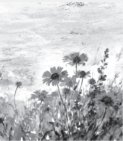
Minh họa: H.H