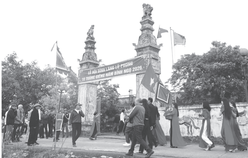
Với người dân nơi đây, đình Lũ Phong không chỉ là di tích mà trở thành một phần ký ức chung của cộng đồng

Bước vào kháng chiến chống Mỹ, vị trí của đình càng trở nên đặc biệt,