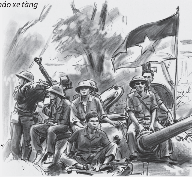
Minh họa: T.H

..... Thống nhất rồi, triệu triệu người, một trái tim.