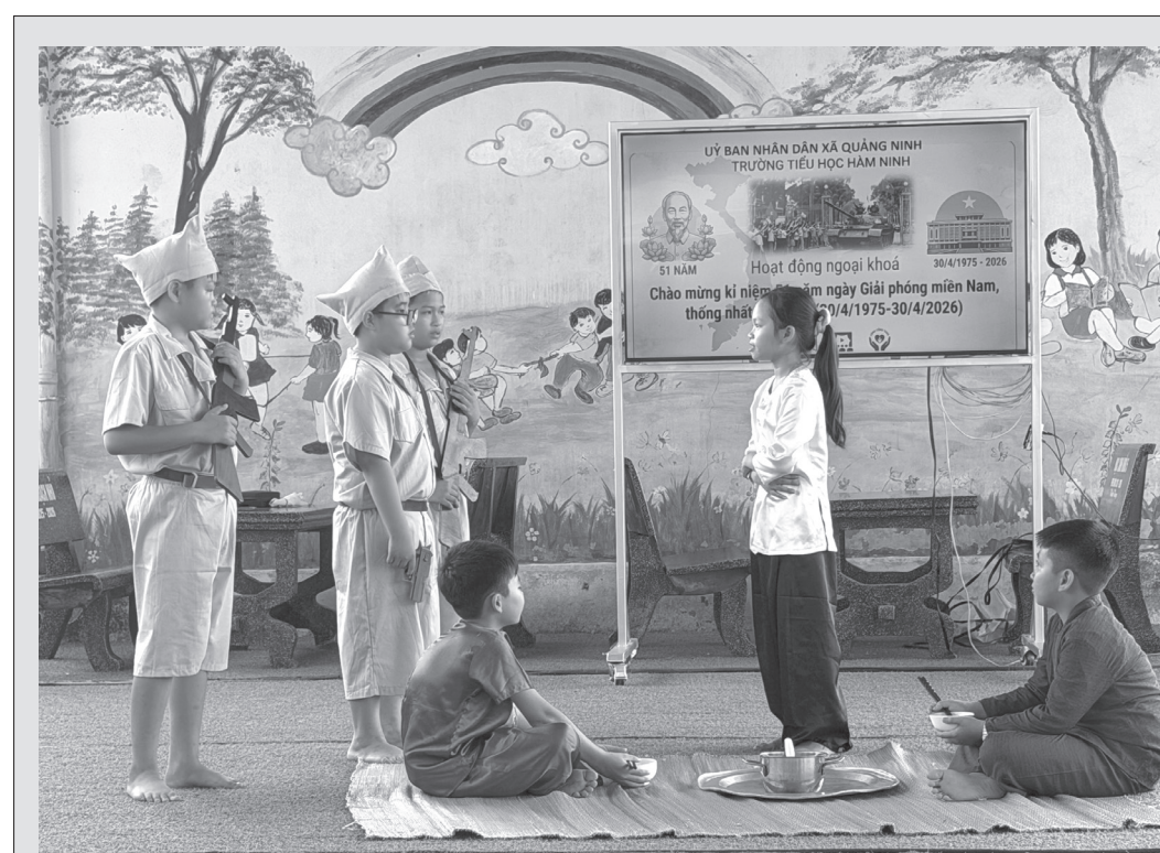
Học sinh Trường tiểu học Hàm Ninh hào hứng với các hoạt động trải nghiệm khi học môn Lịch sử

Hoạt động giáo dục lịch sử và đạo đức cách mạng trong các trường học không chỉ diễn ra vào những dịp cao điểm, những ngày lễ lớn của dân tộc mà còn được duy trì thường xuyên với nhiều chương trình cụ thể, thiết thực. Qua từng bài giảng đổi mới, những chuyến tham quan di tích hay các hoạt động nghĩa tình..., những bài học lịch sử trở nên gần gũi hơn với học sinh. Từ đó, tiếp thêm động lực cho mỗi học sinh trong học tập, rèn luyện để trở thành những công dân có trách nhiệm, biết trân trọng quá khứ và nỗ lực đóng góp cho quê hương, đất nước.