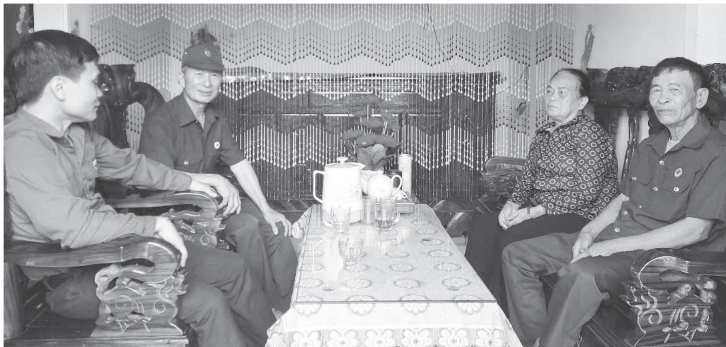
Ký ức thanh xuân không thể nào quên với những cựu chiến binh tham gia chiến đấu, phục vụ chiến đấu tại Bến phà Gianh