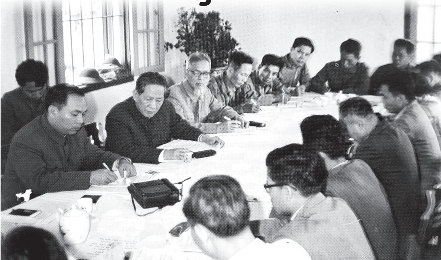
Đồng chí Lê Duẩn (thứ 2 từ trái sang) làm việc với Tỉnh ủy Quảng Bình, tháng 2/1973

Những ngày đầu năm mới thiêng liêng của Tết Quý Sửu cách đây tròn 53 năm, chỉ cách đó vài ngày khi Hiệp định Paris vừa được ký kết, có một vị khách đặc biệt đã “xông đất” mảnh đất gánh trọn bao bom đạn của kẻ thù. Chuyến thăm lịch sử mang đến bao niềm tin, hy vọng cho thời kỳ hòa bình mới của lịch sử dân tộc và cho thấy sự quan tâm, chăm lo của Đảng, Nhà nước dành cho tỉnh Quảng Bình lúc bấy giờ. Đó là chuyến thăm của Tổng Bí thư Lê Duẩn (thời điểm đó là Bí thư thứ nhất Ban Chấp hành Trung ương Đảng Lao động Việt Nam).