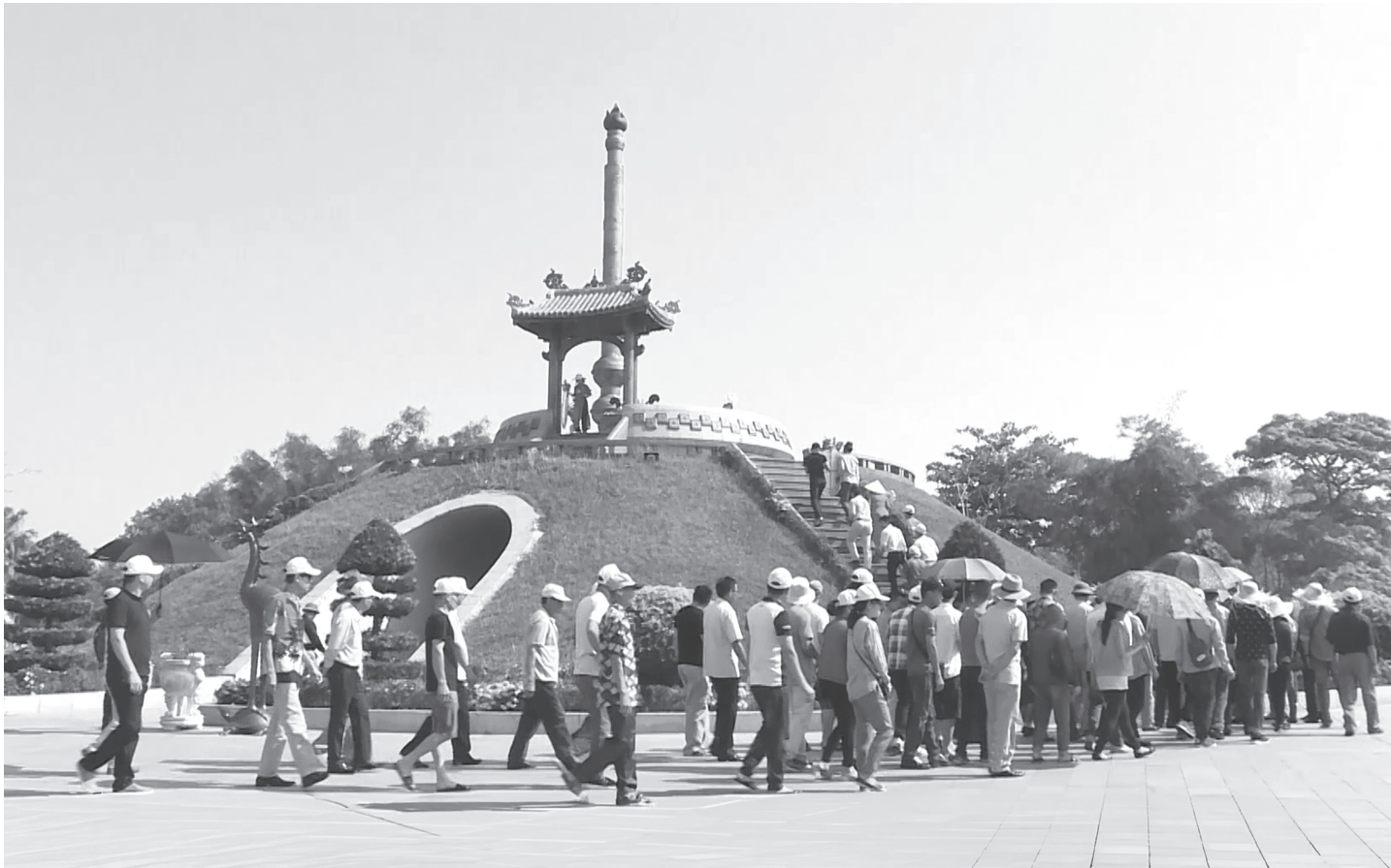
Du khách dâng hoa tri ân các anh hùng liệt sỹ tại Thành Cổ Quảng Trị