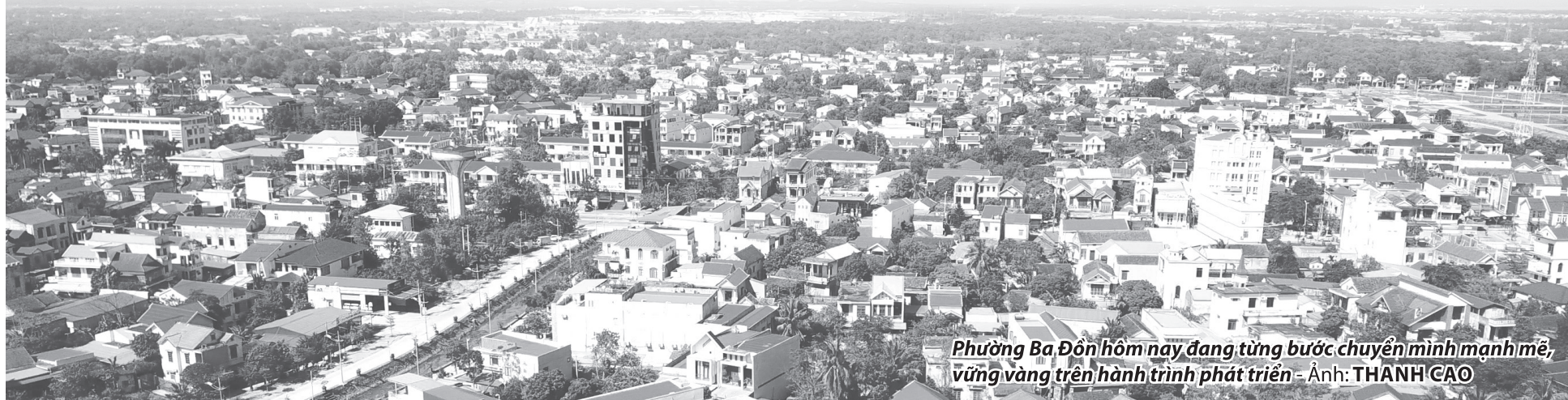
Phường Ba Đồn hôm nay đang từng bước chuyển mình mạnh mẽ, vững vàng trên hành trình phát triển

Lũ Phong (phường Ba Đồn) là vùng đất ghi dấu những năm tháng lịch sử đặc biệt, nơi khởi nguồn của phong trào cách mạng ở huyện Quảng Trạch trước đây. Hôm nay, giữa nhịp sống đổi thay, những giá trị trong quá khứ vẫn hiện diện, trở thành nền tảng cho sự phát triển của địa phương.