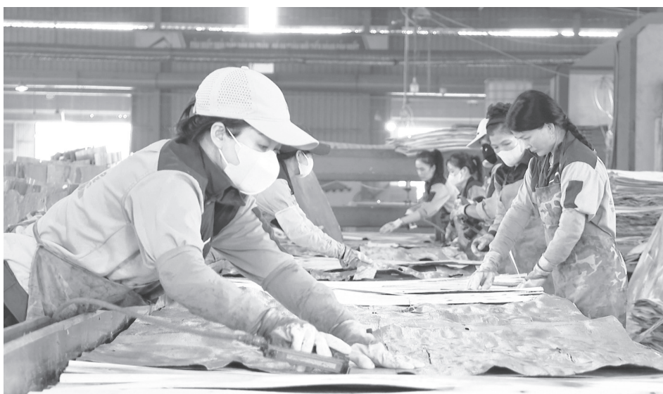
Không khí thi đua lao động sản xuất tại Công ty CP Việt Trung Quảng Bình