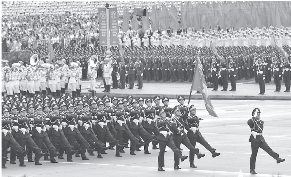
Diễu binh, diễu hành trong Lễ kỷ niệm 80 năm Cách mạng Tháng Tám thành công và Quốc khánh nước Cộng hòa xã hội chủ nghĩa Việt Nam, ngày 2/9/2025.

Đại thắng mùa Xuân 1975 là một trong những mốc son chói lọi nhất lịch sử dân tộc Việt Nam, không chỉ bởi đã hoàn thành trọn vẹn sự nghiệp giải phóng miền Nam, thống nhất đất nước mà còn bởi đó là sự kết tinh rực rỡ của toàn bộ sức mạnh dân tộc được hun đúc qua hàng nghìn năm lịch sử và được nâng lên tầm cao mới trong thời đại Hồ Chí Minh.