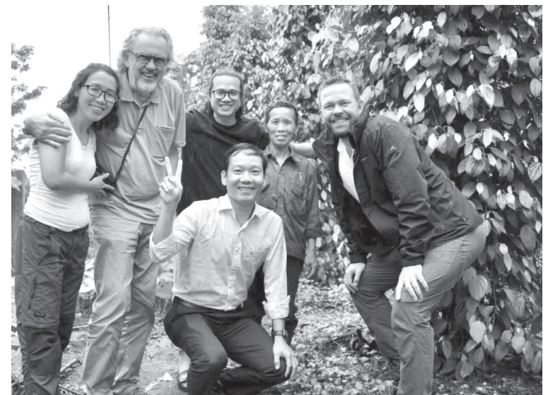
Các đối tác nước ngoài khảo sát mô hình sản xuất hồ tiêu hữu cơ tại xã Cồn Tiên

Giữa không gian của một trong những hội chợ thực phẩm hữu cơ lớn nhất thế giới, sự hiện diện của sản phẩm hồ tiêu hữu cơ Quảng Trị đã mang lại niềm tự hào cho nhiều người. Bởi đó như là một lời khẳng định mạnh mẽ về chất lượng, niềm tin và khát vọng vươn ra thế giới của nông sản Việt. “Hồ tiêu hữu cơ Quảng Trị 81 không đơn thuần là một sản phẩm gia vị, đó là một câu chuyện dài và xúc động, kết nối quá khứ bi hùng, hiện tại nỗ lực và tương lai bền vững của người nông dân làm nông nghiệp tử tế. Đây là kết quả của hành trình miệt mài, kiên trì và đầy tâm huyết