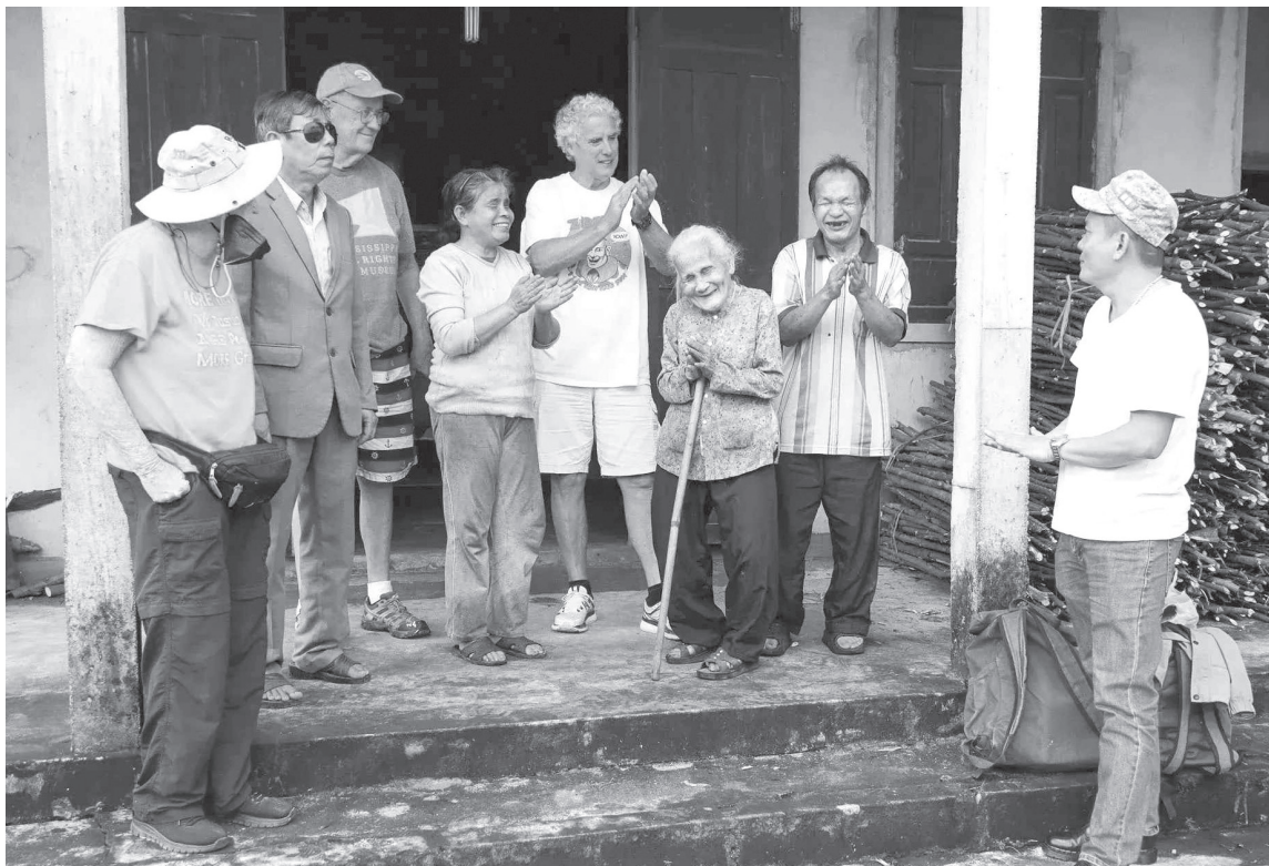
Nhóm UP chia sẻ niềm vui với mẹ con bà Thứ sau khi giúp gia đình lợp mái nhà

Chiến tranh đã lùi xa hơn nửa thế kỷ, nhưng những đau thương, mất mát vẫn còn in sâu dưới lòng đất, trong hình hài con người và cả ký ức chưa nguôi... Từ nước Mỹ xa xôi, 12 năm qua, nhóm Unlimited Possibilities (UP) đã vượt mọi khoảng cách, bèn bi đến Quảng Trị, cùng sơn nhà, lợp mái tôn, trao gửi những món quà... với mong muốn cùng người dân nơi đây viết tiếp những trang đời mới, đong đầy tình hữu nghị và sự tử tế.