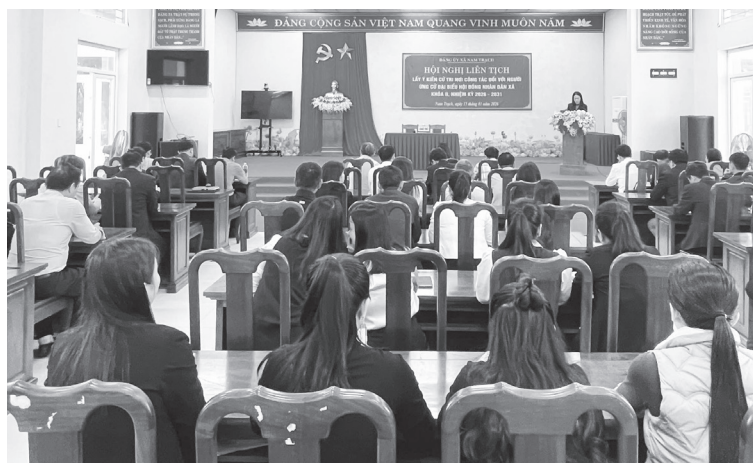
Hội nghị lấy ý kiến cử tri nơi công tác đối với ứng cử viên đại biểu HĐND xã Nam Trạch, nhiệm kỳ 2026-2031

Báo cáo của Ban Thường trực Ủy ban MTTQVN tỉnh nêu rõ, trong quý I/2026, công tác tuyên truyền