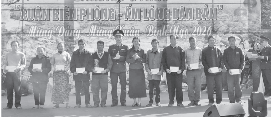
Cấp ủy, chính quyền, Ủy ban MTTQVN xã Thượng Trạch phối hợp với Đồn Biên phòng Cửa Roàng và Đồn Biên phòng Cà Roàng tổ chức chương trình "Xuân Biên phòng - Ấm lòng dân bản" năm 2026

Thời gian qua, các cuộc vận động và phong trào thi đua yêu nước do Ủy ban Mặt trận Tổ quốc Việt Nam (MTTQVN) các cấp trong tỉnh triển khai đã mang lại nhiều kết quả cụ thể, góp phần thực hiện tốt việc chăm lo đời sống Nhân dân trên địa bàn.