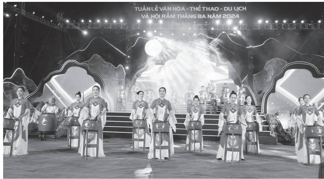
Một tiết mục biểu diễn tại sự kiện Tuần lễ Văn hóa-Thể thao-Du lịch và Hội Rằm tháng Ba Minh Hóa năm 2024

● P.V: Huyện Minh Hóa (cũ) trước đây, nay là địa bàn của 5 xã Kim Phú, Kim Điền, Tân Thành, Dân Hóa và Minh Hóa là vùng đất giàu truyền thống cách mạng và nơi lưu giữ, hội tụ những giá trị di sản văn hóa đặc sắc của các dân tộc anh em sinh sống trên địa bàn. Vậy, nét đặc đáo trong những di sản văn hóa, lễ hội đó là gì, thưa ông?