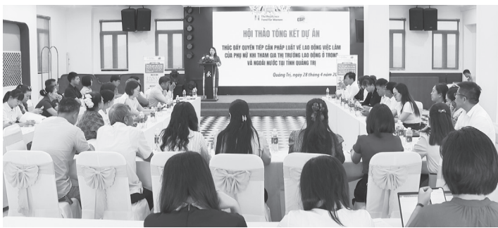
Quang cảnh hội thảo

Tại hội thảo, các đại biểu đã chia sẻ kết quả, bài học kinh nghiệm, đồng thời đề xuất giải pháp duy trì tính bền vững của