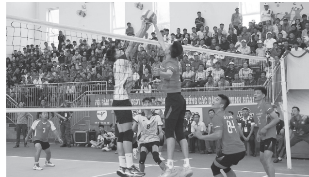
Giải đấu năm nay có sự tham gia của 5 đội bóng đến từ 5 địa phương

Tuần lễ Văn hóa-Thể thao-Du lịch và Hội Rằm tháng Ba Minh Hóa năm 2026 được tổ chức từ ngày 26/4-1/5/2026 (từ ngày 10/3-15/3 âm lịch) với nhiều hoạt động văn hóa, văn nghệ, thể dục, thể thao phong phú, hấp dẫn, gồm: Nghi thức truyền thống dâng hương tại thác Bụt; thi đấu bóng chuyền nam, nữ; tổ chức các môn thể thao truyền thống và trò chơi dân gian bắn nỏ, kéo co, đẩy gậy, đánh đu, đi cà kheo, ném xoang; hội chợ Rằm truyền thống; trải nghiệm không gian văn hóa ẩm thực... Đặc biệt, vào đêm 30/4 sẽ diễn ra chương trình nghệ thuật đặc biệt "Minh Hóa-Âm vang Hội Rằm tháng Ba".