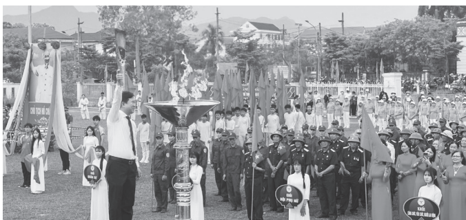
Lãnh đạo phường Đồng Sơn thấp đuốc truyền thống

Đại hội TDTT phường Đồng Sơn lần thứ I thu hút hơn 1.000 vận động viên tham gia tranh tài ở 7 môn thi đấu. Đến thời điểm hiện tại, đại hội đã hoàn thành 6 môn, gồm: Bóng bàn, cờ tướng, cầu lông, việt dã, kéo co và pickleball với tổng cộng 62 bộ huy chương được trao. Môn bóng đá nam là nội dung thi đấu cuối cùng, hứa hẹn mang đến những trận đấu sôi nổi, góp phần tạo nên thành công trọn vẹn cho đại hội. Thông qua đại hội, các tổ dân phố và vận động viên trên địa bàn có cơ hội giao lưu, học hỏi, nâng cao trình độ, tăng cường tinh thần đoàn kết; đồng thời là dịp để tuyển chọn những vận động viên xuất sắc tham gia các giải đấu cấp trên.