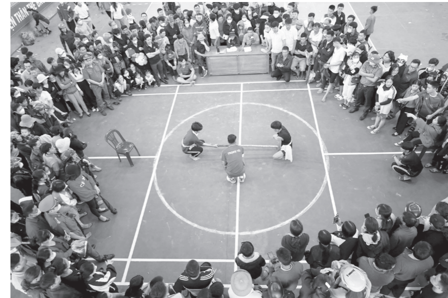
Nhiều môn thể thao truyền thống và trò chơi dân gian được duy trì tổ chức tại Tuần lễ Văn hóa-Thể thao-Du lịch và Hội Rằm tháng Ba Minh Hóa hàng năm

Trải qua hàng trăm năm phát triển, người dân huyện Minh Hóa (cũ), nay là địa bàn của 5 xã: Kim Phú, Kim Điền, Tân Thành, Dân Hóa và Minh Hóa vẫn lưu giữ được những nét đẹp văn hóa độc đáo riêng có của mình. Họ tự hào vì ít vùng đất nào sở hữu quốc gia như quê hương mình.