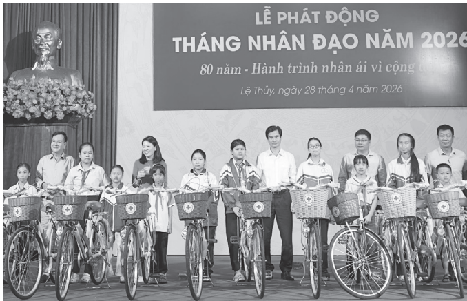
Hội Doanh nghiệp tỉnh trao tặng xe đạp cho các em học sinh có hoàn cảnh khó khăn

Hưởng ứng Tháng Nhân đạo năm 2026, tại buổi lễ, nhiều đơn vị, cá nhân hảo tâm đã đồng hành với Hội CTĐ tỉnh để hỗ trợ các hoàn cảnh khó khăn bằng nhiều hình thức thiết thực. Trong đó, Báo Vietnamnet phối hợp với Hội CTĐ tỉnh