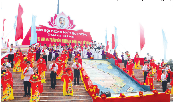
Tổng duyệt tiết mục văn nghệ tại chương trình