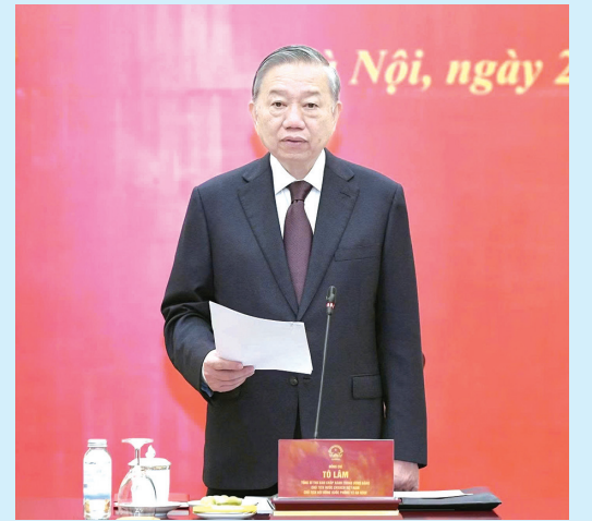
Tổng Bí thư, Chủ tịch nước Tô Lâm phát biểu tại phiên họp thứ nhất Hội đồng Quốc phòng và An ninh nhiệm kỳ 2026-2031