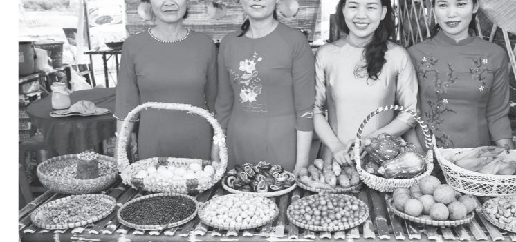
Nhiều sản vật đặc trưng của địa phương được bày bán giới thiệu tại Chợ Rằm tháng Ba Minh Hóa

Ông Định kể, lúc đó đất nước bị chiến tranh, mọi sinh hoạt của cuộc sống đời thường bị đảo lộn hoàn toàn. Thế hệ trẻ như ông phải sinh sống, học tập dưới hầm, nên những câu chuyện về huyền tích Hội Rằm, thác Bụt, ông chủ yếu