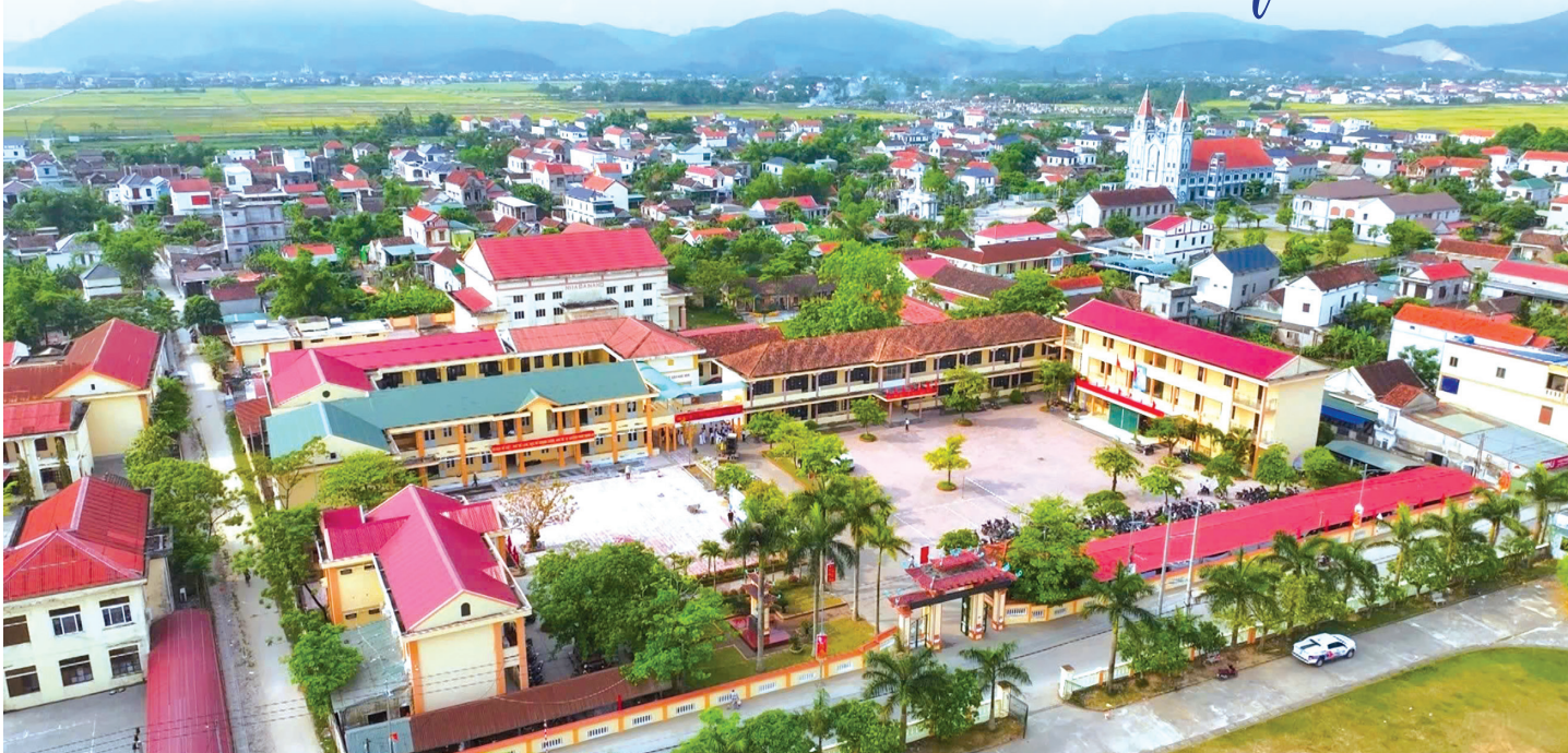
Trường THPT Lê Hồng Phong với diện mạo khang trang, hiện đại

Bí thư Đảng ủy, Hiệu trưởng Trường THPT Lê Hồng Phong