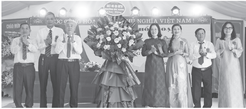
Lãnh đạo phường Bắc Gianh tặng hoa chúc mừng kỷ niệm 555 năm thành lập làng Thổ Ngọa