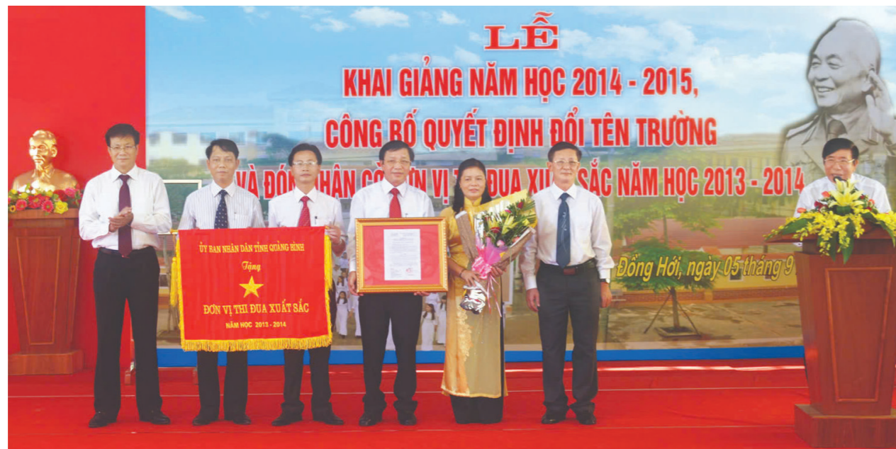
Lễ công bố quyết định đổi tên trường thành Trường THPT chuyên Võ Nguyễn Giáp

Để thực hiện nhiệm vụ bồi dưỡng nhân tài cho quê hương, đất nước, Trường THPT chuyên Võ Nguyễn Giáp (tiền thân là Trường Năng khiếu tỉnh Quảng Bình) được thành lập ngày 11/7/1996 theo Quyết định số 710-QĐ/UB của UBND tỉnh. 30 năm qua, cùng với quá trình hình thành và phát triển, nhà trường đã từng bước khẳng định vị thế là địa chỉ hàng đầu trong đào tạo, bồi dưỡng học sinh năng khiếu, kiến tri vun đắp tri thức và nuôi dưỡng khát vọng vươn lên cho nhiều thế hệ học sinh.