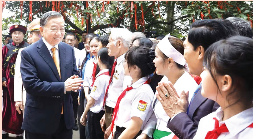
Tổng Bí thư, Chủ tịch nước Tô Lâm với các tầng lớp nhân dân tại Khu di tích lịch sử quốc gia đặc biệt Đền Hùng

Sáng 26/4/2026 (tức 10/3 năm Bính Ngọ), tại Khu di tích lịch sử quốc gia đặc biệt Đền Hùng, Phú Thọ, Đảng bộ, chính quyền, Nhân dân tỉnh Phú Thọ long trọng tổ chức Lễ dâng hương Giỗ Tổ Hùng Vương. Tổng Bí thư, Chủ tịch nước Tô Lâm dự lễ và dâng hương