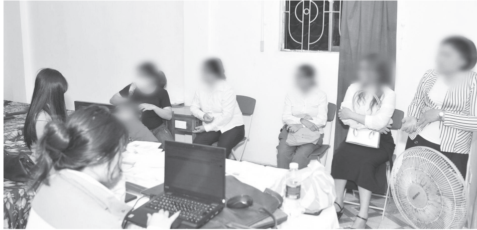
Nhóm “Hội thánh Đức Chúa Trời Mẹ” hoạt động trái phép tại Quảng Trị vừa bị lực lượng chức năng đấu tranh, xử lý vào ngày 1/4/2026

Không chỉ hoạt động tinh vi, khó kiểm soát, các đối tượng cầm đầu, trưởng nhóm trong “Hội thánh Đức Chúa Trời Mẹ” tại tỉnh Quảng Trị còn sử dụng các kịch bản do “tổng hội” ở nước ngoài xây dựng, phát hành để lôi kéo người dân tham gia một cách bài bản, có hệ thống. Điều này khiến nhiều người khi bị tiếp cận dễ rơi vào trạng thái bị thao túng tâm lý, mất dần khả năng kiểm soát hành vi và nhận thức.