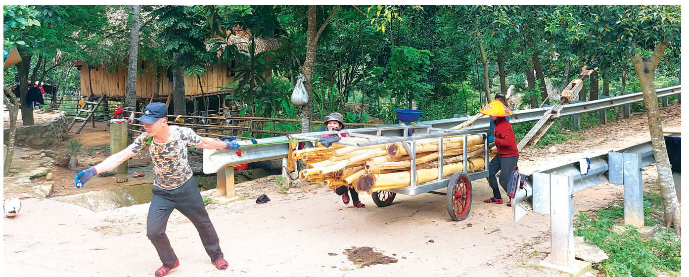
Người dân xã Dân Hóa dùng xe cải tiến vận chuyển keo về nơi tập kết