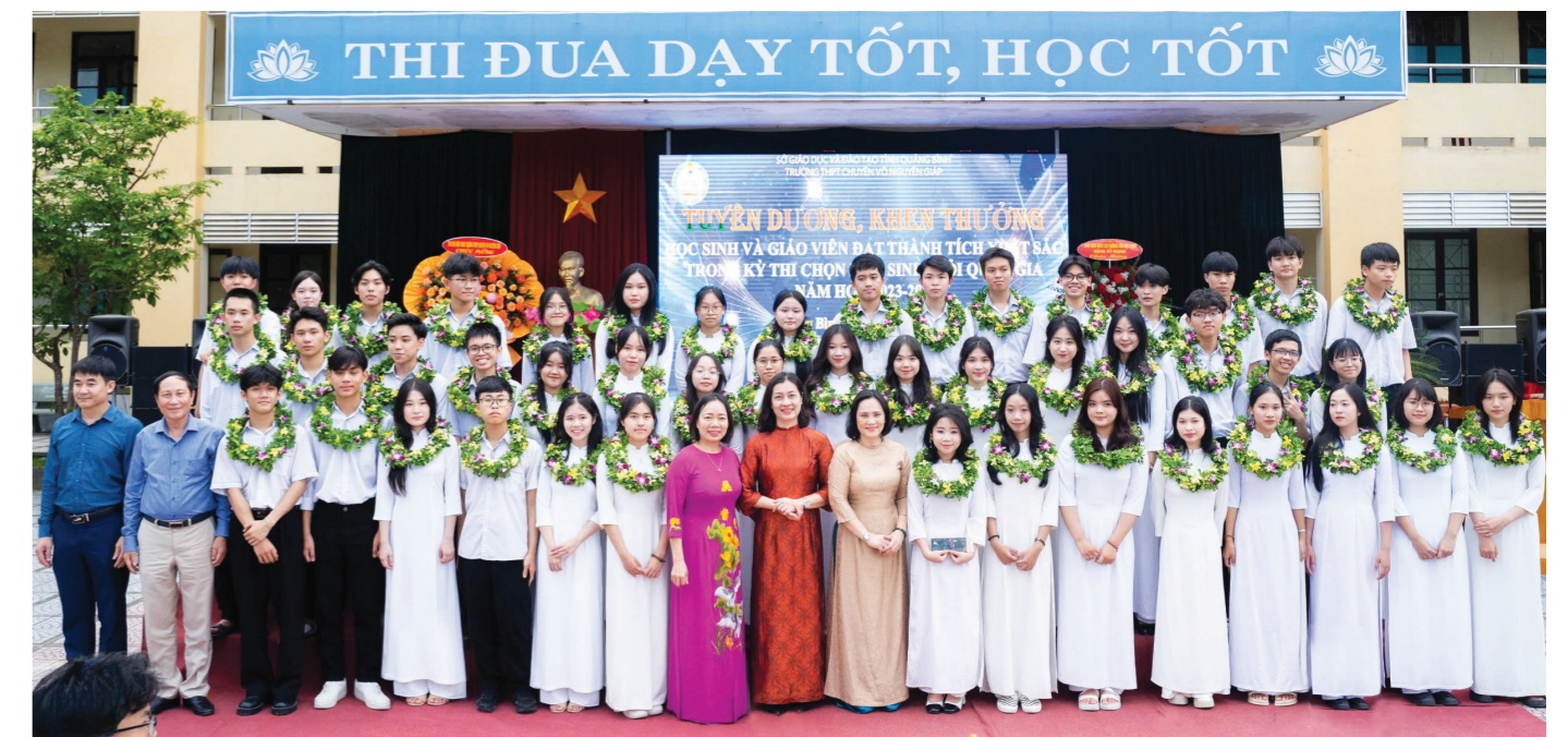
Tuyên dương, khen thưởng học sinh và giáo viên đạt thành tích xuất sắc trong kỳ thi chọn học sinh giỏi quốc gia, năm học 2023-2024

Phía sau những con số ấn tượng về giải thưởng quốc gia và quốc tế là hành trình thầm lặng của những người “gieo hạt”. Tại ngôi trường mang tên vị Đại tướng lừng danh, mỗi “mùa vàng” rạng rỡ không dừng lại ở những tấm huy chương. Đó là kết tinh từ nếp học bền bỉ cùng tâm huyết của bao thế hệ thầy trò nhằm biến áp lực thành động lực để chạm đến vinh quang.