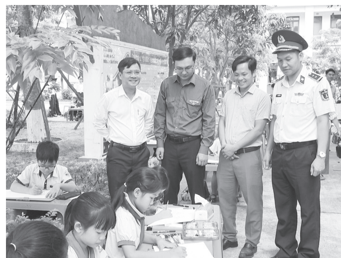
Ban Tổ chức chương trình động viên học sinh tham gia cuộc thi