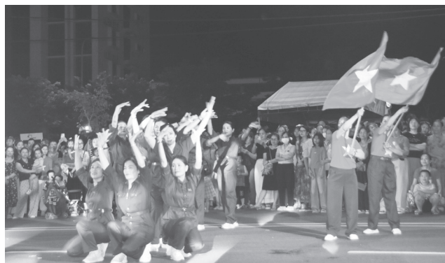
Các tiết mục dân vũ thu hút đông đảo người xem

Đây là lần đầu tiên chuỗi hoạt động tri ân, văn hóa cộng đồng được địa phương tổ chức quy mô, bài bản, với các hoạt động ý nghĩa, như: Lễ dâng hoa, dâng hương, thả hoa đăng trên sông Hiếu tri ân các anh hùng liệt sĩ; bài trí không gian âm thực truyền thống với hơn 60 gian hàng ẩm thực đặc trưng của địa phương và các sản phẩm OCOP; chương trình văn nghệ với chủ đề "Vang mãi bản hùng ca non sông"; các hoạt động nghệ thuật đường phố, trình diễn áo dài truyền thống; giao lưu dân vũ, khiêu vũ, âm nhạc cộng đồng và đốt lửa sinh hoạt truyền thống... Tất cả các hoạt động sôi nổi trên đã tạo nên một không gian văn hóa cộng đồng đặc sắc, hấp dẫn, mang đậm dấu ấn của quê hương Đông Hà.