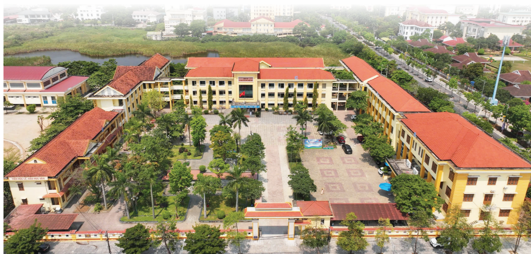
Sau 30 năm xây dựng và trưởng thành, Trường THPT chuyên Võ Nguyễn Giáp đã trở thành một cơ sở giáo dục bề thế, khang trang