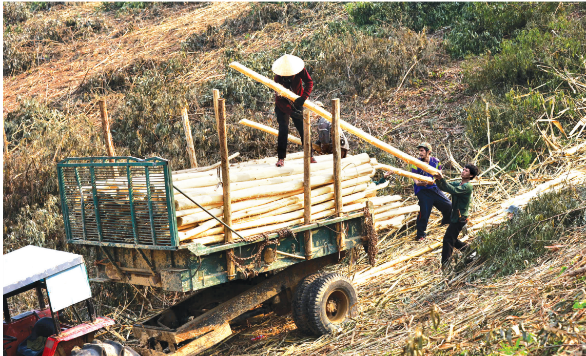
Khai thác keo ở xã Kim Ngân

Tuy vậy, theo những người làm nghề lâu năm, một chu trình khai thác keo không hề nhẹ nhàng. Từ việc phát dọn, cắt hạ cây bằng cưa xăng, đến phân khúc, bóc vỏ, rồi vận chuyển từng thân gỗ nặng hàng chục kg ra bãi tập kết. Ở khu rừng gần đường, việc vận chuyển đỡ vất vả, nhưng với những lô keo nằm ở địa hình hiểm trở, không có đường, công việc khai thác hoàn toàn bằng sức người.