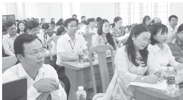
Các đại biểu dự lễ khai mạc