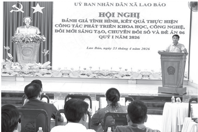
Quang cảnh hội nghị