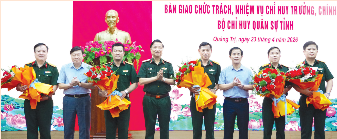
BÀN GIAO CHỨC TRÁCH, NHIỆM VỤ CHỈ HUY TRƯỞNG, CHÍNH BỘ CHỈ HUY QUÂN SỰ TỈNH Quảng Trị, ngày 23 tháng 4 năm 2026

Chiều 23/4/2026, Bộ Chỉ huy Quân sự (CHQS) tỉnh tổ chức hội nghị bàn giao chức vụ Chỉ huy trưởng, Chính ủy Bộ CHQS tỉnh.