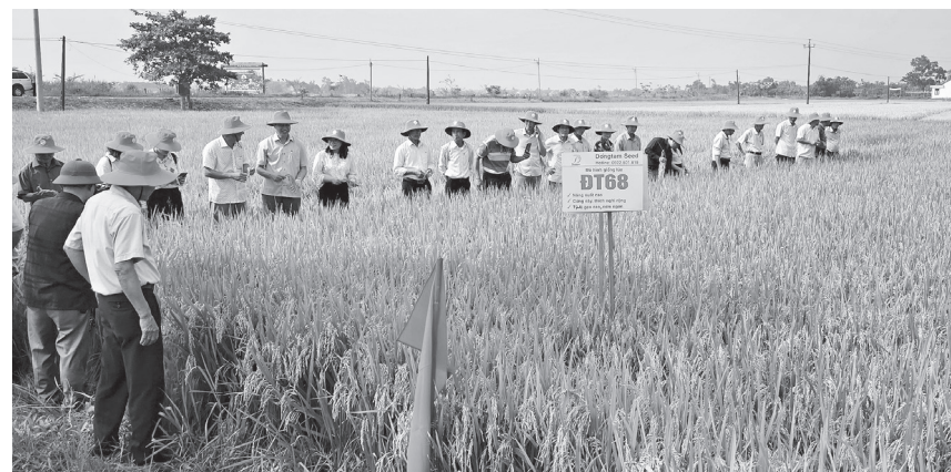
Các đại biểu tham quan mô hình khảo nghiệm giống lúa thuần ĐT68 tại Hợp tác xã Bích La, xã Triệu Phong

Qua thực tế sản xuất tại mô hình, giống lúa ĐT68 có thời gian sinh trưởng khoảng 110 ngày, trổ tập trung trong khoảng 4-5 ngày; số hạt chắc/bông đạt từ 150-170 hạt/bông. Năng suất thực thu dự kiến đạt 83,97 tạ/ha, cao hơn so với giống đối chứng HG12 20 tạ/ha. Đặc biệt, một số hộ đầu tư thâm canh tốt, bón phân cân đối, năng suất có thể đạt trên 90 tạ/ha.