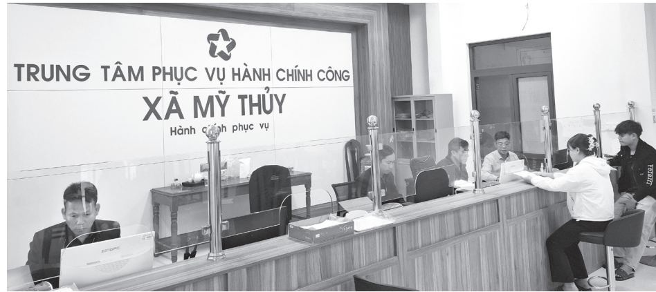
Ủy ban MTTQVN xã thường xuyên giám sát về giải quyết thủ tục hành chính cho người dân tại Trung tâm Phục vụ hành chính công xã Mỹ Thủy