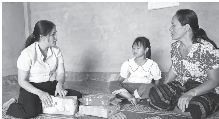
Một trường hợp trẻ mồ côi tại bản Khe Khế được Hội Liên hiệp Phụ nữ xã Kim Ngân nhận đỡ đầu