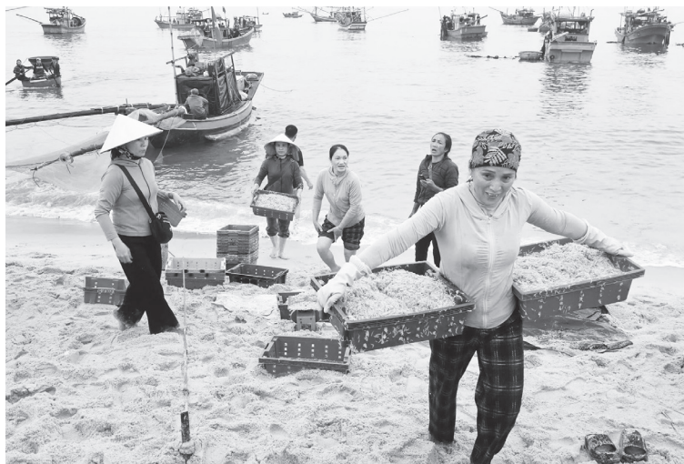
Thương lái thu mua hải sản của ngư dân ngay tại bãi biển xã Nam Trạch

Tại xã Ninh Châu, hàng trăm ngư dân cũng đang nhộn nhịp giương thuyền ra khơi khai thác