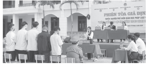
“Phiên tòa giả định” giúp đoàn viên, thanh niên nâng cao kiến thức pháp luật