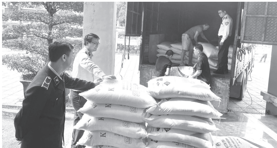
Lực lượng Quản lý thị trường thực thi công tác chống buôn lậu và gian lận thương mại trên các địa bàn dọc Quốc lộ 9

Ngoài ra, Đội QLTT số 8 đã tổ chức kiểm tra 41 vụ, với tổng số tiền xử phạt vi phạm hành chính (VPHC) và trị giá