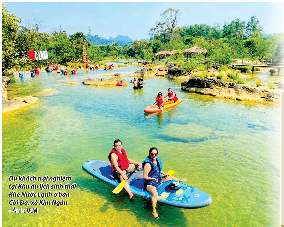
Du khách trải nghiệm tại Khu du lịch sinh thái Khe Nước Lạnh ở bản Còi Đá, xã Kim Ngân