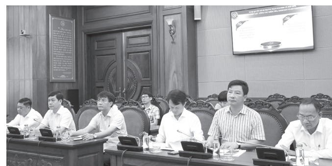
Các đại biểu tham dự hội nghị tại điểm cầu tỉnh Quảng Trị