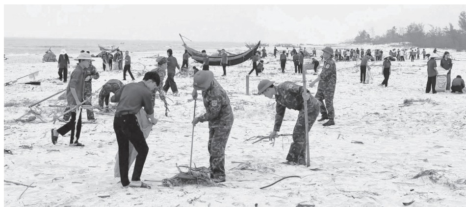
Đoàn viên, thanh niên tham gia vệ sinh môi trường

Cùng với đó, các hoạt động xung kích BVMT ứng phó với biến đổi khí hậu được