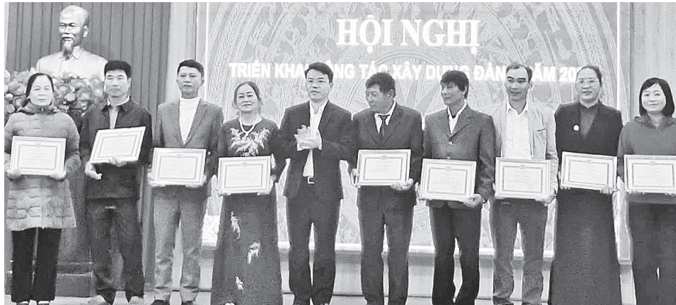
Đảng bộ xã Lệ Thủy khen thưởng những cá nhân đạt thành tích xuất sắc trong công tác xây dựng Đảng năm 2025

Nhờ sự phối hợp chặt chẽ giữa lực lượng Công an, Quân sự và các chi bộ thôn, những tháng đầu năm 2026, tình hình an ninh trật tự trên địa bàn xã Lệ Thủy tiếp tục được giữ vững. Phong trào "Toàn dân bảo vệ an ninh Tổ quốc" lan tỏa sâu rộng, phát huy hiệu quả trong công tác phòng ngừa, đấu tranh với các loại tội phạm và tệ nạn xã hội, góp phần giữ vững ổn định địa bàn.