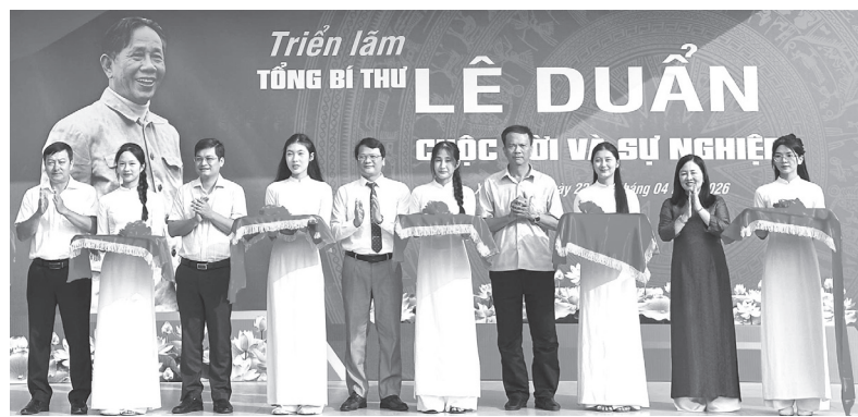
Các đại biểu cắt băng khai mạc triển lãm ảnh “Tổng Bí thư Lê Duẩn - Cuộc đời và sự nghiệp”