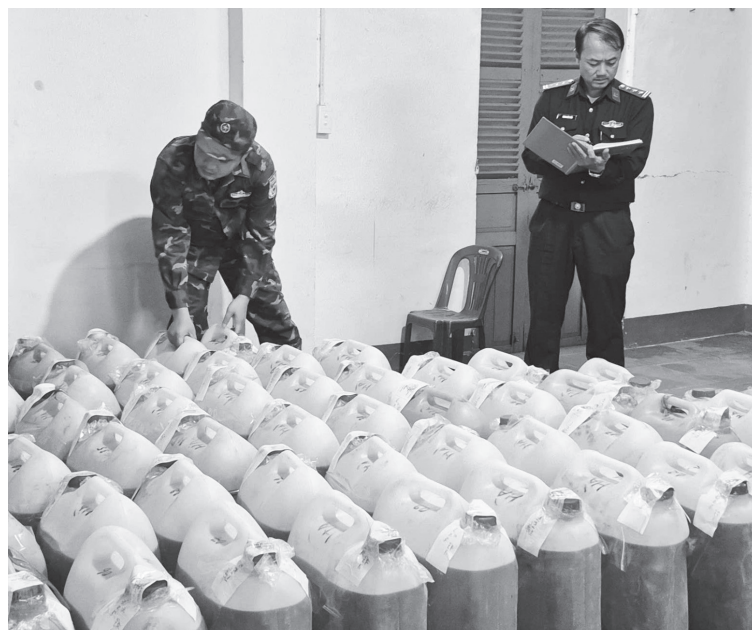
Lực lượng Biên phòng kiểm đếm tang vật là các can xăng dầu lậu được tập kết trái phép trên địa bàn xã Lao Bảo