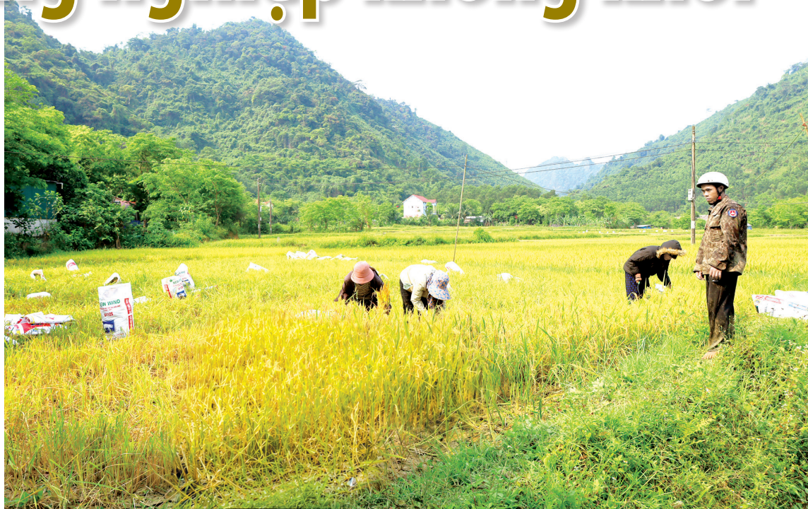
Người dân bản Còi Đá, xã Kim Ngân phát triển trồng trọt, cung cấp thực phẩm sạch cho các cơ sở du lịch trên địa bàn

Với vị trí địa lý thuận lợi ở phía đầu nguồn của hồ chứa nước Rào Đá, bản Còi Đá nằm khuất sâu trong tán rừng già hoang sơ của dãy Trường