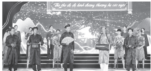
Huyện Minh Hóa (cũ) là quê hương của nhiều di sản truyền thống đặc sắc