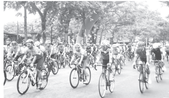
Các vận động viên chính thức xuất phát thi đấu