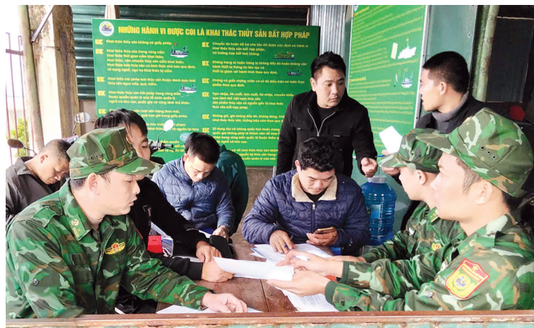
Tuyên truyền về phòng, chống IUU cho ngư dân - Ảnh: T.L