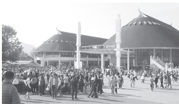
Chợ biên giới Lao Bảo thu hút đông đảo người dân tham gia

Sự phát triển nhộn nhịp thương mại, dịch vụ qua CKQT Lao Bảo đang là “đầu kéo” nền kinh tế của địa phương này. Tuy nhiên, khi thương mại - dịch vụ chiếm tỉ trọng quá lớn, trong khi công nghiệp và nông nghiệp phát triển chưa tương xứng, nền kinh tế Lao Bảo dễ rơi vào trạng thái phụ thuộc. Thực tế cho thấy, khi thị trường khu vực thay đổi, chính sách thương mại có điều chỉnh thì hoạt động xuất nhập khẩu lập tức bị ảnh hưởng, nền kinh tế Lao Bảo chịu tác động rất rõ. Hiện nay, cơ sở sản xuất trên địa bàn xã Lao Bảo vẫn ở quy mô nhỏ, giá trị gia tăng chưa cao, chưa hình thành được các chuỗi sản xuất - chế biến - tiêu