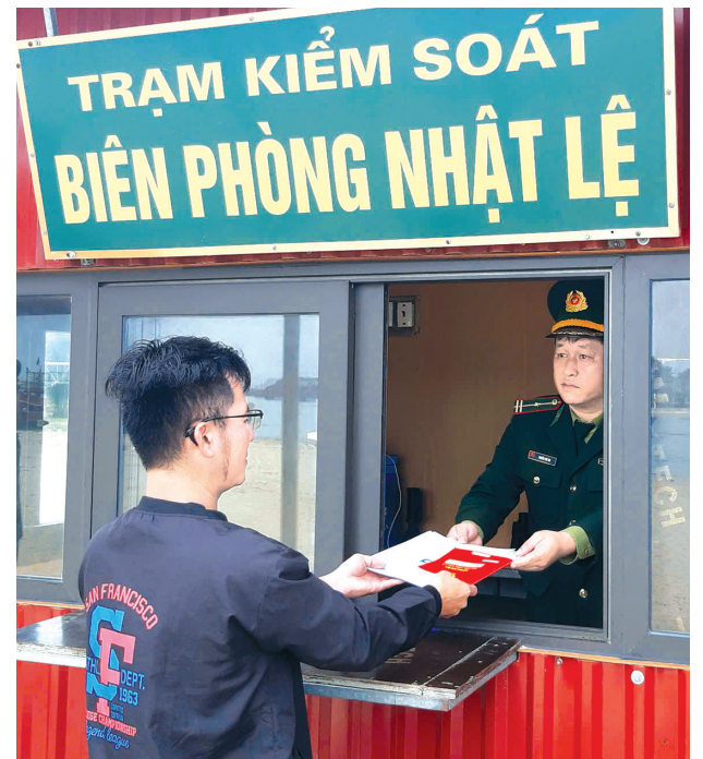
Thực hiện thủ tục xuất, nhập bến tại Đồn Biên phòng Nhật Lệ