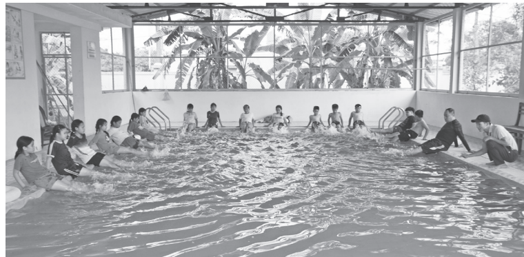
Hoạt động dạy bơi cho học sinh tại Trường tiểu học Lệ Ninh