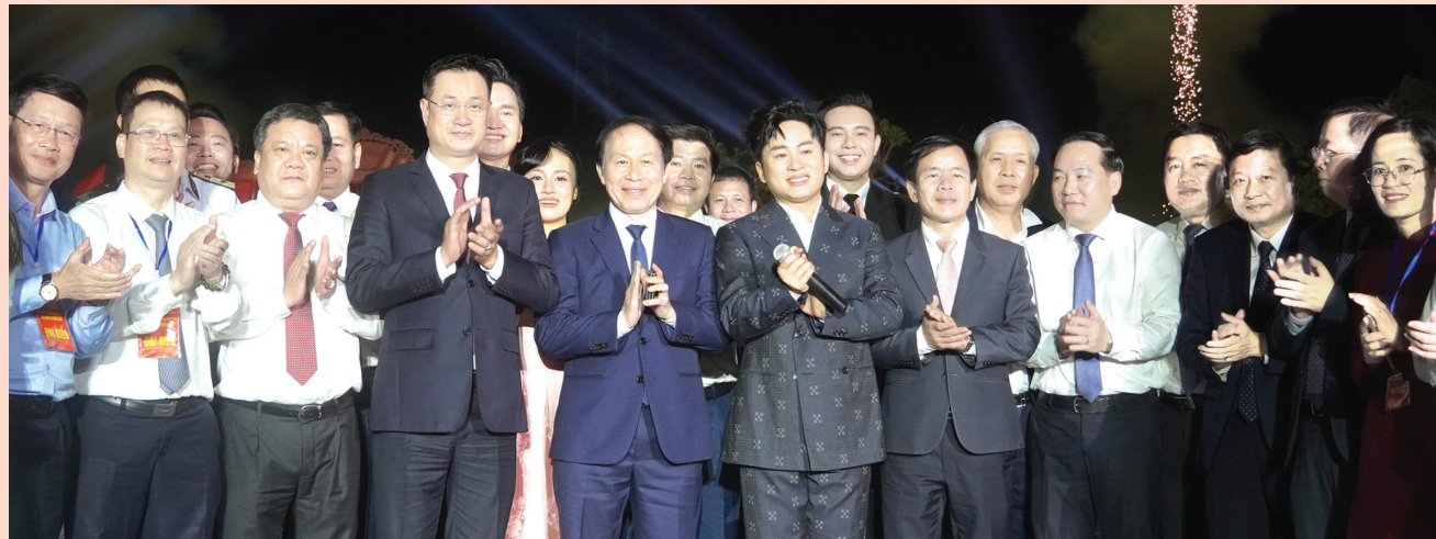
Đồng chí Lê Tiến Châu, Ủy viên Trung ương Đảng, Phó Thủ tướng Chính phủ và các đồng chí lãnh đạo Trung ương, lãnh đạo tỉnh chụp ảnh lưu niệm tại chương trình

Tối 18/4/2026, tại Khu di tích Quốc gia đặc biệt Bến phà Gianh (phường Bắc Gianh), Đài Truyền hình Việt Nam phối hợp với UBND tỉnh Quảng Trị tổ chức chương trình nghệ thuật chính luận “Bản hùng ca trên sông”. Tham dự có các đồng chí Ủy viên Trung ương Đảng: Lê Tiến Châu, Phó Thủ tướng Chính phủ; Thượng tướng Nguyễn Quang Ngọc, Thứ trưởng Bộ Quốc phòng; Đinh Hữu Thành, Phó Chủ nhiệm Ủy ban Kiểm tra Trung ương; Nguyễn Thanh Lâm, Tổng Giám đốc Đài Truyền hình Việt Nam; Lê Ngọc Quang, Bí thư Thành ủy Đà Nẵng; Trần Phong, Bí thư Tỉnh ủy Khánh Hòa; đại diện lãnh đạo các bộ, ban, ngành Trung ương, các tỉnh, thành phố.