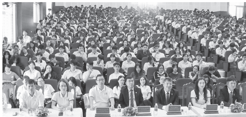
Chương trình thu hút sự tham gia của đông đảo các em học sinh - Ảnh: T.T

Sáng 19/4/2026, Trường Đại học Luật TP. Hồ Chí Minh - Phân hiệu Quảng Trị tổ chức chương trình trải nghiệm hướng nghiệp “One Day As A Ulawer - Một ngày là sinh viên Luật”. Sự kiện đã thu hút sự tham gia của hơn 500 học sinh đến từ các trường THPT trên địa bàn tỉnh.