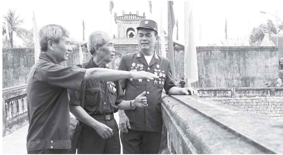
Các cựu chiến binh thăm Thành Cổ Quảng Trị

Quảng Trị, vùng đất ở khúc ruột miền Trung, mang trong mình những dấu tích của một thời chiến tranh khốc liệt. Từ Thành Cổ Quảng Trị, sông Bến Hải, cầu Hiền Lương đến địa đạo Vịnh Mốc, sân bay Tà Cơn hay đảo Cồn Cỏ... mỗi địa danh là một phần ký ức của dân tộc. Từ nền tảng đó, Quảng Trị đang từng bước phát triển du lịch lịch sử, cách mạng, gắn với việc tăng cường kết nối giữa các điểm di tích.