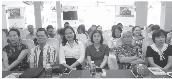
Các đại biểu tham dự lễ khai mạc trại sáng tác

Tại phường Đồng Hới, Hội Nhà văn Việt Nam vừa khai mạc Trại sáng tác văn học thiếu nhi xuân 2026.