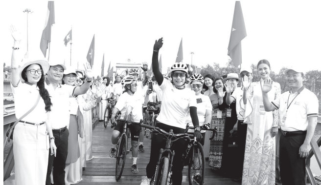
"Ngày hội đạp xe vì hòa bình" diễn ra trong không khí rộn ràng, đầy hứng khởi

Ngày 18/4/2026, tại Di tích Quốc gia đặc biệt Đồi bờ Hiền Lương - Bến Hải, Sở Văn hóa, Thể Thao và Du lịch phối hợp với Báo Thanh niên long trọng tổ chức lễ thượng cờ và lễ diễu hành "Ngày hội đạp xe vì hòa bình" năm 2026. Đây là sự kiện có ý nghĩa quan trọng, mở màn cho Lễ hội Vì Hòa bình năm 2026, được tổ chức lần thứ 2 với quy mô quốc gia và quốc tế tại tỉnh Quảng Trị.