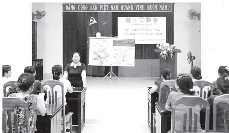
Ban công tác Mặt trận thôn Thượng Xá, xã Hải Lăng tổ chức tuyên truyền về “Tiết kiệm năng lượng bắt đầu từ mỗi gia đình”

Nhờ vậy, phong trào tiết kiệm năng lượng tại xã Hải Lăng có những chuyển biến rõ nét. Nhiều người dân đã thực hiện tiết kiệm điện, xăng dầu trong sinh hoạt và sản xuất. Điểm đáng ghi nhận là sau thời gian tuyên truyền, nhiều khu dân cư đã chuyển từ “được vận động” sang “tự giác thực hiện”. Tại thôn Thượng Xá, Ban công tác Mặt trận thôn đã đưa nội dung tiết