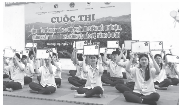
Học sinh Trường THPT Đông Hà hào hứng tham gia cuộc thi

Qua đó chung tay hành động vì một tương lai xanh - bền vững - phát triển hài hòa với thiên nhiên và đóng góp tích cực vào công tác ứng phó