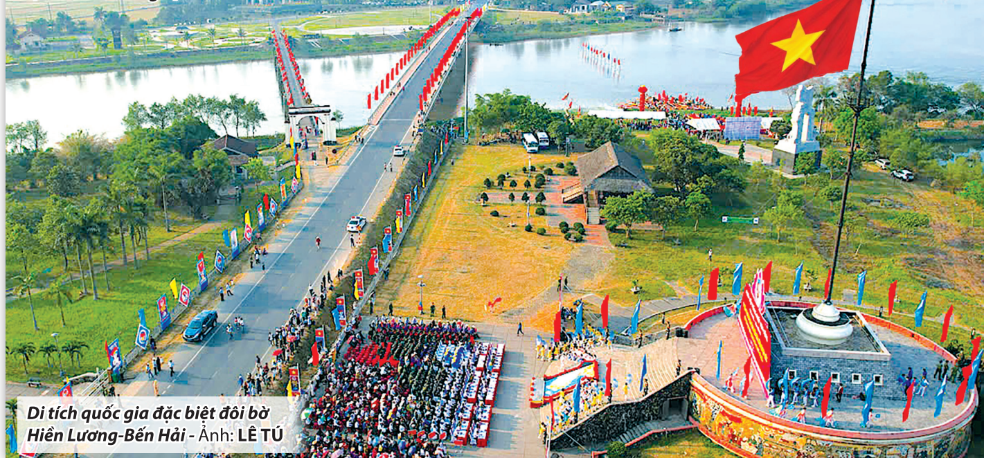
Di tích quốc gia đặc biệt đồi bờ Hiền Lương-Bến Hải