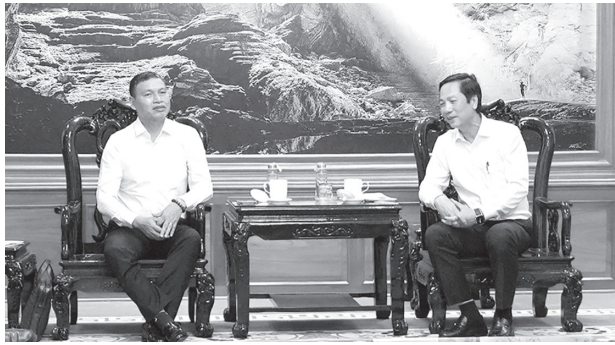
Đồng chí Hoàng Nam, Phó Chủ tịch Thường trực UBND tỉnh Quảng Trị và đồng chí Hồ Kỳ Minh, Phó Chủ tịch Thường trực UBND TP. Đà Nẵng trao đổi tại buổi làm việc

Tại buổi làm việc, hai bên đã giới thiệu các tiềm năng, thế mạnh, đồng thời trao đổi, thông tin và cơ hội hợp tác phối hợp vận động các nguồn lực phát triển kinh tế - xã hội trên địa bàn tỉnh. Theo đó, trên cơ sở nhu cầu phát triển của tỉnh Quảng Trị và chức năng của VIFC-DN, hai bên sẽ hợp tác thực hiện các dự án phát triển năng lượng, logistics, du lịch và nông nghiệp xanh. Ngoài ra, hai bên tăng cường thu hút đầu tư trong các ngành sản xuất công nghiệp, thương mại, dịch vụ khác nhằm khai thác lợi thế về tài nguyên, khoáng sản, nguồn lực sẵn