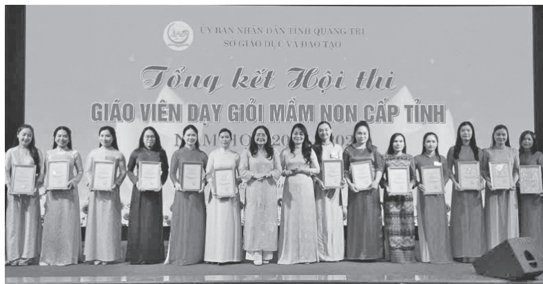
Ban Tổ chức trao giấy chứng nhận cho các giáo viên đạt danh hiệu giáo viên dạy giỏi mầm non cấp tỉnh năm học 2025-2026

Ngày 15/4/2026, Sở Giáo dục và Đào tạo tổ chức lễ tổng kết hội thi "Giáo viên dạy giỏi mầm non cấp tỉnh năm học 2025-2026".