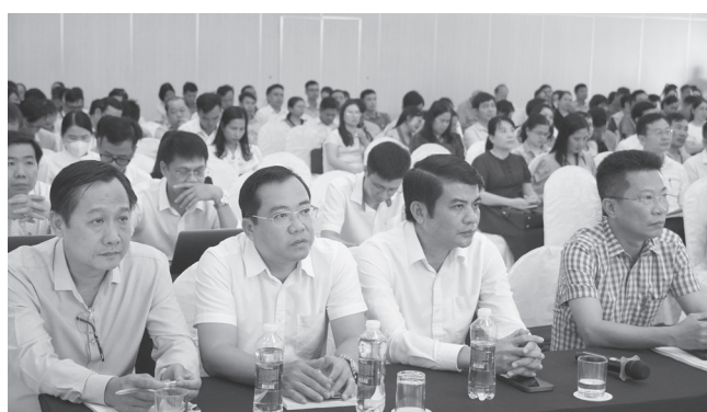
Đại biểu được tiếp thu nhiều nội dung quan trọng của kỳ thi

Về quy trình thủ tục, thí sinh sẽ đăng ký dự thi trực tuyến từ ngày 24/4/2026 đến 17 giờ ngày 5/5/2026. Đặc biệt, kỳ thi năm nay ghi nhận bước tiến lớn trong cải cách hành chính khi tích hợp giấy báo dự thi với thẻ dự thi, đồng thời gộp giấy chứng nhận kết quả thi với giấy chứng nhận tốt nghiệp tạm thời nhằm tinh gọn hồ sơ cho học sinh.