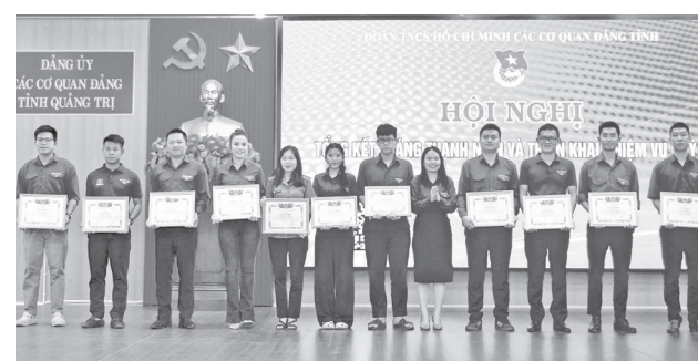
Trao giấy khen cho các tập thể có thành tích xuất sắc trong hoạt động Tháng Thanh niên năm 2026 - Ảnh: H.T

Dịp này, Đoàn các cơ quan Đảng tỉnh đã tặng giấy khen cho 11 tập thể và 14 cá nhân có thành tích xuất sắc trong triển khai các hoạt động Tháng Thanh niên năm 2026.