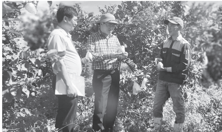
Phòng giao dịch Ngân hàng chính sách xã hội Bồ Trạch tích cực giải ngân nguồn vốn vay ưu đãi, hỗ trợ người dân phát triển sản xuất - Ảnh: B.B

Kể từ ngày 1/1/2026, Nghị định số 338/2025/NĐ-CP (Nghị định 338) chính thức có hiệu lực, đánh dấu một bước ngoặt quan trọng trong chính sách hỗ trợ việc làm. Với việc nâng mạnh hạn mức cho vay, chính sách này đang trở thành “đòn bẩy” giúp các hộ kinh doanh và người lao động bứt phá, mở rộng quy mô sản xuất.