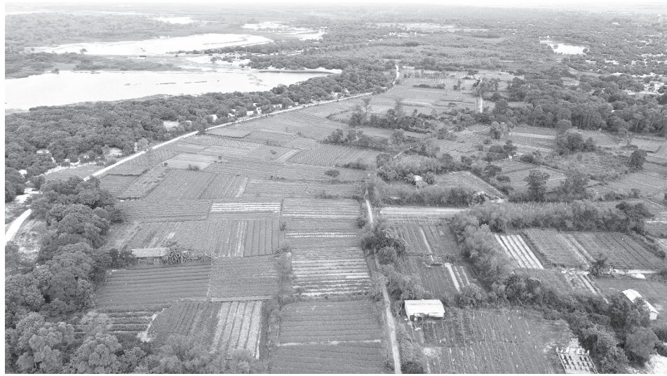
Vùng trồng mướp đắng tập trung ở thôn Đông Dương, xã Mỹ Thủy

Chị Đoàn Thu Sương ở thôn Đông Dương, xã Mỹ Thủy cho biết, gia đình chị có 3 sào mướp đắng, vào mùa thu hoạch bình quân mỗi ngày chị đưa ra thị trường khoảng 20-30kg quả. Theo chị Sương, cây mướp đắng dễ trồng, không tốn nhiều công chăm sóc và vốn đầu tư, nhưng năng suất cao và thích hợp với vùng đất cát của địa phương. Mỗi sào cho thu hoạch khoảng 8-9 tạ, mang lại thu nhập bình quân từ 10-12 triệu đồng. Đặc biệt, từ năm 2023, sau khi được cán bộ kỹ thuật của Trung tâm Khuyến nông tỉnh hướng dẫn, chị đã chuyển toàn bộ diện tích sang trồng mướp đắng theo hướng hữu cơ. Với 2 vụ/năm, cây mướp đắng không chỉ mang lại cho chị nguồn thu nhập ổn định mà còn bảo đảm sức khỏe cho người trồng và an toàn thực phẩm cho người tiêu dùng. "Mướp đắng trồng theo hướng hữu cơ có khả năng kháng bệnh tốt, ít sâu bệnh, trái có màu xanh đẹp nên được người tiêu dùng ưa chuộng. Sắp tới tôi sẽ mở rộng thêm diện tích và nâng cấp