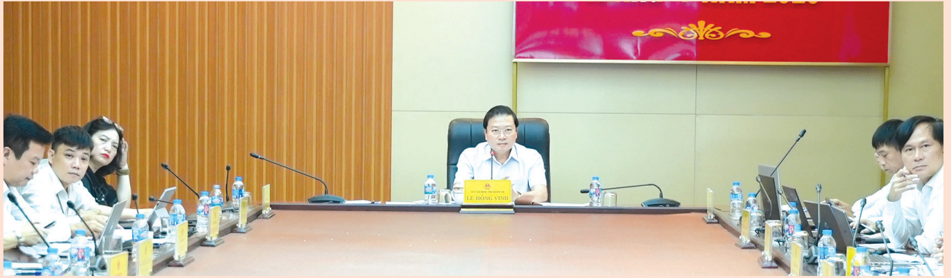
Đồng chí Lê Hồng Vinh, Phó Bí thư Tỉnh ủy, Chủ tịch UBND tỉnh chủ trì phiên tiếp công dân