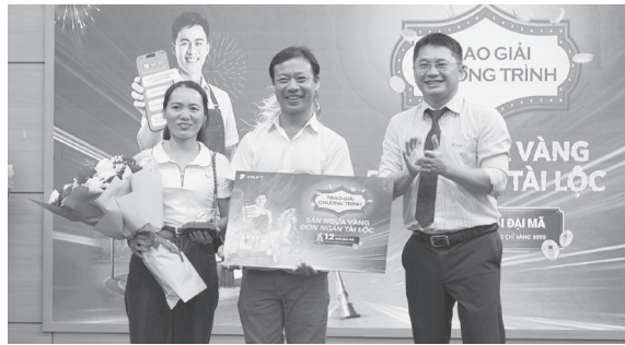
Lãnh đạo VNPT Quảng Trị trao thưởng cho khách hàng may mắn

Chiều 15/4/2026, VNPT Quảng Trị tổ chức trao thưởng cho khách hàng may mắn trúng thưởng chương trình “Săn ngựa vàng-Đón ngàn tài lộc”.