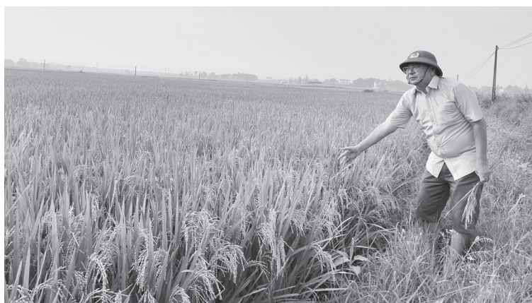
Lúa hữu cơ là xu thế canh tác mà các hợp tác xã hướng đến