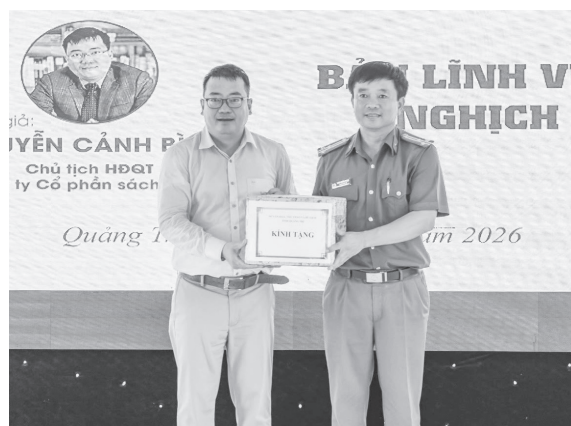
Đại diện lãnh đạo Trại giam Đồng Sơn nhận quà tặng từ đơn vị đồng hành với chương trình

Chương trình đã góp phần lan tỏa văn hóa đọc, đồng thời hỗ trợ phạm nhân nâng cao nhận thức, củng cố niềm tin, từ đó tạo động