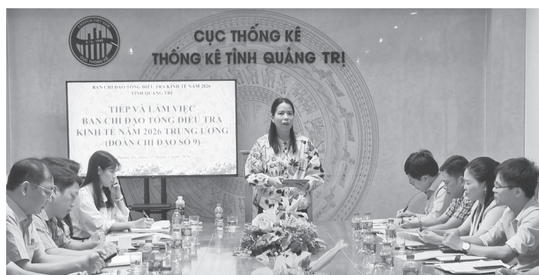
Quang cảnh buổi làm việc

Tại tỉnh Quảng Trị, công tác thu thập thông tin giai đoạn 1 của chương trình Tổng điều tra kinh tế năm 2026 đã hoàn thành sớm hơn 12 ngày so với kế hoạch. Theo đó, có 122.495 cơ sở cá thể điều tra toàn bộ; 3.938 cơ sở điều tra mẫu; khối tôn giáo, tín ngưỡng có 430 cơ sở; tổ hợp tác 262 cơ sở. Về công tác thu thập thông tin giai đoạn 2, tính đến ngày 15/4/2026, đối với khối điều tra đơn vị sự nghiệp ngoài công lập, hội, hiệp hội và tổ chức phi chính phủ đã có 187/364 đơn vị hoàn thành kê khai thông tin, đạt 50%. Đối với khối doanh nghiệp, có 12.321 doanh nghiệp phải kê khai, trong đó 8.334 doanh nghiệp đã hoàn thành kê khai thông tin, đạt