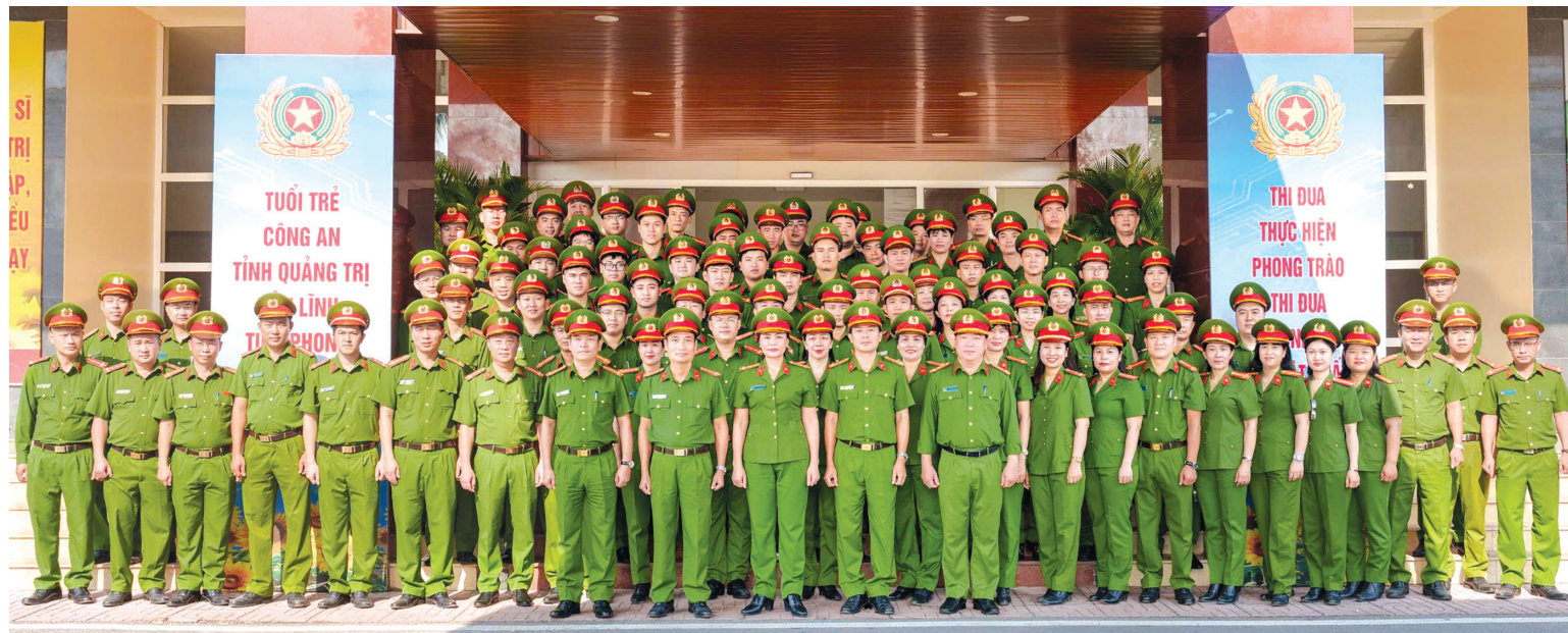
Tập thể Ban Chỉ huy và cán bộ, chiến sĩ Phòng Cảnh sát Quản lý hành chính về trật tự xã hội, Công an tỉnh Quảng Trị

Để xứng đáng với truyền thống và niềm vinh dự, tự hào khi được giao trách nhiệm to lớn, lãnh đạo Công an tỉnh tiếp tục chỉ đạo lực lượng Cảnh sát QLHC về TTXH cống hiến, nỗ lực hết mình vì bình yên, hạnh phúc của Nhân dân; đoàn kết một lòng, khắc phục mọi khó khăn, gian khổ, quyết tâm nhận và hoàn thành xuất sắc mọi nhiệm vụ được giao, xứng đáng với niềm tin của Đảng, Nhà nước và Nhân dân, góp phần xây dựng quê hương Quảng Trị ngày càng phát triển và giàu mạnh.