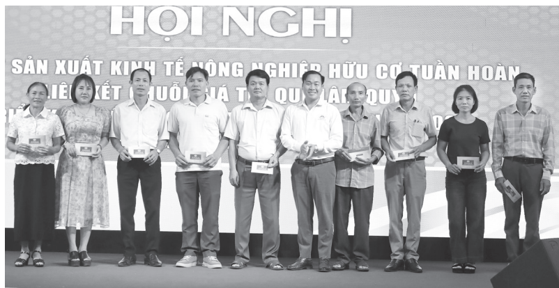
Trao thưởng cho các nông dân sản xuất theo chuỗi giá trị Quế Lâm đạt thành tích cao