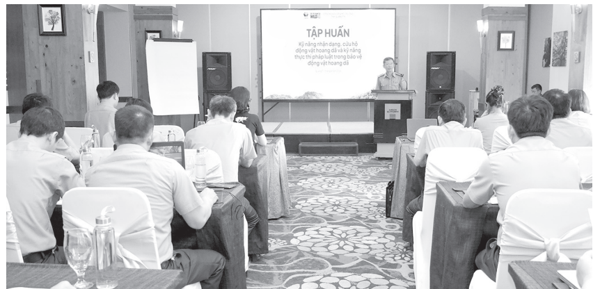
Quang cảnh lớp tập huấn

Ngày 14/4/2026, Chi Cục Kiểm lâm tỉnh phối hợp với Công ty TNHH Không vì lợi nhuận Choice tổ chức tập huấn "Kỹ năng nhận dạng, cứu hộ động vật hoang dã (ĐVHD) và kỹ năng thực thi pháp