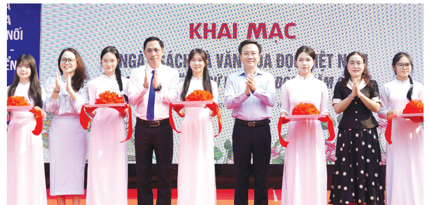
Ban Tổ chức cắt băng khai mạc Ngày sách và Văn hóa đọc Việt Nam và phát động cuộc thi "Đại sứ văn hóa đọc" tỉnh Quảng Trị năm 2026