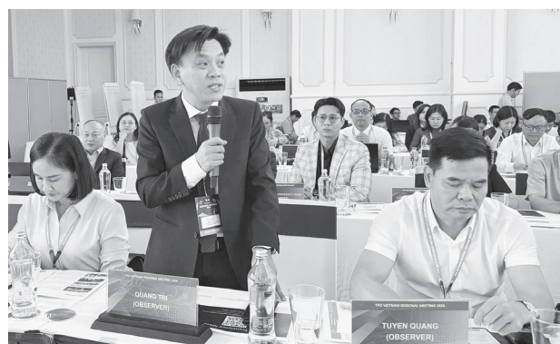
Đại diện lãnh đạo Sở Văn hóa, Thể thao và Du lịch tỉnh Quảng Trị phát biểu tại hội nghị