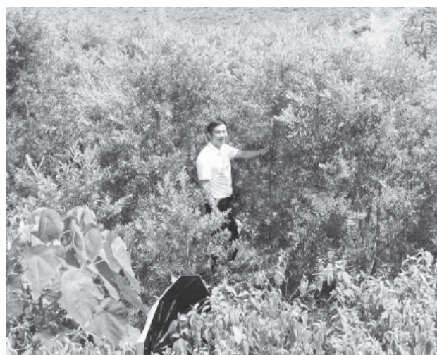
Vườn trà nguyên liệu của Hợp tác xã Afarm

Mỗi năm, HTX Afarm sản xuất khoảng 700-1.000 lít tinh dầu trà, mỗi lít có giá bán từ 1,5-1,6 triệu đồng,