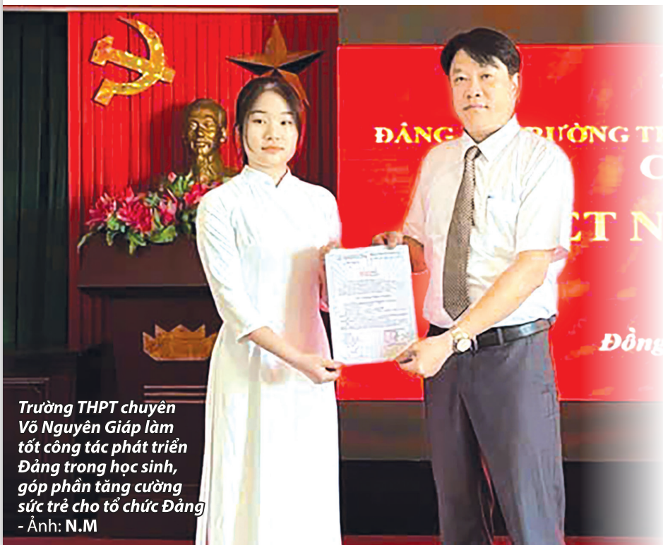
Trường THPT chuyên Võ Nguyên Giáp làm tốt công tác phát triển Đảng trong học sinh, góp phần tăng cường sức trẻ cho tổ chức Đảng - Ảnh: N.M

Trong công tác xây dựng Đảng, trẻ hóa đội ngũ đảng viên là giải pháp quan trọng để nâng cao năng lực lãnh đạo, sức chiến đấu của tổ chức cơ sở đảng. Trước yêu cầu phát triển nhanh, bền vững, công tác tạo nguồn, bồi dưỡng, kết nạp đảng viên trẻ đặt ra yêu cầu ngày càng cao cả về số lượng và chất lượng. Bên cạnh kết quả tích cực, vẫn còn những khó khăn, "điểm nghẽn" cần được tháo gỡ bằng giải pháp đồng bộ, sát thực tiễn nhằm khơi dậy khát vọng cống hiến, tăng cường sức trẻ cho Đảng. (Xem bài trang 5)