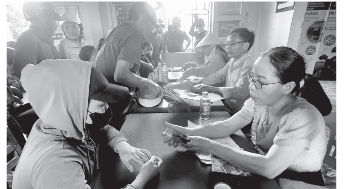
Xã Lệ Ninh thực hiện chi trả tiền hỗ trợ phục hồi sản xuất cho các hộ dân trên địa bàn

Theo đó, xã Lệ Ninh có 837 đối tượng (bao gồm hộ gia đình, cá nhân và tổ chức sản xuất) đủ điều kiện thụ hưởng. Tổng kinh phí giải ngân đạt trên 2,4 tỉ đồng. Việc áp dụng Nghị định số 09/2025/NĐ-CP đã giúp các thủ tục xét duyệt trở nên chặt chẽ và bảo đảm quyền lợi tối đa cho người dân bị thiệt hại. Tại các điểm chi trả, bà con đều phấn khởi khi nhận được sự quan tâm kịp thời từ Đảng và Nhà nước.