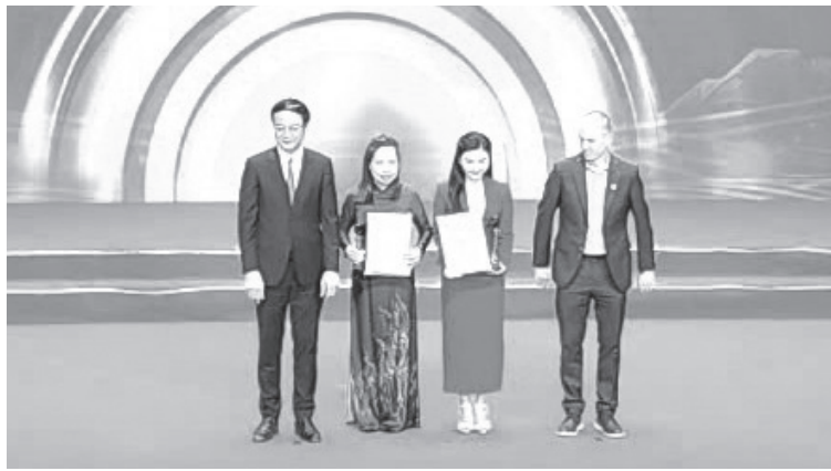
Ban Tổ chức liên hoan trao giải Đồng cho đại diện nhóm tác giả tác phẩm “Tên dăng mộ liệt sĩ” (thứ 2 từ trái sang), Báo và phát thanh, truyền hình Quảng Trị

Liên hoan Phát thanh toàn quốc lần thứ XVII có sự tham gia của 34 cơ quan báo và PT, TH tỉnh, thành phố, Trung tâm PT, TH Quân đội, Cục Truyền thông Công an nhân dân và các đơn vị báo chí trong cả