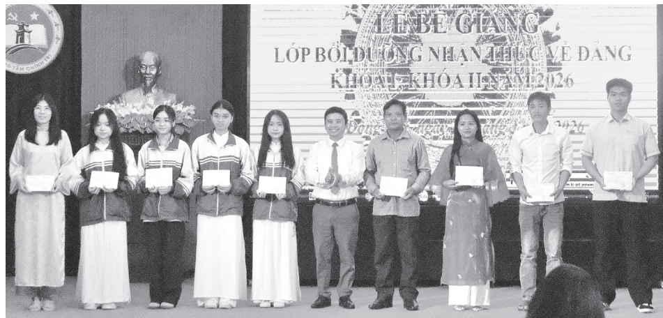
Trường THPT chuyên Võ Nguyên Giáp làm tốt công tác tạo nguồn kết nạp Đảng, góp phần tăng cường sức trẻ cho tổ chức đảng

Trong công tác xây dựng Đảng, trẻ hóa đội ngũ đảng viên là giải pháp quan trọng để nâng cao năng lực lãnh đạo, sức chiến đấu của tổ chức cơ sở đảng. Trước yêu cầu phát triển nhanh, bền vững, công tác tạo nguồn, bồi dưỡng, kết nạp đảng viên trẻ đặt ra yêu cầu ngày càng cao cả về số lượng và chất lượng. Bên cạnh kết quả tích cực, vẫn còn những khó khăn, “điểm nghẽn” cần được tháo gỡ bằng giải pháp đồng bộ, sát thực tiễn nhằm khơi dậy khát vọng cống hiến, tăng cường sức trẻ cho Đảng.