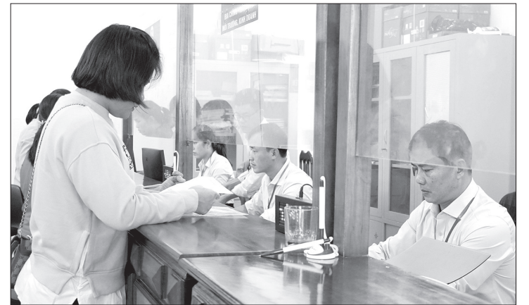
Với “sổ đỏ” tích hợp trên ứng dụng VNeID, người dân không cần phải mang nhiều giấy tờ khi thực hiện các thủ tục hành chính

Theo Quyết định số 441/QĐ-BNNMT, ngày 2/2/2026 của Bộ Nông nghiệp và Môi trường (NN-MT), người dân từ nay có thể sử dụng “sổ đỏ” điện tử trên ứng dụng VNeID thay cho bản giấy khi thực hiện các thủ tục hành chính (TTHC). Tiện ích này giúp người dân không còn bắt buộc phải mang theo “sổ đỏ” bản cứng khi thực hiện các thủ tục liên quan đến đất đai tại cơ quan chức năng, nếu dữ liệu đã được cập nhật và đồng bộ trên hệ thống.