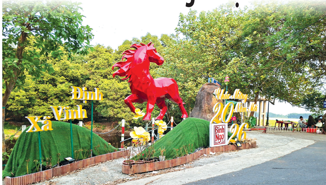
Tràm Trà Lộc, khu du lịch trải nghiệm thú vị cho du khách