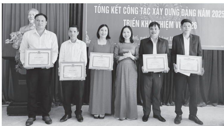
Đảng ủy xã A Dơi khen thưởng các chi bộ đạt tiêu chuẩn “Hoàn thành xuất sắc nhiệm vụ” năm 2025