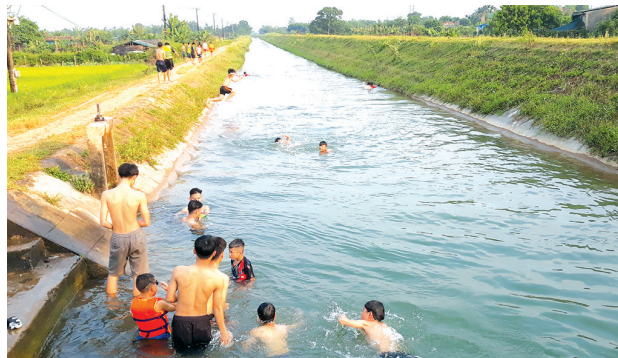
Nhiều trẻ em lựa chọn tắm và tập bơi trên các con kênh của quê hương