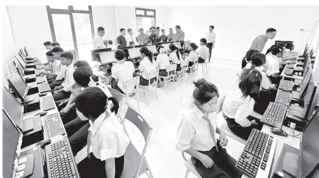
Phòng học "Máy tính cho em" trang bị 34 máy vi tính mới có kết nối mạng internet

Tại buổi lễ, đại diện đơn vị tài trợ mong muốn hỗ trợ nhà trường cải thiện điều kiện dạy và học; đồng thời tin tưởng phòng máy sẽ được khai thác hiệu quả, phục vụ tốt cho việc học tập của học sinh. Toàn bộ kinh phí trao tặng phòng học gồm 34 máy vi tính với tổng trị giá 130 triệu đồng từ nguồn kinh phí đóng góp của cán bộ, nhân viên và người lao động Ngân