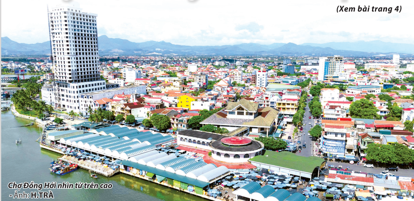
Chợ Đồng Hới nhìn từ trên cao