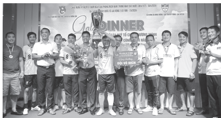
Ban tổ chức trao giải nhất cho đội FC cán bộ xã Trường Sơn

Tại giải đấu, Ban Tổ chức đã vận động và tiếp nhận nguồn