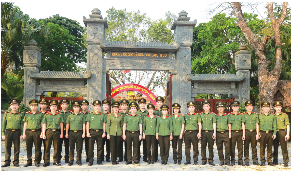
Tập thể cán bộ, chiến sĩ Phòng An ninh nội địa chụp ảnh lưu niệm tại Khu lưu niệm Chủ tịch Hồ Chí Minh, xã Kim Liên, tỉnh Nghệ An

Cách mạng Tháng Tám thành công, lực lượng Công an nhân dân ra đời và trở thành một trong những lực lượng nòng cốt của chính quyền nhân dân. Ngày 18/4/1946, Bộ Nội vụ ban hành Nghị định số 121/NV-NĐ về thành lập tổ chức Việt Nam Công an vụ gồm 3 cấp: Công an Việt Nam (gọi là Nha Công an Việt Nam), Công an kỳ (gọi là Sở Công an kỳ) và Công an tỉnh (gọi là Ty Công an tỉnh). Trong đó, Phòng Chính trị thuộc Nha Công an có bộ phận chính trị làm nhiệm vụ điều tra, theo dõi phản cách mạng, là tổ chức tiền thân của lực lượng An ninh nội địa (ANND) hiện nay.