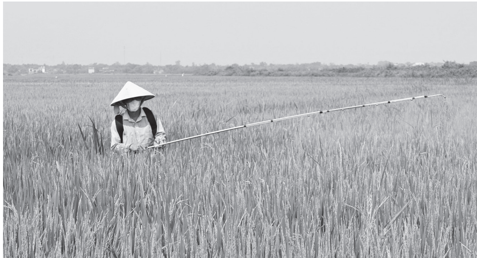
Nông dân xã Mỹ Thủy phun thuốc phòng bệnh đạo ôn cổ bông theo hướng dẫn của cơ quan chuyên môn