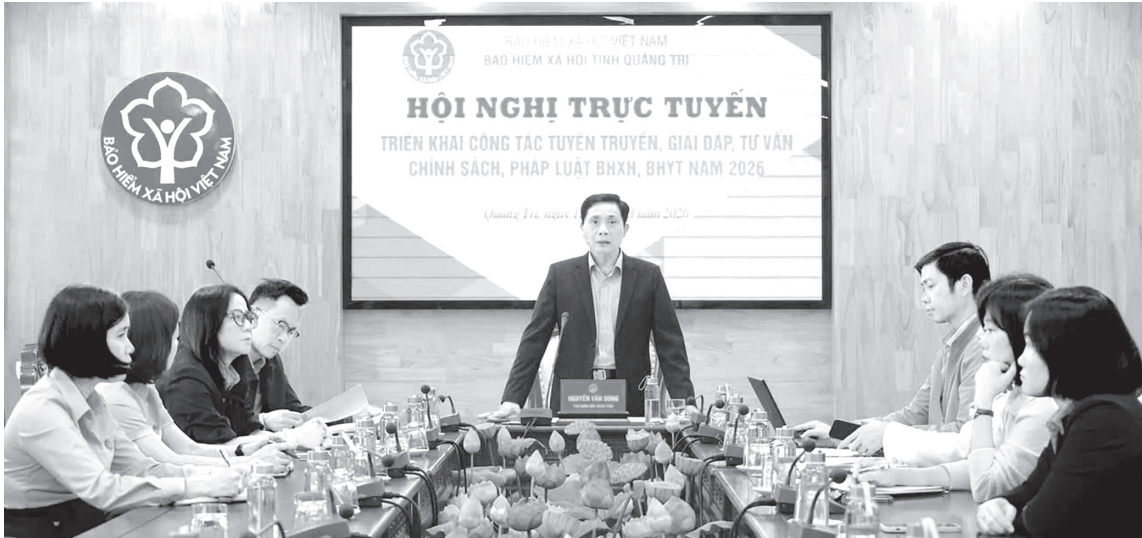
Hội nghị trực tuyến triển khai công tác tuyên truyền, giải đáp, tư vấn chính sách, pháp luật BHXH-BHYT năm 2026