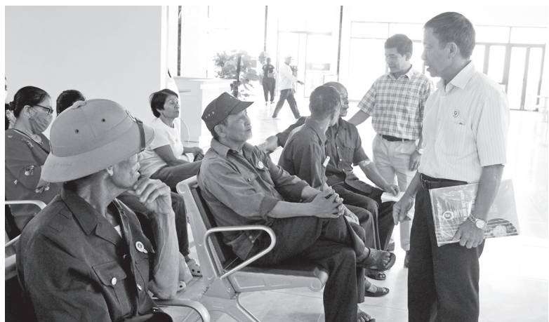
Đại diện lãnh đạo Hội Cựu chiến binh tỉnh chuyện trò, động viên các cựu chiến binh đến khám chữa bệnh

Nhân kỷ niệm 51 năm Ngày giải phóng miền Nam, thống nhất đất nước, ngày 13/4/2026, Bệnh viện đa khoa (BVĐK) TTH Quảng Bình phối hợp với Hội Cựu chiến binh (CCB) tỉnh tổ chức chương trình khám, cấp thuốc miễn phí (100% chế độ bảo hiểm) tri ân cho tất cả các CCB (có nhu cầu) trên địa bàn tỉnh.