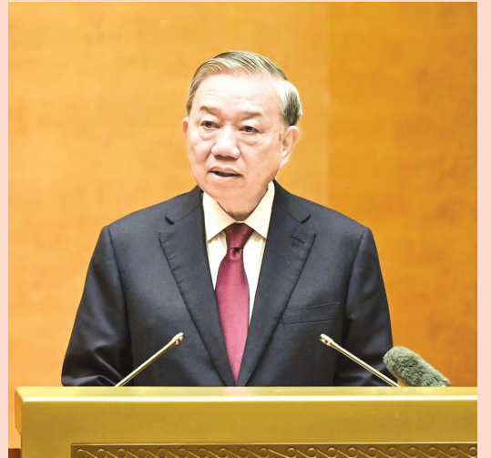
Đồng chí Tô Lâm, Tổng Bí thư, Chủ tịch nước phát biểu chỉ đạo hội nghị

Đại biểu tham dự hội nghị tại điểm cầu Quảng Trị