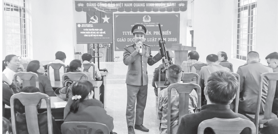
Công an xã Thượng Trạch thường xuyên quan tâm tuyên truyền, phổ biến giáo dục pháp luật cho người dân

Nhằm giữ vững ổn định ANTT trên địa bàn, thời gian qua, Công an xã Thượng Trạch đã chủ động tham mưu cấp ủy, chính quyền địa phương xây dựng và triển khai đồng bộ nhiều kế hoạch, phương án bảo đảm ANTT. Trong đó, đơn vị đã tổ chức thực hiện hiệu quả các đợt cao điểm tấn công, trấn áp tội phạm, bảo đảm ANTT phục vụ đại hội Đảng các cấp, cuộc bầu cử đại biểu Quốc hội khóa XVI và đại biểu HĐND các cấp, nhiệm kỳ 2026-2031; dịp lễ, Tết; các chương trình, chuyển thăm, làm việc của lãnh đạo cấp cao trên địa bàn. Công tác tuần tra, kiểm soát được tăng cường với 122 lượt tuần tra, kịp thời phát hiện, xử lý các hành vi vi phạm pháp luật.