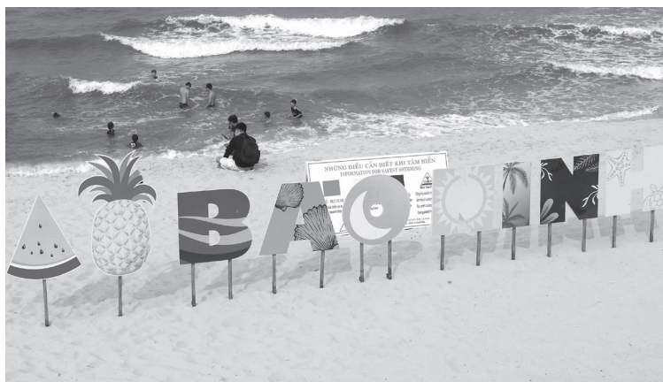
Pường Đồng Hới chú trọng đầu tư trang trí tại các bãi tắm biển trên địa bàn để thu hút du khách