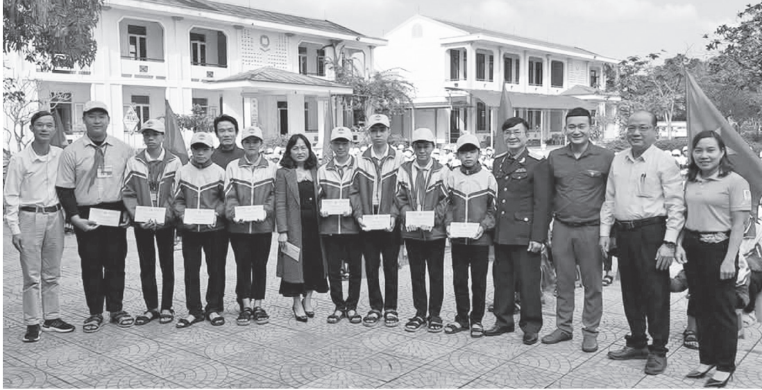
Hội Cựu chiến binh xã Lệ Ninh phối hợp tổ chức hoạt động giáo dục truyền thống và tặng quà cho các em học sinh có hoàn cảnh khó khăn trên địa bàn

Phát huy phẩm chất “Bộ đội Cụ Hồ”, Hội Cựu chiến binh (CCB) xã Lệ Ninh luôn gương mẫu, đi đầu trong thực hiện các phong trào thi đua, góp phần xây dựng quê hương ngày càng giàu đẹp, văn minh.