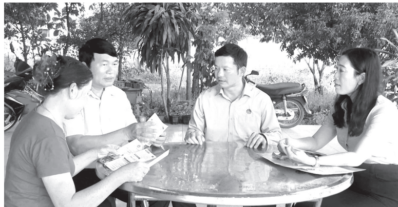
Cán bộ Bảo hiểm xã hội cơ sở Minh Hóa rà soát, lập danh sách cấp thẻ bảo hiểm y tế cho người dân xã Kim Phú