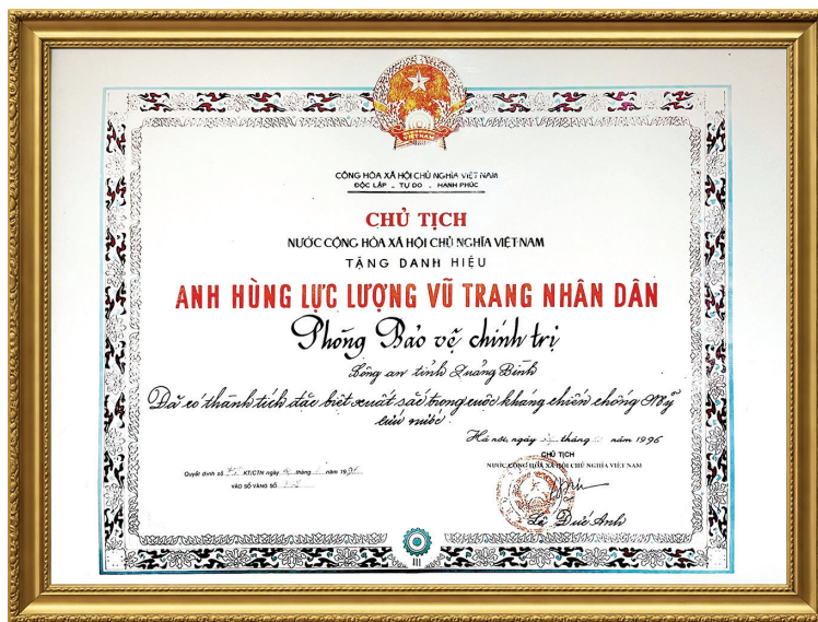
Danh hiệu đơn vị "Anh hùng lực lượng vũ trang nhân dân" của Phòng Bảo vệ chính trị, nay là Phòng An ninh nội địa, Công an tỉnh

Ngay khi mới ra đời, chính quyền cách mạng non trẻ phải đương đầu với "thù trong, giặc ngoài". Các lực lượng Liêm phóng, Trinh sát, Quốc gia tự vệ cuộc đã bắt tay ngay vào cuộc đấu tranh bảo vệ Đảng, bảo vệ chính quyền cách mạng. Những thế hệ cán bộ, chiến sĩ (CBCS) đầu tiên của lực lượng ANND vượt qua gian khổ của chiến tranh, dựa vào Nhân dân, kiên trì đấu tranh, khéo léo vận dụng pháp luật, trấn áp nhiều tổ chức phản động mạnh mẽ chống đối chính quyền, bắt và trừng trị nhiều tên tay sai chỉ điểm, từng bước vô hiệu hóa hoạt động chống phá của các thế lực nội phản câu kết với giặc ngoại xâm.