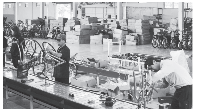
Hoạt động sản xuất kinh doanh ở Công ty Việt Hồng Chinh