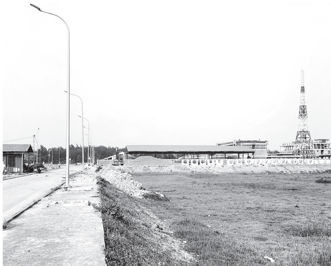
Cụm công nghiệp Lộc Ninh giai đoạn 1 đang gấp rút hoàn thành - Ảnh: T.L