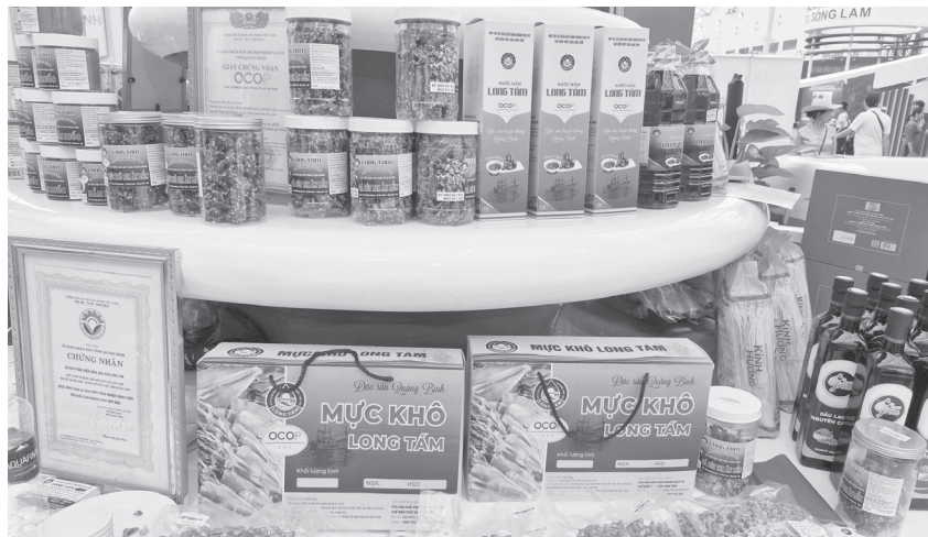
Các sản phẩm OCOP của Hợp tác xã Sản xuất kinh doanh dịch vụ chế biến thủy sản Long Tám trưng bày tại Hà Nội

Với đường bờ biển trải dài và nhiều làng nghề truyền thống hàng trăm năm, sản vật từ biển của Quảng Trị vốn phong phú và nức tiếng về chất lượng. Nếu được khai thác đúng hướng, hình thành sản phẩm đặc trưng gắn với du lịch, các sản phẩm OCOP làng biển không chỉ dừng lại ở lợi thế tự nhiên mà còn từng bước trở thành thương hiệu, mang lại giá trị cao, ổn định sinh kế bền vững cho người dân.