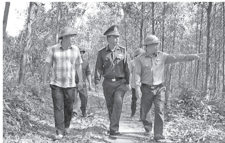
Lực lượng Kiểm lâm và các chủ rừng kiểm tra công tác phòng cháy, chữa cháy rừng tại địa bàn phường Đồng Sơn

Hiện nay, thời tiết nắng nóng đặc biệt gay gắt trên diện rộng, với nền nhiệt độ cao nhất phổ biến từ 36-40 độ C, có nơi trên 40 độ C đang đẩy nguy cơ xảy ra cháy rừng tại nhiều khu vực trên địa bàn tỉnh lên mức rất cao. Trước tình hình đó, tỉnh Quảng Trị đã kích hoạt các phương án phòng ngừa, ứng phó thông qua việc chủ động triển khai các biện pháp phòng cháy, chữa cháy rừng (PCCCR) với phương châm “phòng là chính, chữa cháy phải khẩn trương, kịp thời và triệt để”.