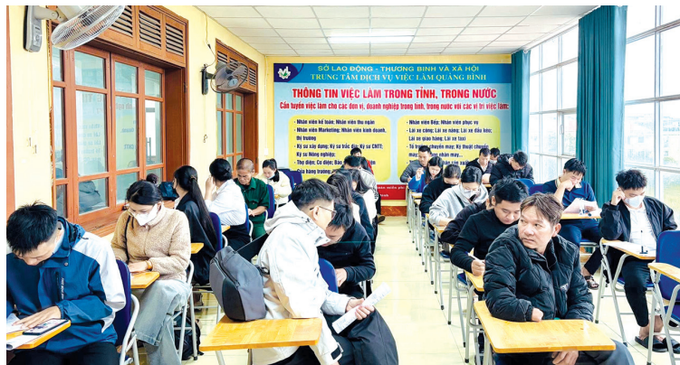
Người lao động đến tìm kiếm cơ hội việc làm trong và ngoài nước tại Trung tâm Dịch vụ việc làm Quảng Trị

Đưa người lao động (NLD) đi làm việc ở nước ngoài theo hợp đồng đang trở thành hướng đi quan trọng, góp phần giải quyết việc làm, nâng cao thu nhập và cải thiện đời sống cho người dân trên địa bàn tỉnh. Với sự vào cuộc đồng bộ của các cấp, ngành và địa phương, hoạt động này ngày càng phát huy hiệu quả, tạo điều kiện để NLD từng bước hội nhập sâu rộng vào thị trường lao động quốc tế.