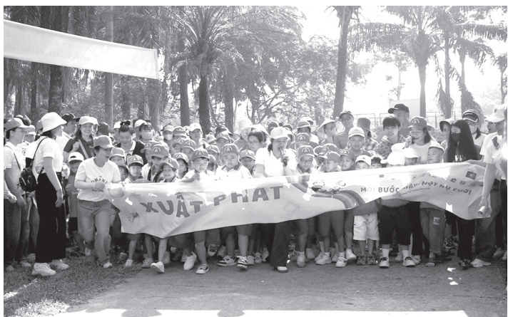
Các em học sinh hào hứng tham gia chương trình

Sáng 12/4/2026, tại phường Nam Đông Hà, Trung tâm Sáng kiến sức khỏe và dân số phối hợp với các đơn vị liên quan tổ chức sự kiện “Mỗi bước chạy-Một nụ cười”, hưởng ứng Ngày Thế giới nhận thức về tự kỷ (2/4) và Ngày Người khuyết tật Việt Nam (18/4).