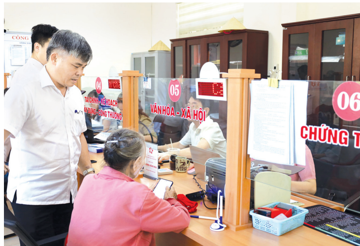
Người dân đến giao dịch, tiếp cận dịch vụ số tại Trung tâm Phục vụ hành chính công xã Nam Trạch

Khi người dân chủ động thích nghi với CDS, hiệu quả mang lại không chỉ là sự thuận tiện trong đời sống mà còn góp phần thúc đẩy phát triển kinh tế-xã hội địa phương. Với sự vào cuộc đồng bộ của cả hệ thống chính trị và sự hưởng ứng tích cực từ người dân, Quảng Trị đang từng bước hiện thực hóa mục tiêu xây dựng xã hội số, tạo nền tảng cho phát triển nhanh và bền vững trong giai đoạn mới.