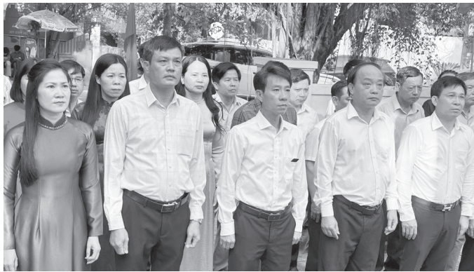
Các đồng chí trong Đảng ủy, HĐND, UBND, Ủy ban MTTQVN phường Đồng Thuận dâng hoa tưởng niệm tại Bia Di tích Chi bộ Hưng Ninh

Ngày 10/4/2026, Đảng ủy, HĐND, UBND, Ủy ban MTTQVN phường Đồng Thuận tổ chức lễ dâng hoa tưởng niệm tại Bia Di tích Chi bộ Hưng Ninh nhân kỷ niệm 79 năm Ngày thành lập Chi bộ Hưng Ninh (10/4/1947-10/4/2026).