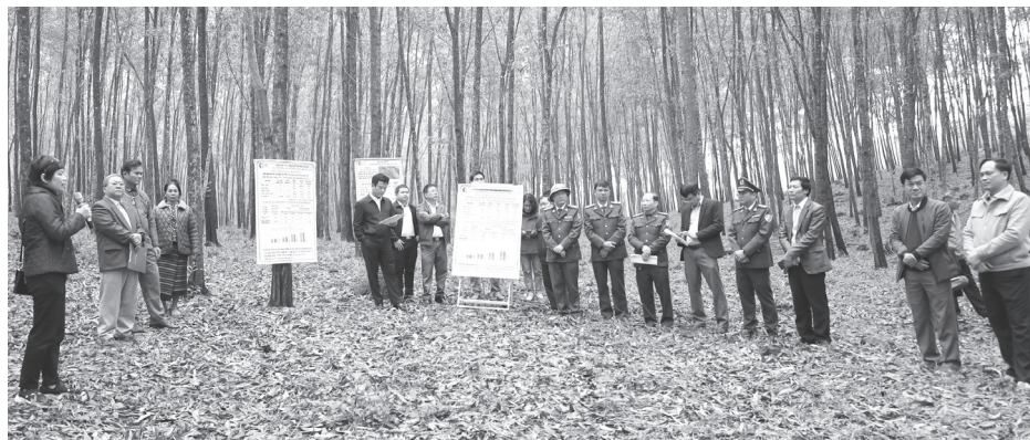
Mô hình trồng rừng gỗ lớn góp phần nâng cao năng suất, chất lượng rừng trồng