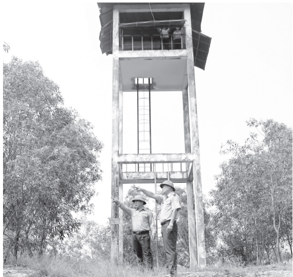
Nhân viên Ban Quản lý rừng phòng hộ Đồng Hới và ven biển tỉnh Quảng Trị túc trực 24/24 giờ để "canh lửa", bảo vệ hiệu quả rừng phòng hộ ven biển trong mùa khô 2026

Quảng Trị đang bước vào mùa cao điểm nắng nóng, tiềm ẩn nguy cơ xảy ra cháy rừng, nhất là đối với các dải rừng phòng hộ, rừng sản xuất trên vùng cát ven biển. Nhằm bảo vệ hiệu quả toàn bộ những diện tích rừng được giao quản lý, Ban Quản lý (BQL) rừng phòng hộ Đồng Hới và ven biển tỉnh Quảng Trị đã huy động tối đa quân số, phương tiện để túc trực phòng cháy, chữa cháy rừng (PCCCR).