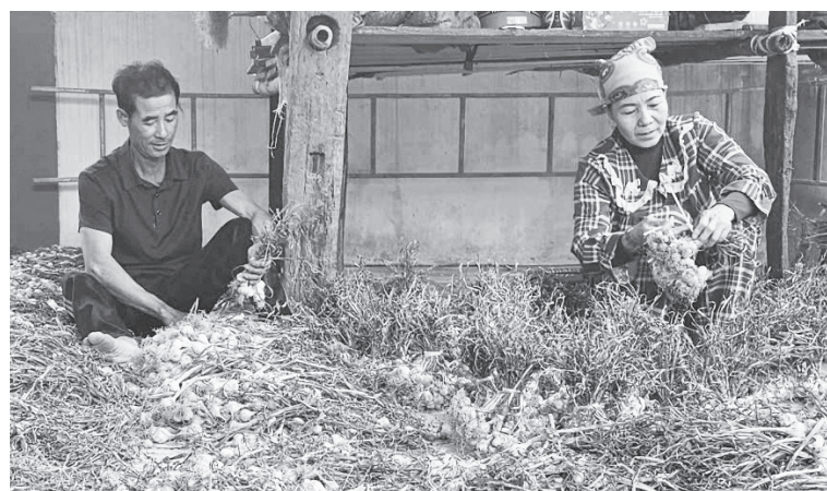
Tỏi sau khi thu hoạch được người dân thôn Cồn Năm phơi khô, bảo quản đúng quy trình kỹ thuật