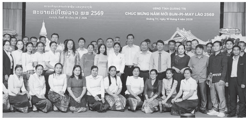
Các đại biểu chụp ảnh lưu niệm tại buổi gặp mặt