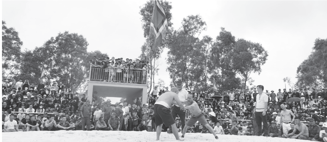
Các hoạt động văn hóa ở phường Ba Đồn luôn thu hút sự tham gia của đông đảo người dân

Sở hữu hệ thống di tích lịch sử-văn hóa phong phú cùng không gian văn hóa phi vật thể đặc sắc, phường Ba Đồn đang nỗ lực gìn giữ, phát huy di sản, coi đây là động lực cho phát triển bền vững. Từ đó, công tác bảo tồn tại địa phương không chỉ dừng ở việc gìn giữ, mà còn gắn với phát triển kinh tế-xã hội, góp phần nâng cao đời sống tinh thần của người dân.