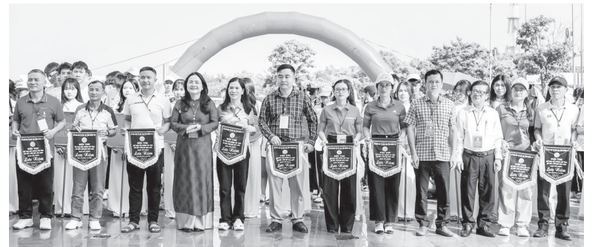
Ban Tổ chức trao cờ lưu niệm cho các đoàn tham gia hội thi