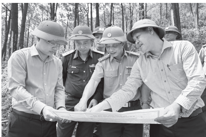
Đoàn công tác kiểm tra hiện trường tại đội sản xuất Quảng Trạch, xã Phú Trạch thuộc Công ty TNHH MTV Lâm công nghiệp Bắc Quảng Bình