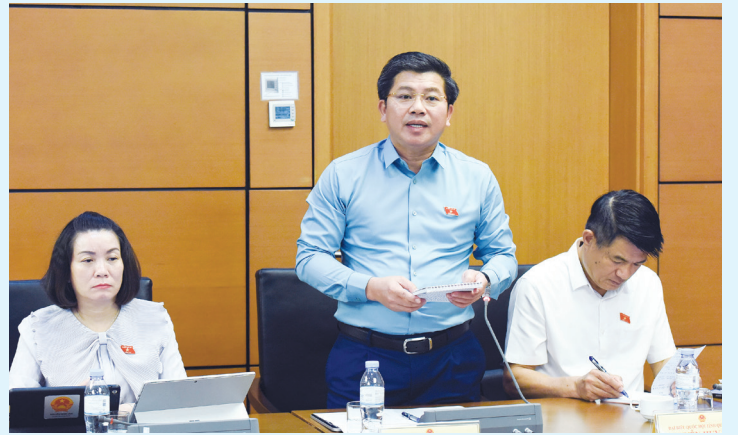
Đồng chí Trần Vũ Khiêm, Phó Bí thư Thường trực Tỉnh ủy, Trưởng đoàn đại biểu Quốc hội tỉnh phát biểu thảo luận tại tổ

Thống nhất với đánh giá tổng thể về kinh tế đất nước, đồng chí Trưởng đoàn ĐBQH tỉnh Trần Vũ Khiêm cho rằng vẫn còn khoảng trống trong cách tiếp cận chính sách; báo cáo đã nhận diện đúng động lực tăng trưởng nhưng thiếu giải pháp cụ thể tháo gỡ "nút thắt" thể chế. Vì vậy, đề nghị làm rõ hơn các khó khăn đặc thù, điểm nghẽn cần xử lý ở tầm quốc gia để bảo đảm mục tiêu tăng trưởng hai con số. (Xem tiếp trang 2)