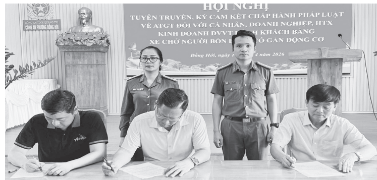
Đại diện các tổ chức, cá nhân ký cam kết chấp hành nghiêm quy định bảo đảm an toàn giao thông

Tại hội nghị, lực lượng Công an phường đã phổ biến, hướng dẫn các quy định của pháp luật, đặc biệt là các nội dung trong Nghị định số 165/