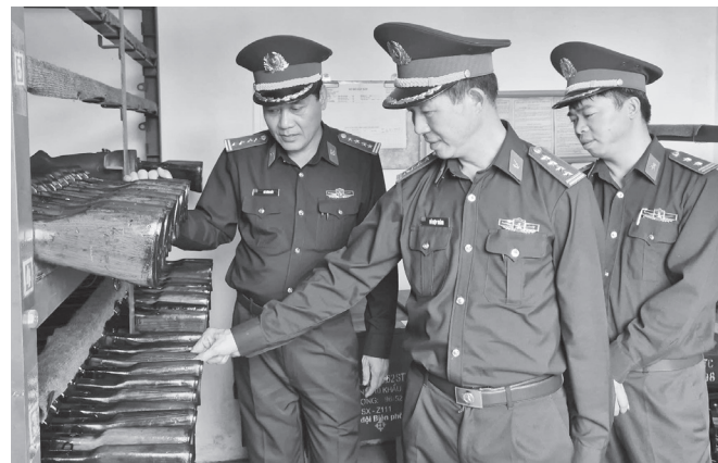
Kiểm tra vũ khí, trang bị phục vụ huấn luyện chiến sĩ mới

Công tác hậu cần được bảo đảm đầy đủ, đúng tiêu chuẩn. Hệ thống nhà ăn, nhà bếp được củng cố chính quy, an toàn; thực hiện chặt chẽ quy trình vệ sinh an toàn thực phẩm; chủ động phát triển tăng gia sản xuất, bảo đảm đời sống bộ đội. Công tác theo dõi, chăm sóc sức khỏe bộ đội, tổ chức khám phúc tra, tiêm phòng, phòng chống dịch bệnh đúng quy định.