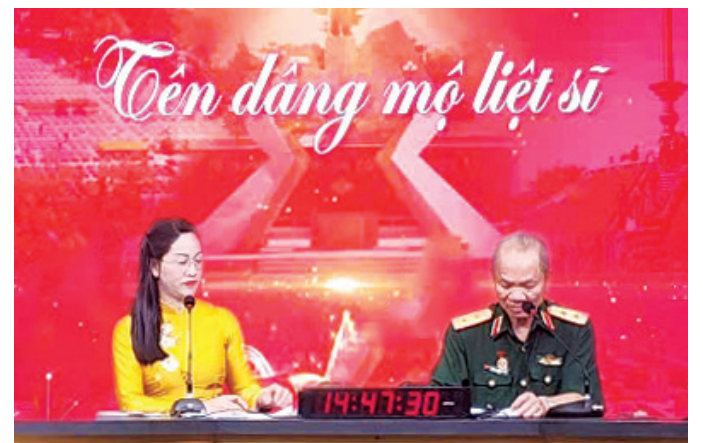
Chương trình phát thanh trực tiếp với chủ đề: "Tên dâng mộ liệt sĩ" của Báo và phát thanh, truyền hình Quảng Trị tại Liên hoan Phát thanh toàn quốc lần thứ XVII

Trong khuôn khổ Liên hoan Phát thanh toàn quốc lần thứ XVII do Đài Tiếng nói Việt Nam (VOV) tổ chức tại tỉnh Quảng Ninh, chiều 10/4/2026, Báo và phát thanh, truyền hình Quảng Trị đã tham gia dự thi chương trình phát thanh trực tiếp với chủ đề: "Tên dâng mộ liệt sĩ". (Xem tiếp trang 7)