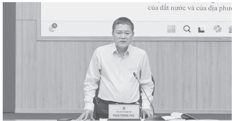
Đồng chí Phan Phong Phú, Phó Chủ tịch UBND tỉnh phát biểu tại hội nghị

Chiều 8/4/2026, UBND tỉnh tổ chức hội nghị về Chương trình phát triển nhà ở giai đoạn 2021-2030 trên địa bàn tỉnh do đồng chí Phan Phong Phú, Phó Chủ tịch UBND tỉnh chủ trì. Cùng tham dự có đại diện lãnh đạo Sở Xây dựng, các sở, ngành, đơn vị liên quan.