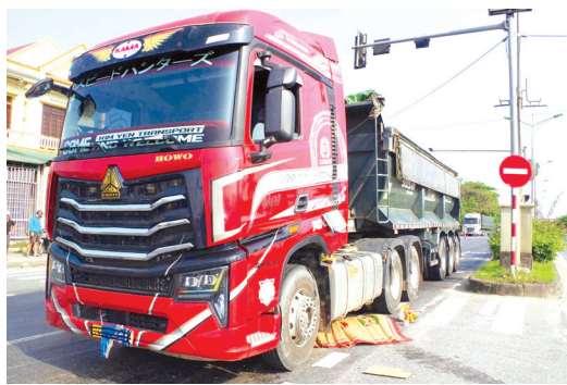
Hiện trường một vụ tai nạn giao thông nghiêm trọng xảy ra trong tháng 3/2026

Theo đánh giá của Phòng Cảnh sát giao thông (CSGT),