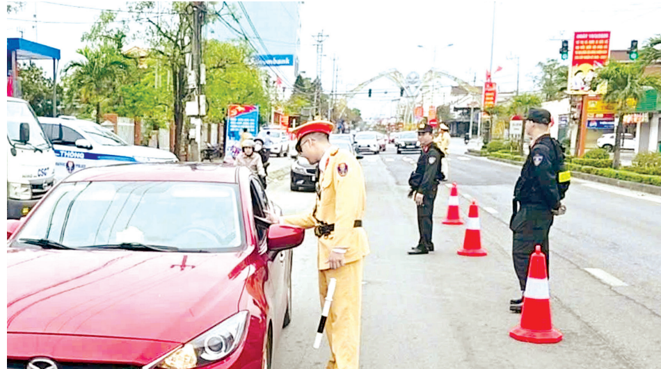
Lực lượng Công an triển khai thực hiện chuyên đề xử lý nồng độ cồn thường xuyên, liên tục

Đối với các sở, ban, ngành, đoàn thể, địa phương, cần tiếp tục triển khai thực hiện nghiêm túc các chỉ đạo của Ban Thường vụ Tỉnh ủy, HĐND tỉnh, UBND tỉnh về việc tăng cường thực hiện các giải pháp bảo đảm TTATGT, kiểm chế TNGT. Đẩy mạnh công tác tuyên truyền, phổ biến, giáo dục pháp luật TTATGT theo hướng đưa pháp luật đến gần đời sống, gắn với từng hành vi cụ thể; phát huy hiệu quả hệ thống truyền thanh cơ sở và đẩy mạnh tuyên truyền trên mạng xã hội, các nền tảng số. Qua đó, nâng cao ý thức tự giác của người tham gia giao thông