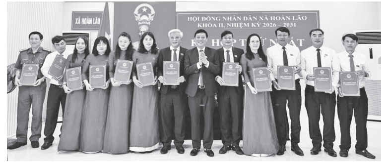
Kiến toàn bộ máy chính quyền xã Hoàn Lão, nhiệm kỳ 2026-2031

Để nâng cao năng lực lãnh đạo, sức chiến đấu của tổ chức đảng, thời gian qua, Đảng bộ xã Hoàn Lão tiếp tục tăng cường củng cố, xây dựng tổ chức đảng và nâng cao chất lượng đội ngũ đảng viên; chỉ đạo đổi mới và nâng cao chất lượng sinh hoạt chi bộ theo Chỉ thị số 50-CT/TW của Ban Bí thư. Đảng ủy xã hướng dẫn các chi bộ