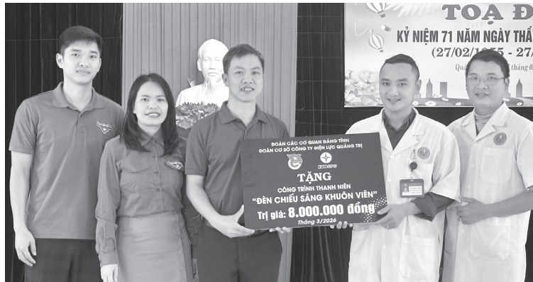
Tuổi trẻ PC Quảng Trị bàn giao công trình thanh niên "Đèn chiếu sáng khuôn viên" tại Bệnh viện đa khoa Đồng Hới

Nổi bật trong chuỗi hoạt động Tháng Thanh niên 2026, tuổi trẻ PC Quảng Trị đã tổ chức, tham gia nhiều hoạt động rất thiết thực, ý nghĩa, như: Dâng hương tri ân các anh hùng liệt sĩ tại Nghĩa trang liệt sĩ quốc gia Trường Sơn, Nghĩa trang liệt sĩ quốc gia Đường 9, Đài tưởng niệm Di tích quốc gia đặc biệt Thành Cổ Quảng Trị, hang Tám Thanh niên xung phong... Hoạt động này đã góp phần giáo dục thế hệ trẻ về lòng biết ơn vô hạn, sự tri ân sâu sắc đối với công lao to lớn của các anh hùng liệt sĩ, thanh niên xung phong đã hiến