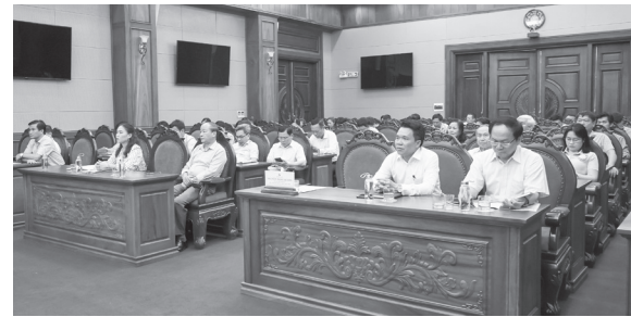
Các đại biểu tham dự hội nghị tại điểm cầu tỉnh Quảng Trị

xây dựng chương trình hành động thiết thực để thực hiện Nghị quyết Đại hội lần thứ XIV của Đảng.