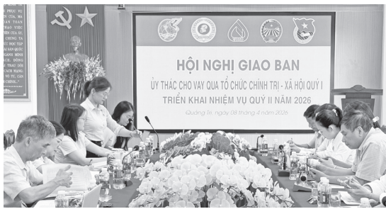
Quang cảnh hội nghị giao ban

Ngày 8/4/2026, Chi nhánh Ngân hàng Chính sách xã hội (CSXH) tỉnh tổ chức hội nghị giao ban công tác ủy thác quý I, triển khai nhiệm vụ quý II/2026. Dự hội nghị có 4 tổ chức chính trị - xã hội gồm: Hội Liên hiệp Phụ nữ tỉnh, Hội Nông dân tỉnh, Hội Cựu chiến binh tỉnh, Tỉnh đoàn; đại diện các phòng, ban thuộc Chi nhánh Ngân hàng CSXH tỉnh.