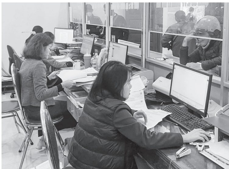
Công tác đào tạo, bồi dưỡng cán bộ, công chức sẽ được xã Trường Phú chú trọng

Để thực hiện thắng lợi Nghị quyết Đại hội đại biểu Đảng bộ xã lần thứ I, nhiệm kỳ 2025 - 2030, xã Trường Phú đang tập trung triển khai đồng bộ các giải pháp nhằm nâng cao chất lượng nguồn nhân lực, xây dựng đội ngũ cán bộ, công chức (CB, CC) đủ năng lực, đáp ứng yêu cầu phát triển trong tình hình mới.