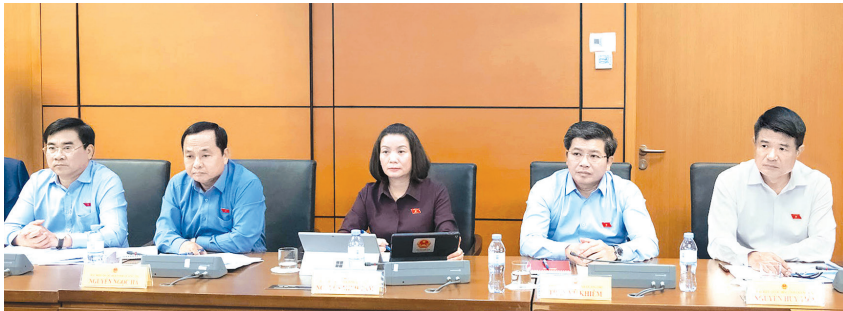
Các đại biểu Quốc hội tỉnh tham dự phiên thảo luận tại tổ

Tiếp tục chương trình kỳ họp thứ nhất, Quốc hội khóa XVI, chiều 8/4/2026, Đoàn đại biểu Quốc hội (ĐBQH) tỉnh do đồng chí Trần Vũ