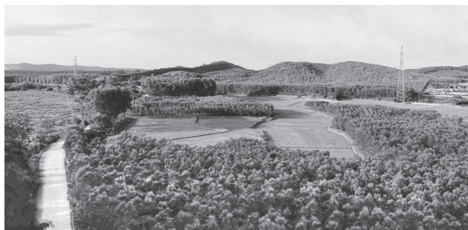
Diện tích rừng trồng tại xã Trường Phú được quản lý và bảo vệ tốt nhằm hạn chế nguy cơ xảy ra cháy rừng trong mùa khô

Cùng với việc chú trọng thực hiện tốt công tác PCCCR, xã Trường Phú cũng đạt nhiều kết quả tích cực trong quản lý, bảo vệ và phát triển rừng. Năm 2025, hoạt động trồng rừng trên địa bàn từng bước chuyển sang sản xuất theo chuỗi giá trị, nhiều mô hình kinh tế lâm nghiệp hiệu quả được nhân rộng. Địa phương đã bước đầu hình thành mối liên kết giữa người trồng rừng với các cơ sở chế biến, tiêu thụ sản phẩm, gắn với quản lý rừng bền vững. Hiện, toàn xã có hơn 1.646ha rừng keo trầm được cấp chứng chỉ FSC, góp phần nâng cao giá trị kinh tế và phát triển lâm nghiệp theo hướng bền vững.