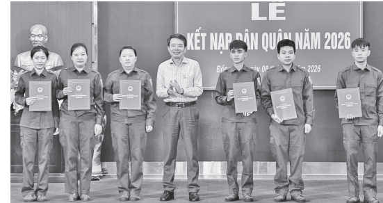
Đại diện lãnh đạo phường Đồng Hới trao quyết định kết nạp công dân tham gia thực hiện nghĩa vụ dân quân tự vệ năm 2026

Đợt huấn luyện diễn ra trong thời gian 15 ngày (từ ngày 8 - 22/4/2026). Ban CHQS phường phát động và tiến hành ký kết thi đua, phấn đấu có 100% chiến sĩ dân quân nhận thức đầy đủ, sâu sắc về việc thực hiện nghĩa vụ quân sự, quốc phòng; tập trung thi đua nâng cao trình độ huấn luyện và khả năng sẵn sàng chiến đấu của đơn vị; hoàn thành 100% nội dung, chương trình huấn luyện. Kết quả kiểm tra có 100% cán bộ, chiến sĩ đạt yêu cầu, có trên 75% đạt khá, giỏi; 100% cán bộ, chiến sĩ chấp hành nghiêm kỷ luật huấn luyện, có động cơ thi đua đúng đắn, tích cực