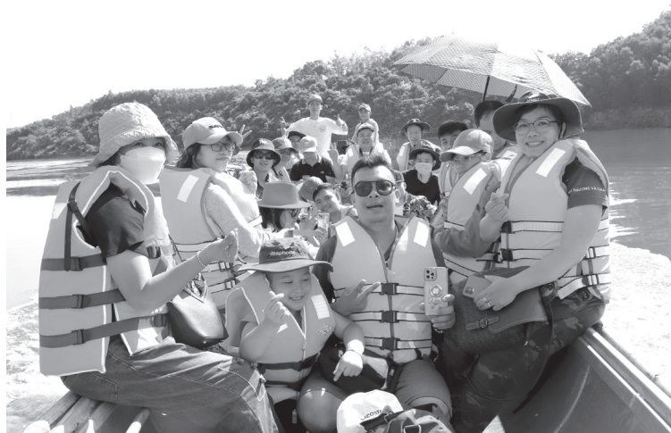
Vượt sông Long Đại đến với các bản Hôi Ráy, Nước Đắng, xã Trường Sơn, năm 2023 - Ảnh: T.L

Năm 2016, sau trận lũ lịch sử gây thiệt hại nặng nề cho Nhân dân các địa