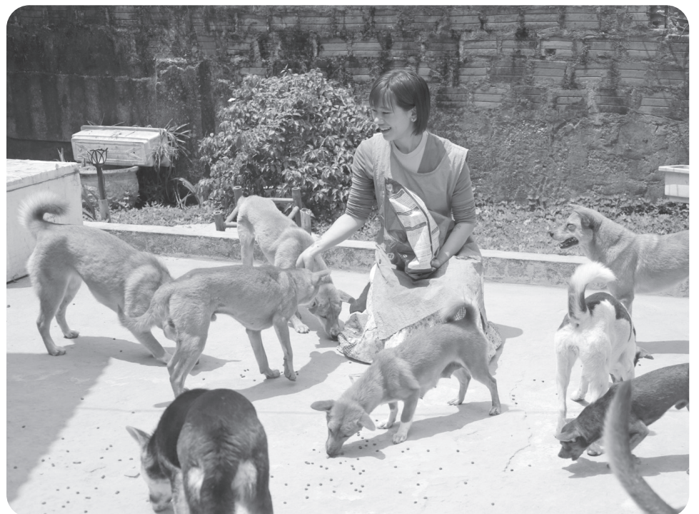
Trạm Xanh trở thành ngôi nhà chung của những chú chó, mèo bị bỏ rơi

lạ kỳ. Đây là chú chó mà cô từng phải đến tận nơi, bỏ tiền ra để chuộc về ngay trước khi bị chủ cũ mang đi bán giết thịt. Kia là chú mèo hoang gây trở ngại được tìm thấy thoi thóp ven đường và kia nữa là chú chó bị tai nạn gãy chân, nằm co quắp chờ chết cho đến khi Thảo xuất hiện. Mỗi con là một số phận, một vết thương nhưng tất cả đều đã được Thảo và các tình nguyện viên của Trạm Xanh đưa về để bắt đầu một cuộc đời mới.