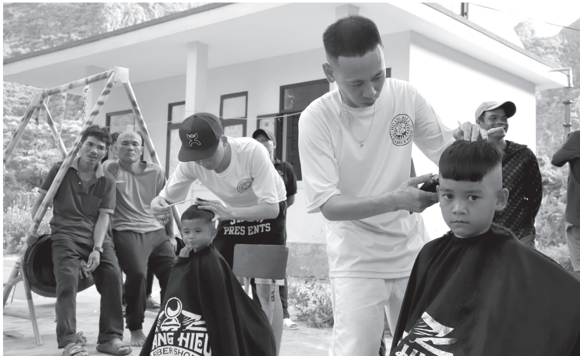
Các tình nguyện viên Hải Đăng cắt tóc miễn phí cho trẻ em Bru-Vân Kiều 2 bản Hôi Ráy, Nước Đắng, năm 2023