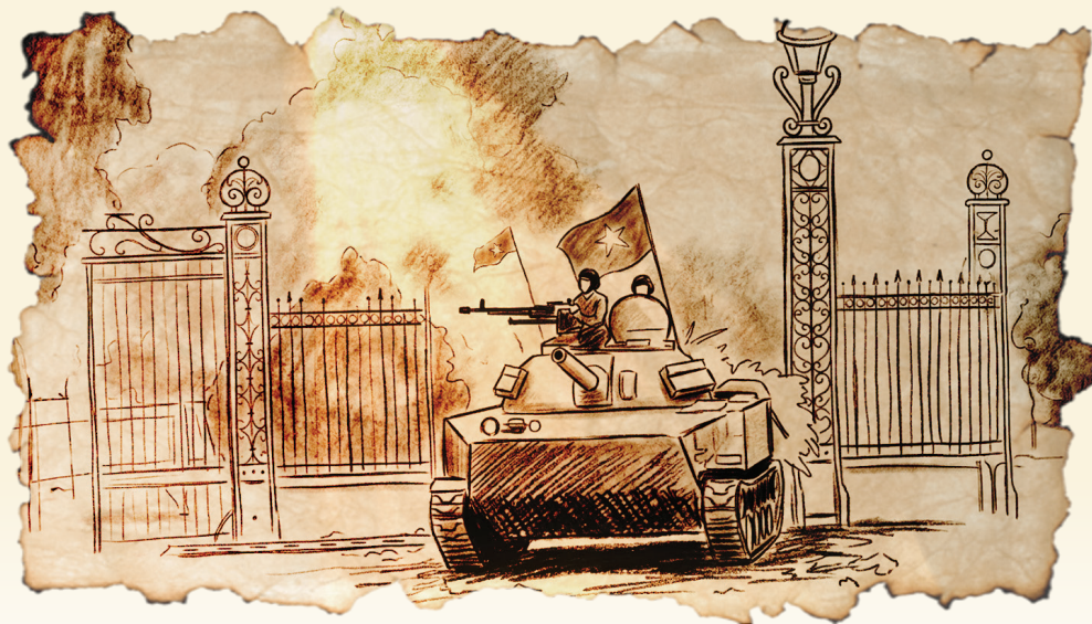
Minh họa: H.H

Bức họa vẫn sáng rực giữa mùi thuốc súng Chiếc xe tăng bỗng trở thành ngôi đền di động Cửa ngõ Sài Gòn, người bạn ngã xuống vì độc lập tự do Ánh sáng niềm tin đỏ rực màu cờ.