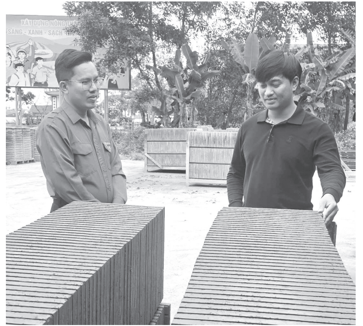
Công ty TNHH Xây dựng tổng hợp Quang Lập cung ứng ra thị trường khoảng 100.000m 2 gạch mỗi năm

● P.V: Một điểm cộng lớn cho mô hình của anh là tính thân thiện với môi trường. Anh có thể chia sẻ rõ hơn về giá trị "xanh" này?