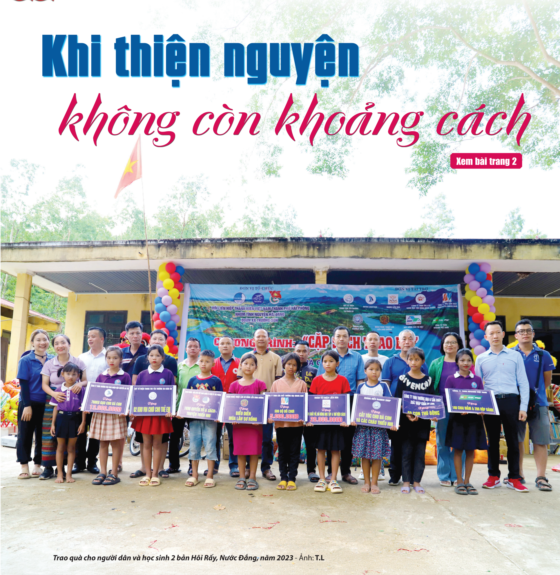
Trao quà cho người dân và học sinh 2 bản Hôi Rầy, Nước Đắng, năm 2023