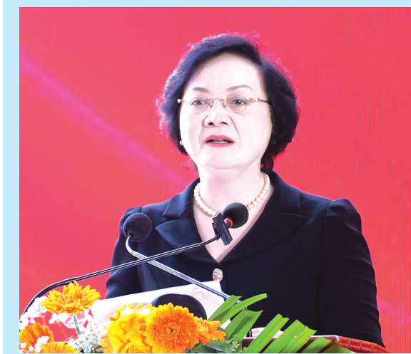
Đồng chí Phạm Thị Thanh Trà, Bí thư Trung ương Đảng, Phó Thủ tướng Chính phủ phát biểu tại lễ phát động