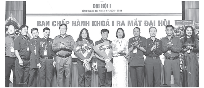
Ban Chấp hành Hội Cựu Thanh niên xung phong tỉnh khóa I, nhiệm kỳ 2026-2031 ra mắt đại hội

Sáng 2/4/2026, Hội Cựu thanh niên xung phong (TNXP) tỉnh đã tổ chức Đại hội đại biểu lần thứ I, nhiệm kỳ 2026-2031. Tham dự có đại diện Hội cựu TNXP Việt Nam, các ban, ngành cùng 190 cựu TNXP đại diện cho 34.000 hội viên Hội Cựu TNXP toàn tỉnh.