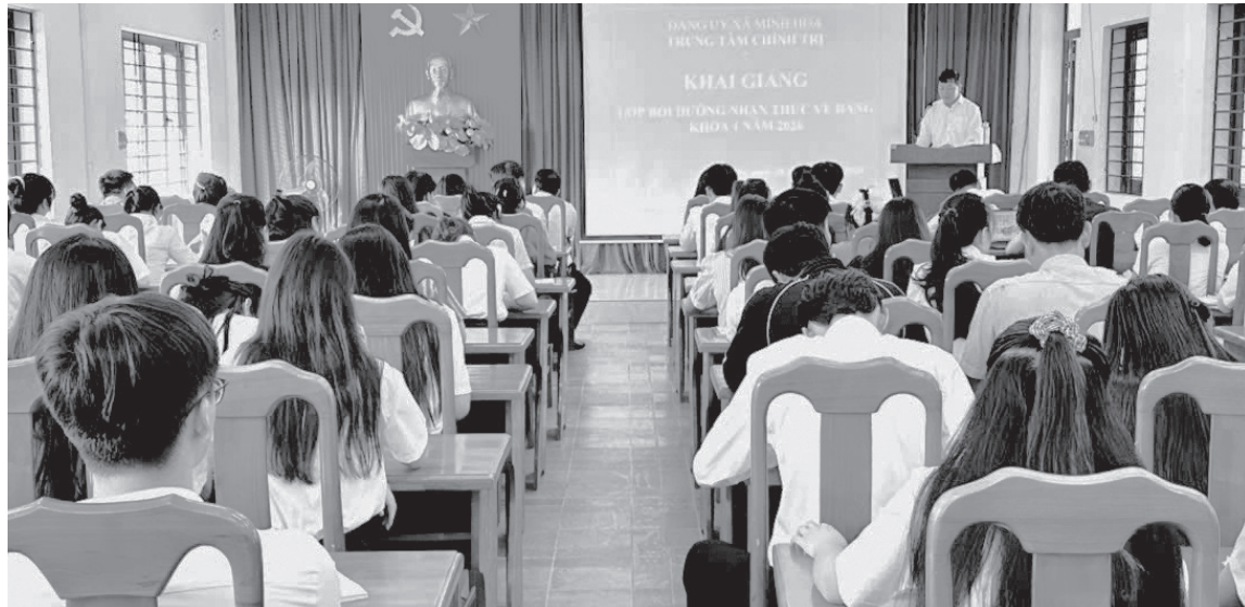
Trung tâm Chính trị xã Minh Hóa khai giảng khóa bồi dưỡng nhận thức về Đảng khóa 1 năm 2026 cho quần chúng ưu tú

Cùng với việc củng cố, xây dựng và nâng cao chất lượng hoạt động của tổ chức đảng, thời gian qua, Đảng bộ xã miền núi Minh Hóa luôn chú trọng phát hiện, bồi dưỡng, tạo nguồn phát triển đảng viên trong thế hệ trẻ. Đây là sự bổ sung lực lượng, trẻ hóa đội ngũ đảng viên, góp phần nâng cao năng lực lãnh đạo và sức chiến đấu của tổ chức đảng.