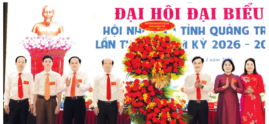
Các đồng chí lãnh đạo tỉnh tặng hoa chúc mừng đại hội