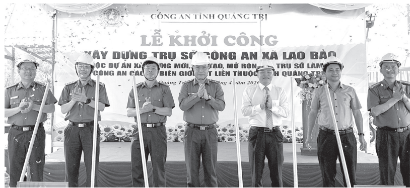
Các đại biểu thực hiện nghi thức khởi công xây dựng trụ sở Công an xã