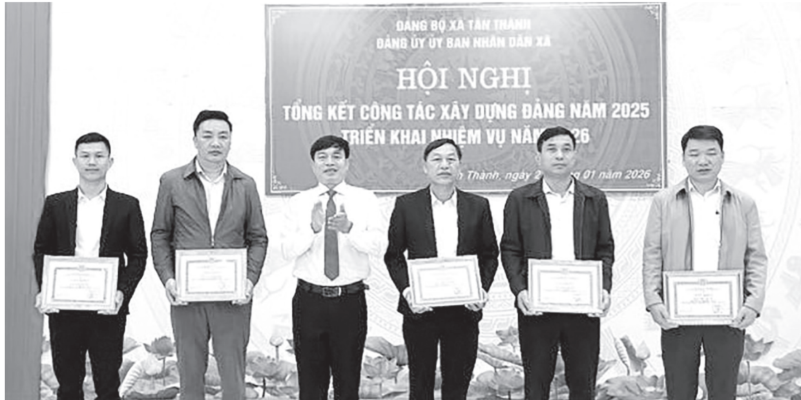
Lãnh đạo xã Tân Thành tặng giấy khen cho các cá nhân có thành tích xuất sắc trong công tác xây dựng Đảng

Ngay sau Đại hội đại biểu Đảng bộ xã lần thứ I, nhiệm kỳ 2025-2030, Ban Thường vụ Đảng ủy xã Tân Thành đã tập trung lãnh đạo, chỉ đạo xây dựng và ban hành các chương trình hành động, kịp thời đưa nghị quyết đại hội vào cuộc sống. Các nhiệm vụ trọng tâm: Tăng cường xây dựng, chỉnh đốn Đảng và hệ thống chính trị trong sạch, vững mạnh; phát triển kinh tế, khoa học, công nghệ, bảo vệ môi trường; phát triển văn hóa, xã hội, con người; bảo đảm quốc phòng-an ninh... được tăng cường thực hiện.