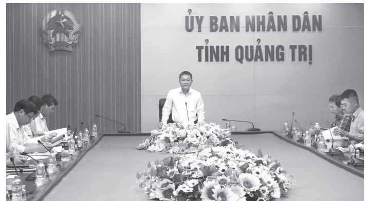
Đồng chí Phan Phong Phú, Phó Chủ tịch UBND tỉnh phát biểu tại buổi làm việc

Tại dự án đường 2 đầu cầu dây văng sông Hiếu-giai đoạn 1 đi qua địa bàn phường Đông Hà có chiều dài 0,9km với tổng diện tích thu hồi hơn 25.000m 2 , số hộ dân bị ảnh hưởng 79 trường hợp, tái định cư 41 trường hợp. Dự án đi qua khu vực đông dân cư nên công tác giải phóng mặt