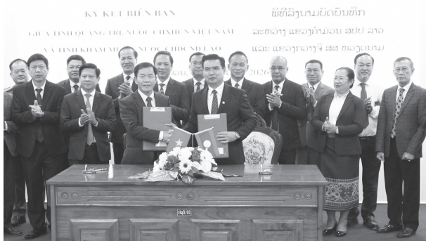
Lãnh đạo tỉnh Quảng Trị và tỉnh Khăm Muôn ký thỏa thuận hợp tác giai đoạn 2026 - 2030