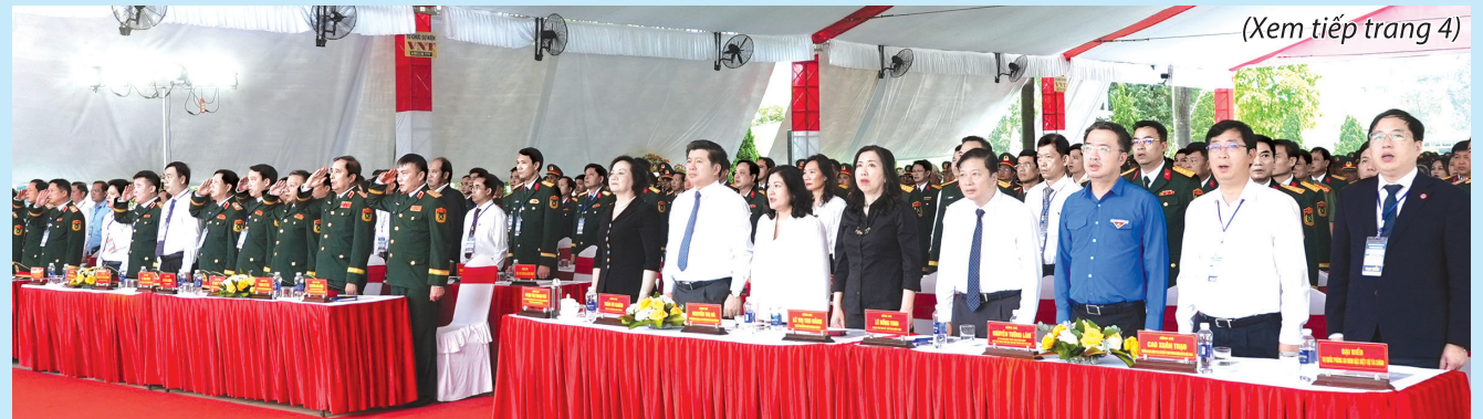
Quang cảnh lễ phát động “Chiến dịch 500 ngày đêm đẩy mạnh thực hiện tìm kiếm, quy tập và xác định danh tính hài cốt liệt sĩ”