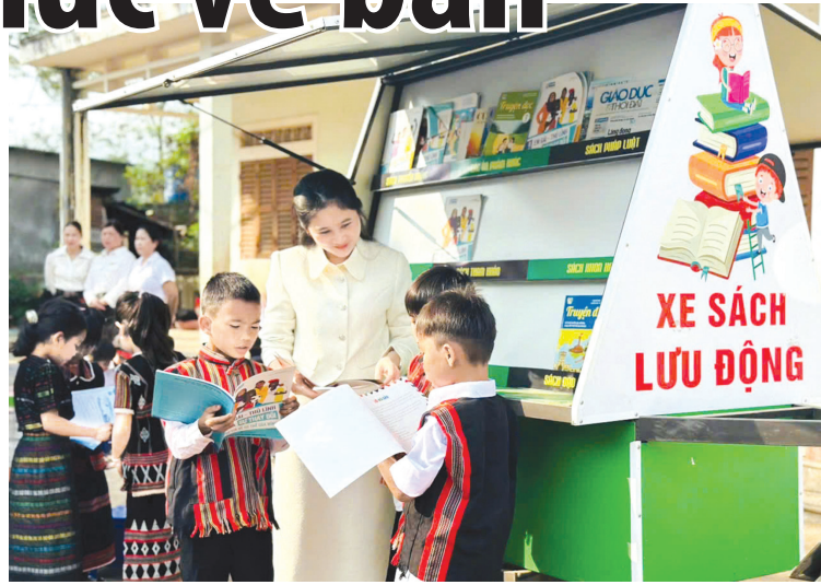
Xe sách lưu động “Chuyến xe tri thức” của Trường tiểu học và THCS A Xing tổ chức ở thôn A Quan thu hút đông đảo học sinh và người dân địa phương đến tham gia đọc sách

“Chúng tôi xem hoạt động “Chuyến xe tri thức” không chỉ là hoạt động ngoại khóa ý nghĩa mà còn là cách nhà trường tạo động lực để học sinh vùng cao trở lại trường sau kỳ nghỉ Tết, bắt đầu năm học mới với tinh thần chủ động, ham học và khát vọng vươn lên. Để duy trì hoạt động này, nhà trường đang nỗ lực kêu gọi các nhà hảo tâm tặng thêm nhiều đầu sách để hoạt động có thể triển khai thường xuyên đến với các địa bàn vùng xa và khó khăn hơn. Việc đưa sách đến gần hơn với người dân nhằm khuyến khích, phát triển phong trào đọc sách trong cộng đồng; hình thành