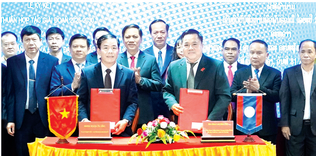
Tỉnh ủy Quảng Trị và Tỉnh ủy Xê Kông ký thỏa thuận hợp tác giai đoạn 2026-2030