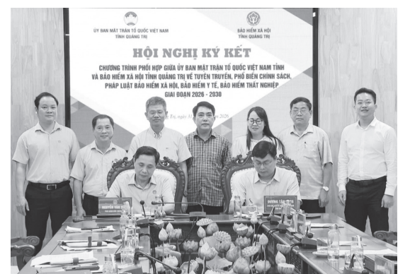
HẢI ĐĂNG Các đơn vị ký kết quy chế phối hợp - Ảnh: H.Đ