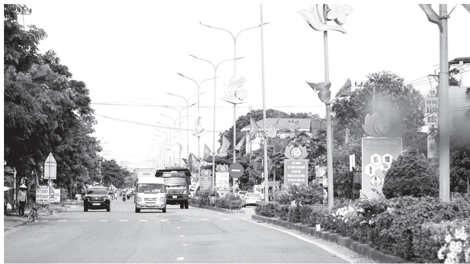
Một góc xã Cam Lộ hôm nay - Ảnh: X.D

Trước tình hình đó, Đảng bộ, chính quyền xã Cam Lộ xác định, phải thẳng thắn phân tích, nhận diện những khó khăn, điểm nghẽn với quan điểm khó