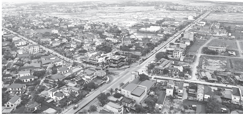
Diện mạo phường Bắc Gianh ngày càng khởi sắc

Bên cạnh nông, ngư nghiệp, các lĩnh vực công nghiệp, tiểu thủ công nghiệp và thương mại-dịch vụ cũng duy trì đà tăng