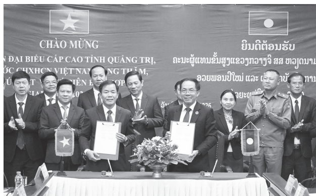
Lãnh đạo tỉnh Quảng Trị và tỉnh Sả-lạ-văn ký kết biên bản thỏa thuận hợp tác giai đoạn 2026-2030