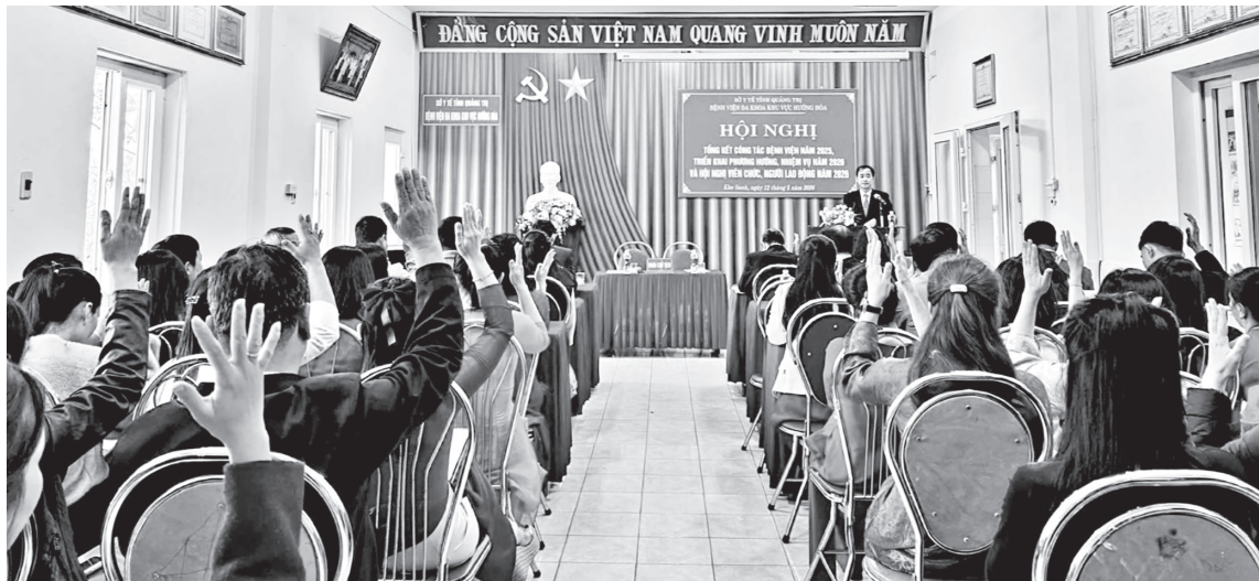
Hội nghị viên chức, người lao động là diễn đàn để viên chức, người lao động của Bệnh viện đa khoa khu vực Hướng Hóa phát huy quyền làm chủ

Công đoàn cơ sở (CĐCS) đã chủ động phối hợp với ban giám đốc kiểm điểm việc thực hiện các nghị quyết, chủ trương của Đảng và chính sách, pháp luật của Nhà nước. Phương châm "Dân biết, dân bàn, dân làm, dân kiểm tra" đã tạo sự đồng thuận cao, đặc