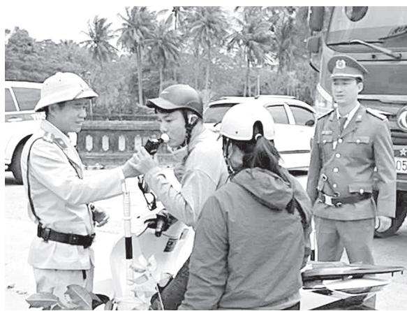
Lực lượng chức năng đã xử lý 1.491 trường hợp vi phạm nồng độ cồn

T hông tin từ Ban An toàn giao thông tỉnh cho biết, trong 3 tháng đầu năm 2026, các lực lượng chức năng đã phát hiện và lập biên bản xử lý 4.933 trường hợp vi phạm trật tự an toàn giao thông (TTATGT) với tổng số tiền phạt hơn 14,3 tỉ đồng.