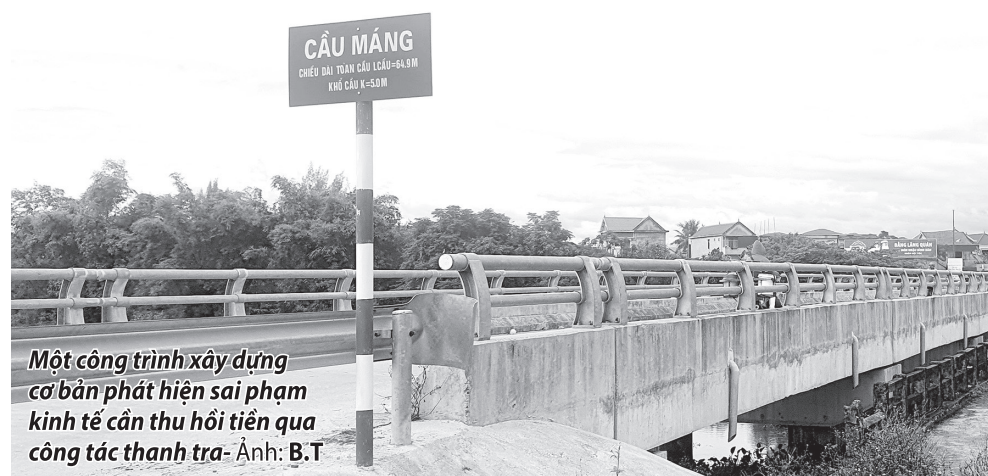
Một công trình xây dựng cơ bản phát hiện sai phạm kinh tế cần thu hồi tiền qua công tác thanh tra