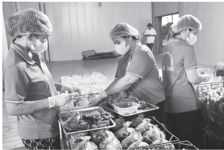
Các hợp tác xã trên địa bàn tỉnh tập trung sản xuất từ những tháng đầu năm - Ảnh: C.N

Theo bà Oanh, mặc dù đang duy trì ổn định hoạt động sản xuất, tuy nhiên muốn phát triển, mở rộng quy mô thì HTX