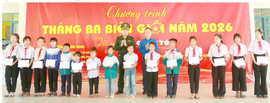
Tinh đoàn Quảng Trị trao tặng 70 suất học bổng cho các em học sinh có hoàn cảnh khó khăn trên địa bàn xã La Lay

Sáng 31/3/2026, Ban Thường vụ Tỉnh đoàn, Ban Thư ký Hội LHTN Việt Nam tỉnh tổ chức chương trình “Tháng ba biên giới” năm 2026 tại xã La Lay. Chương trình có sự đồng hành của Hội LHTN Việt Nam TP. Đà Nẵng, Tổ chức Project Việt Nam Foundation và Hội Thầy thuốc trẻ tỉnh Quảng Trị.