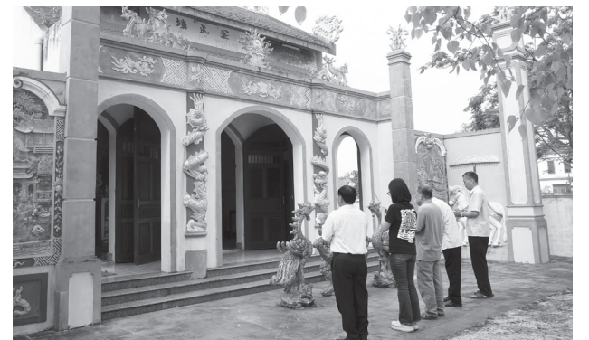
Đền Võ Thánh, niềm tự hào của người dân làng Thổ Ngọa, được phục dựng, tôn tạo, trở thành điểm sinh hoạt văn hóa tâm linh của cộng đồng

Làng còn nổi tiếng với nghề làm nón lá, được xem là chiếc nôi của nhiều làng nón trong vùng. Từ công việc lao động thường ngày đã tạo nên nét sinh hoạt văn hóa riêng khi trai gái vừa làm nón, vừa hát hò đối đáp. Con gái Thổ Ngọa không chỉ đảm đang mà còn nổi tiếng xinh đẹp. Cùng với đó, buôn bán cũng là nghề khá phát triển của cư dân