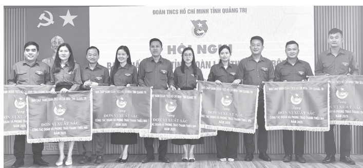
Tặng Cờ thi đua cho các tập thể đạt danh hiệu đơn vị xuất sắc trong công tác Đoàn và phong trào thanh thiếu nhi năm 2025