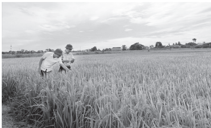
Lãnh đạo xã Gio Linh kiểm tra tình hình sản xuất nông nghiệp trên địa bàn

Để hiện thực hóa mục tiêu này, Đảng ủy xã tập trung chỉ lãnh đạo, chỉ đạo triển khai đồng bộ các giải pháp. Trong đó, chú trọng đẩy mạnh công tác quảng bá, xúc tiến đầu tư, cải cách hành chính, giải phóng mặt bằng nhằm tạo môi trường thuận lợi thu hút doanh nghiệp đầu tư triển khai các dự án trên địa bàn, nhất là các dự án công nghiệp công nghệ cao, may mặc, sản xuất vật liệu xây dựng... Tích cực phối hợp với các cơ