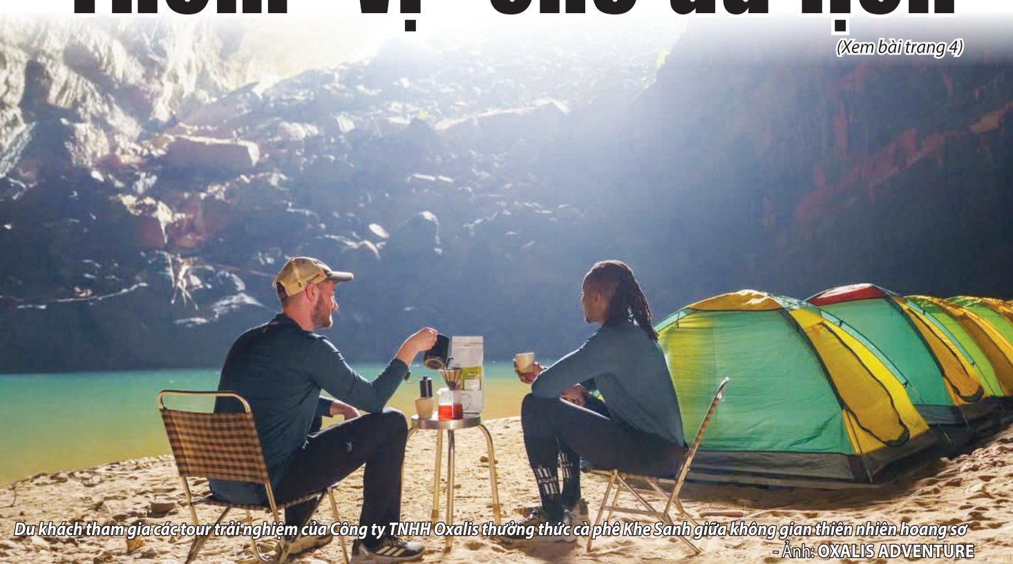
Du khách tham gia các tour trải nghiệm của Công ty TNHH Oxalis thưởng thức cà phê Khe Sanh giữa không gian thiên nhiên hoang sơ