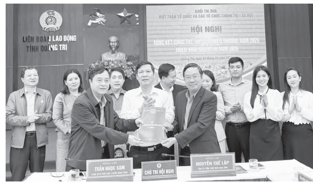
Các đơn vị ký kết giao ước thi đua

Ngày 29/1/2026, Khối thi đua Mặt trận và các tổ chức chính trị-xã hội tỉnh tổ chức hội nghị triển khai nhiệm vụ và ký kết giao ước thi đua năm 2026.