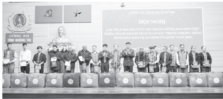
Trao quà cho người có uy tín trong đồng bào dân tộc thiểu số có thành tích xuất sắc trong phong trào "Toàn dân bảo vệ an ninh Tổ quốc" năm 2025