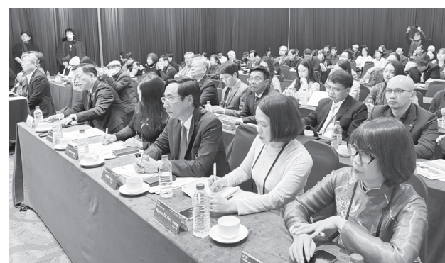
Các đại biểu tham dự hội nghị