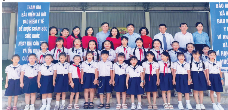
Ngày hội tuyên truyền, tư vấn, giải đáp chính sách bảo hiểm y tế học sinh, sinh viên

Theo số liệu thống kê, tính đến ngày 31/8/2025, trước thềm năm học 2025-2026, toàn tỉnh có 330.961 HSSV tham gia BHYT, đạt tỉ lệ 99% trên tổng số HSSV. Như vậy, vẫn còn hơn 3.300 em chưa tham gia BHYT, chủ yếu tập trung tại một số địa bàn vùng sâu, vùng xa, vùng có điều kiện kinh tế-xã hội còn khó khăn. Thực tế này đặt ra nhiều thách thức trong việc triển khai thực hiện chính sách BHYT đối với HSSV. Yêu cầu phải có những giải pháp quyết liệt, sát