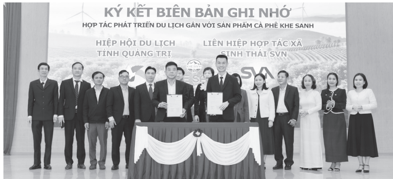
Ký kết biên bản ghi nhớ hợp tác phát triển sản phẩm du lịch gắn với cà phê Khe Sanh

Không chỉ cảnh sắc, nhiều điểm đến được định vị bằng chính những giá trị bản địa. Tại Quảng Trị, cao nguyên Khe Sanh đang đứng trước cơ hội tương tự khi hạt cà phê trở thành một trải nghiệm du lịch, để du khách có thể chạm, nghe, nếm và hiểu về văn hóa của vùng đất.