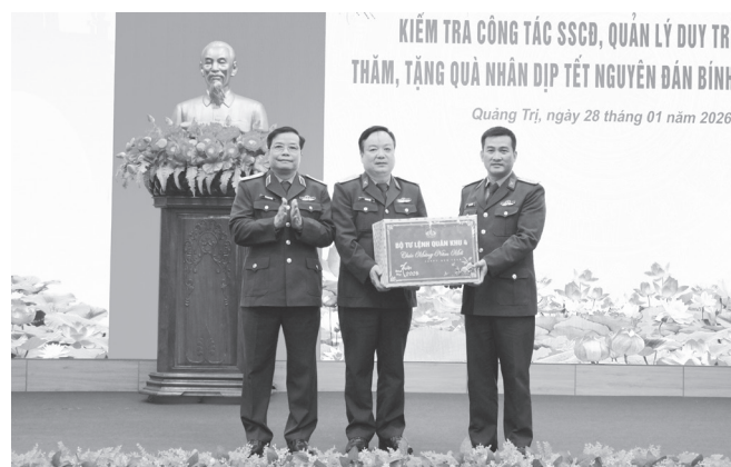
Thiếu tướng Ngô Nam Cường, Phó Tư lệnh Quân khu tặng quà và chúc Tết Bộ Chỉ huy Quân sự tỉnh

trọng các bộ phận trực, bộ phận lẻ, vùng sâu, vùng xa; tham mưu, phối hợp tốt với cấp ủy, chính quyền và Nhân dân địa phương tổ chức các hoạt động thiết thực, ý nghĩa; đồng thời, chủ động chuẩn bị tốt cho kế hoạch năm 2026, bảo đảm thực hiện thắng lợi các nhiệm vụ ngay từ ngày đầu, tháng đầu.