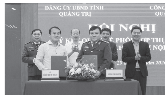
Ban Thường vụ Đảng ủy UBND tỉnh, Công an tỉnh tổ chức ký kết quy chế phối hợp thực hiện công tác bảo vệ chính trị nội bộ Đảng

Chiều 29/1/2026, Ban Thường vụ Đảng ủy UBND tỉnh phối hợp với Công an tỉnh tổ chức ký kết quy chế phối hợp thực hiện công tác bảo vệ chính trị nội bộ Đảng. Tham dự có đại diện lãnh đạo Ban Tổ chức Tỉnh ủy, Đảng ủy UBND tỉnh, Công an tỉnh.