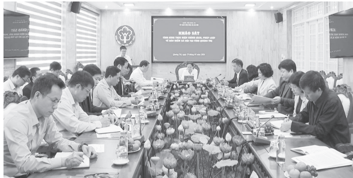
Quang cảnh buổi làm việc